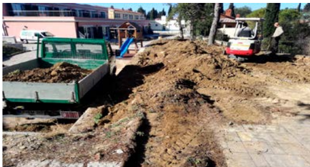
Z ureditvijo okolice smo pridobili dodaten prostor za zabavna druženja in poskrbeli, da se boste še bolje počutili.

končano, bo res kot v raju. Upamo, da boste veseli kot mi.