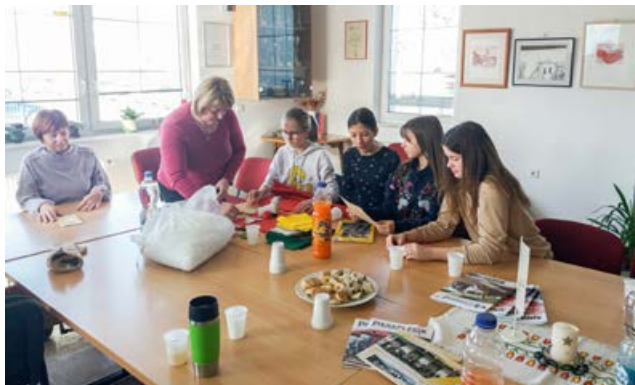
Demonstracija različnih tehnik ročnih del