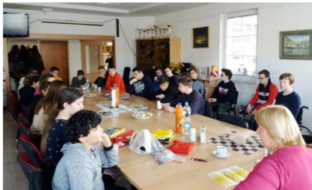
Predstavitve društva učencem OŠ Drska

njegovo delovanje in aktivnosti, ki jih izvaja, ter jih opozorili na vzroke invalidnosti. Učenci so z zanimanjem prisluhnili tudi osebnim zgodbam posameznih članov. Po predstavitvi so zastavili mnogo vprašanj, na katera smo jim z veseljem odgovorili.