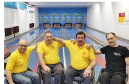
Naši kegljači na Grnjakovem memorialu

Sicer pa so v društvu že stekle priprave na redni Zbor članov, ki bo tokrat tudi volilen. Sestala se je inventurna