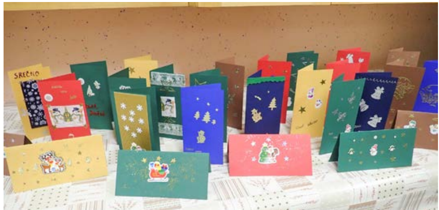
Zbirka izdelanih voščilnic

Teden dni po izdelavi venčkov se izdelujejo božične voščilnice. V izdelovanju teh nismo nič manj večji, zato nas moram pohvaliti. Dan poprej zopet najprej nabavimo vse materiale, na četrtno večer se ekipa ponovno zbere in izdelovanje voščilnic steče. Potrebujemo jih za člane, saj dobi vsak voščilnico, ki je naključno izbrana, ter za vse ostale, ki jim voščimo vesel božič in vse lepo v novem letu. Najraje imamo trši papir zamolklih barv, temno rdeč, zelen, moder, rjav ... Na osnovo lepimo, slikamo, krasimo,