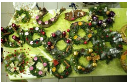
Naši božični venčki na ogled

Naš december na Koroškem je leto za letom poln dogodkov, drugačnega si ne znamo predstavljati. V bistvu se začne veseli december konec novembra, ko izdelamo božične venčke, ki jih je potrebno izdelati pravočasno. Po nabavi materialov se naslednji dan, tradicionalno ob četrtnih, zberemo vsi zainteresirani in se lotimo dela. Ne glede na to, kakšne so »sestavine« in koliko jih je za barviti božični venček za vrata ali za mizo, izpade prav lepo. Ko delamo, je v naši družbi polno smeha in glasnega čebljanja ob glasbi, čaju in pecivu. Potem vse izdelane venčke položimo skupaj in se nam zdi imenitno.