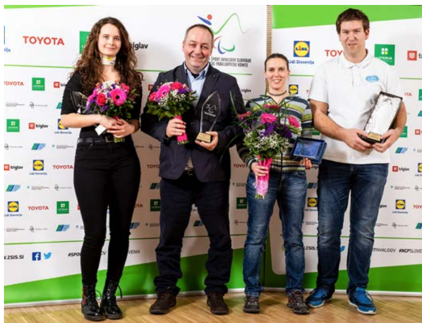
Najboljši v letu 2019

Program slovesne prireditve je povezovala Urška Kustura , obogatili in popestrili pa: Neja Zrimšek Žiger , Nastja Omahna in Trkaj s himno o parašportnikih.