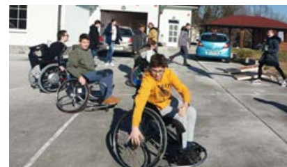
Učenci so preizkusili šport po naše.

V uvodnem delu dneva so nas učenci presenetili z bogatim kulturnim programom. Predstavili so svoje raznolike talente, igrali na klarinet, bobne, kitaro in harmoniko. Zaradi bližnjega kulturnega praznika, 8. februarja, pa so nam podrobno predstavili tudi življenje in delo slovenskega pesnika Franceta Prešerna. V nadaljevanju so članice in člani predstavili društvo,