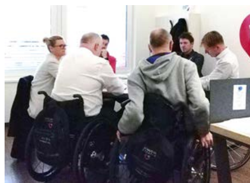
Delovni posvet o nadaljevanju uspešnega čebelarjenja

V nadaljevanju posveta so udeleženci izmenjali poglede in predstavili stališča za učinkovitejše in smelejše delo v prihodnje, kjer bi naši čebelarji in inštruktorji na invalidskih vozičkih s sodobno tehnologijo dobili kvalitetno podporo pri izobraževanju. Pomembno je, da bodo pri tem partnerstvu sodelovale tako Čebelarška zveza Slovenije, Slovenska čebelarška akademija, Zveza paraplegikov Slovenije kot Društvo paraplegikov Prekmurja in Prlekije, kjer naj bi projekt tudi