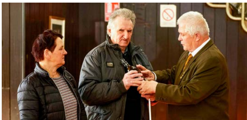
Steklenica arhivske slovenske kapljice slepemu čebelarju

črnine z nalepko v Braillovi pisavi, ki so jih ob 110-letnici napolnili v Kmetijski zadruzi Metlika.