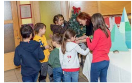
Otroci so pridno in skrbno okrasili smrečico.

okrasiti novoletno jelko. Še bolj pa so se razveselili ob prihodu dedka Mraza. Skupaj so zapeli pesmico in ponovili lepe besede, ki jih je naučil lani. In ker so bili pridni, so na koncu dobili darila.