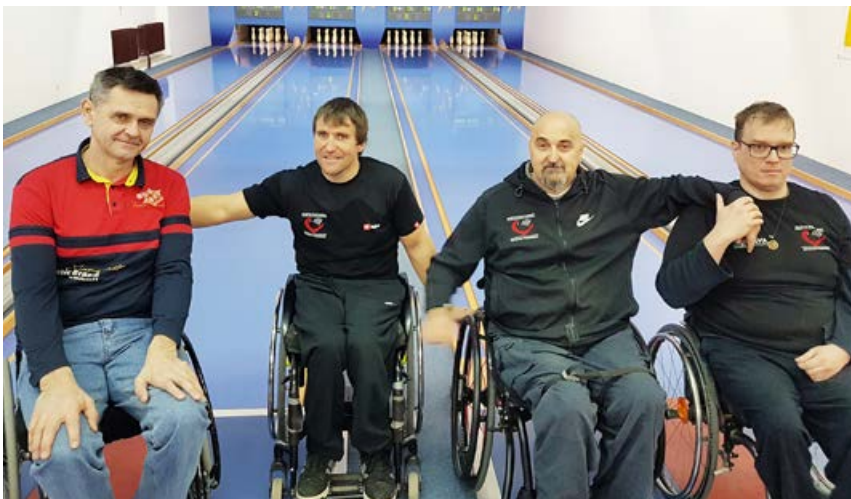
Severnoprimorski kegljači

Tokratni uspeh bo gotovo dobra spodbuda za naše kegljače, da se čim bolj pripravijo tudi na naslednje tekme.