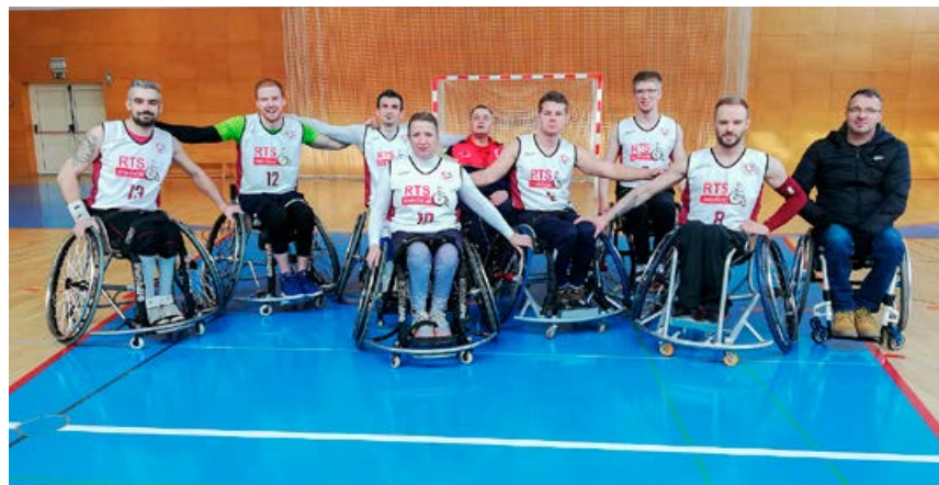
Združena ekipa DP Kranj – DP Novo mesto

DP Kranj – DP Novo mesto DP Celje Thermana DP Ljubljana Mercator DP Maribor