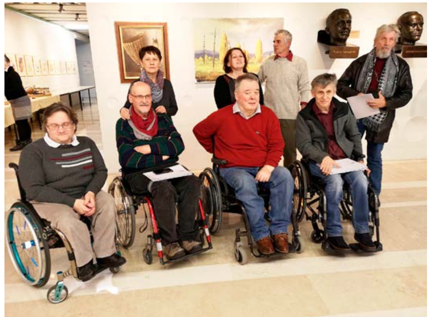
V Dolenčevi galeriji UKC Ljubljana