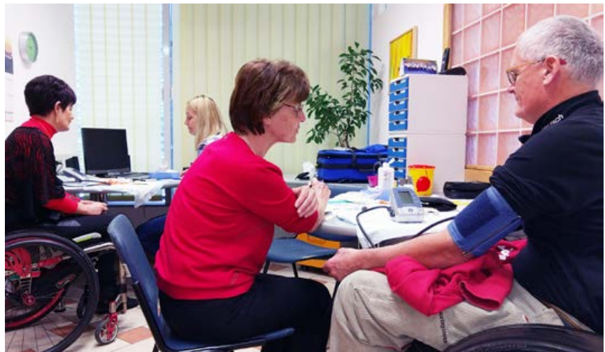
Preventivni pregled

Ponovno opozarjamo, da nam zdravje ni podarjeno, zanj moramo skrbeti sami. Seveda pa so pri večini potrebna tudi odrekavanja. Ne moremo se kar v nedogled razvajati s prekomernim uživanjem kave, sladkarij, alkohola, cigaret, sedenjem in drugimi, na prvi pogled prijetnimi razvadami.