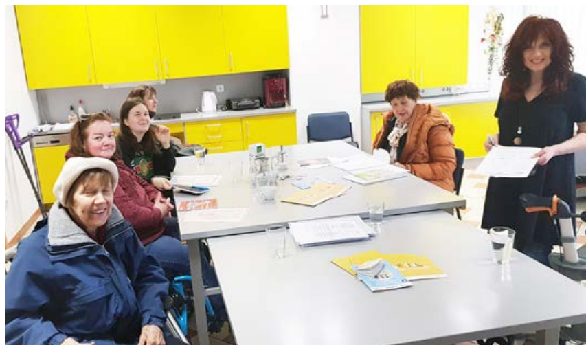
Kaj vse skriva in odkriva naša pisava?

Analiza pisave spada tudi pod umetnost, saj razkriva osebnost posameznika. Med pisanjem se nikoli ne osredotočamo na to, kako pišemo, ampak s pomočjo roke napišemo tisto, o čemer trenutno razmišljamo.