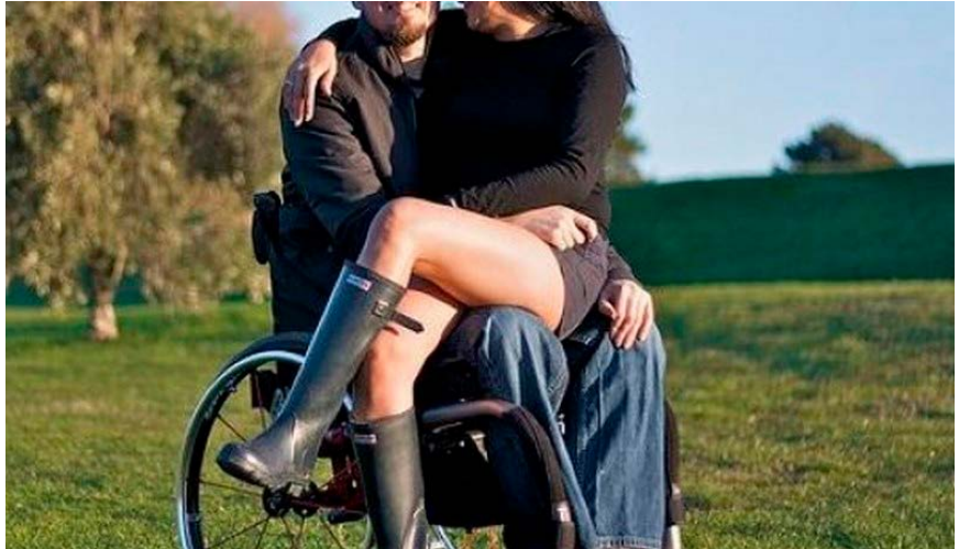
Bonding je sočasna čustvena odprtost in fizična bližina.

Ker je sprejem dejstva invalidnosti čustveno naporen in boleč proces tako za invalidno osebo kot za njihove svojce, je bonding psihoterapevtska modaliteta z nekaterimi prilagodit-