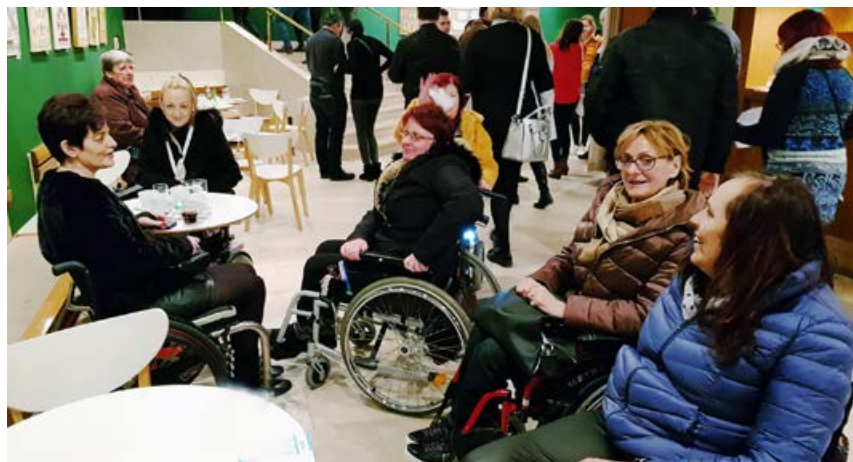
V operni hiši so nas lepo sprejeli.

Komaj sedemnajstletna Ivana Orleanska je poveljevala francoski kraljevi vojski in z vojaškimi zmagami tehtnico v stoletni vojni odločilno prevesila na stran Francozov. Toda vojvoda Burgundski jo je priprl in prodal Angležem, kjer jo je proangleška duhovščina na montiranem sodnem procesu obtožila krivoverstva in jo obsodila na usmritev s sežigom na