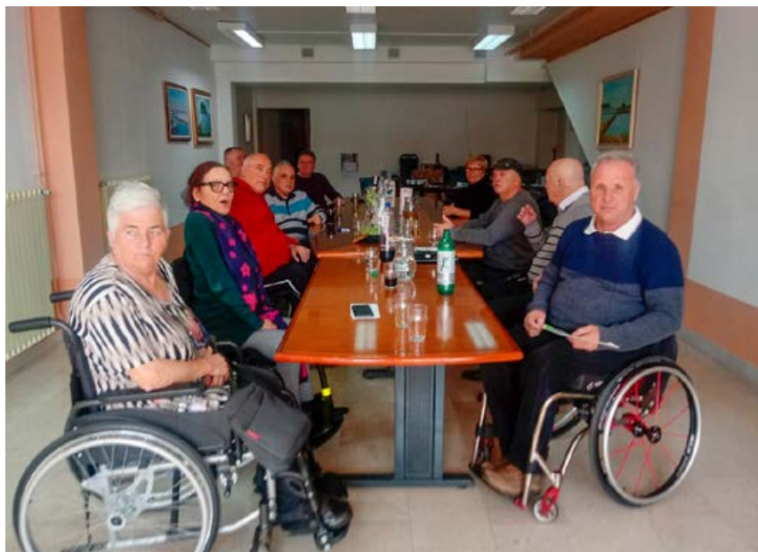
Redna seja Upravnega odbora društva

zornega Odbora Društva ter določili kandidacijsko volilno komisijo.