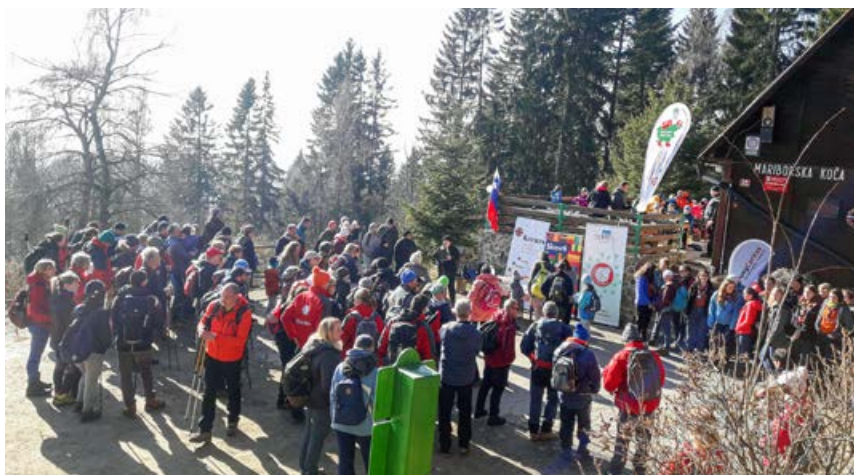
Zbrani invalidi in spremljevalci na Mariborski koči

K akšna simbolika in moč – na praznično soboto, 8. februarja, so pred Mariborsko kočico podpisali dogovor o sodelovanju med Planinsko zvezo Slovenije – odbora »Planinstvo za invalide/OPP« s Slovensko Karitas, Združenjem slovenskih katoliških skavtinj in skavtov in Zvezo tabornikov Slovenije. S tem je vzpostavljen pomemben podporni člen za izvajanje akcij, namenjenih invalidom odbora PIN/OPP, invalidom, med katerimi je tudi »Gibalno ovirani gore osvajajo GOGO 2020«, katere nosilec je Zveza paraplegikov Slovenije, saj ji bodo nudili tako potrebno podporo s spremljevalci/prostovoljci. Predvsem nas veseli smiselno povezovanje humanitarnih in invalidskih organizacij ter krepitev odprte družbe.