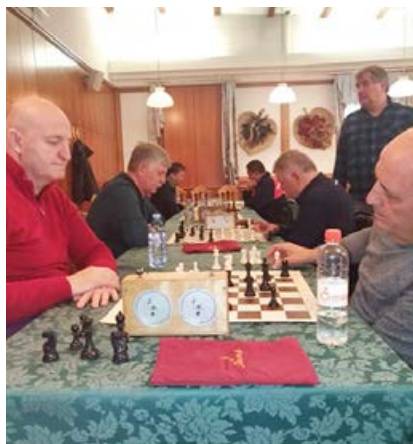
Šahisti v Naklem odigrali 3. krog šahovske lige ZPS-GRADDEX