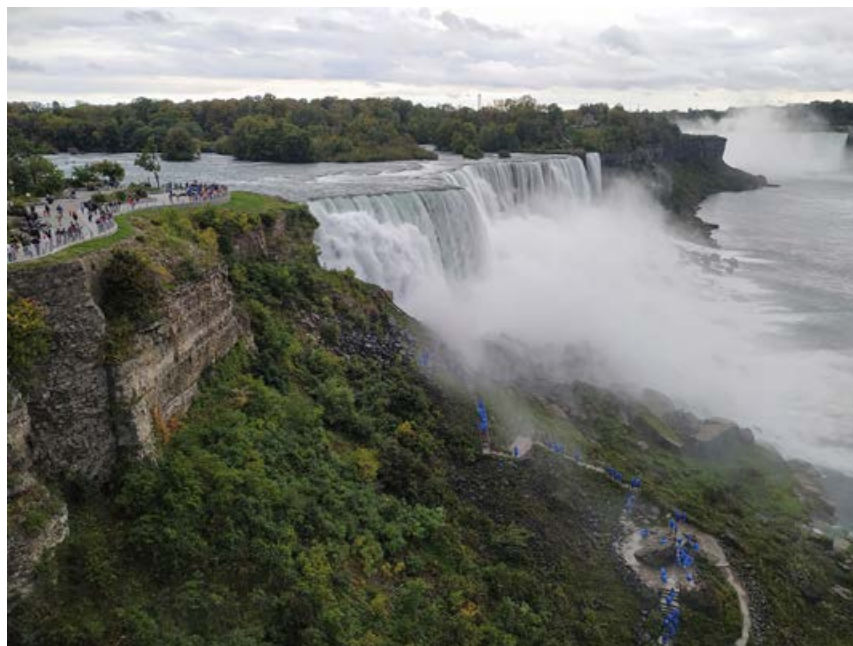
Na plavi strani Niagare

smer. Tu naj zapišem, da pločniki niso bili ravno prijazni vozičkom. Puklasti in ozki, vsaj v bližini hotela. Polovica mesta je bolj na hribu. Dokler je bilo še svetlo, sva šla malo okrog, zapravila sem nekaj kanadskih dolarjev. Nakup sva odnesla v hotel in se odločila, da greva na večerjo. Že prej sem opazila BBQ lokal, ki mi je bil všeč, zato sva šla tja. Dobro sva se najedla, oni pa s pico niso bili zadovoljni. Sodelavka mi je dala stare dolarje, ki pri nas že zdavnaj več ne veljajo, če bi jih lahko tam porabila. Ko sem jih pokazala natakari in jo vprašala, če lahko z njimi plačam, je bila strašno vesela, ker jih že zelo dolgo ni videla. Po večerji sva naredila še krajši sprehod in se vsa prezebla vrnila v hotel. Z vozičkom tako ali tako ni šlo v vse smeri, ker je hrib. Ob polnoči je bil pri slapovih tradicionalni ognjemet, vendar sva se že prej odločila, da se ga ne udeleživa. Na splošno nisva pristaša ognjemetov in drugega pokanja in v tem ne uživava. Kako bi lahko uživala, če vem, da se živali bojijo, ko to poslušajo, in to tako domače kot prstoživeče. Ne razumejo, kaj se dogaja. Ko sva že hotela zaspati, nisva znala ugasniti luči nad posteljo. Ko smo prišli, jo je prižgal sobar, ko nama je pokazal sobo in vprašal, če želiva še kaj. Vsa stikala sva