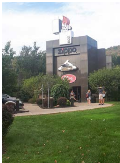
Kadi ali ne, v Zippo muzeju je treba enega kupiti!