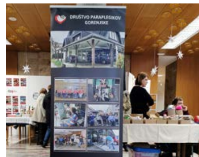
Sodelovali smo na razstavi Invalidi nekoč in danes.