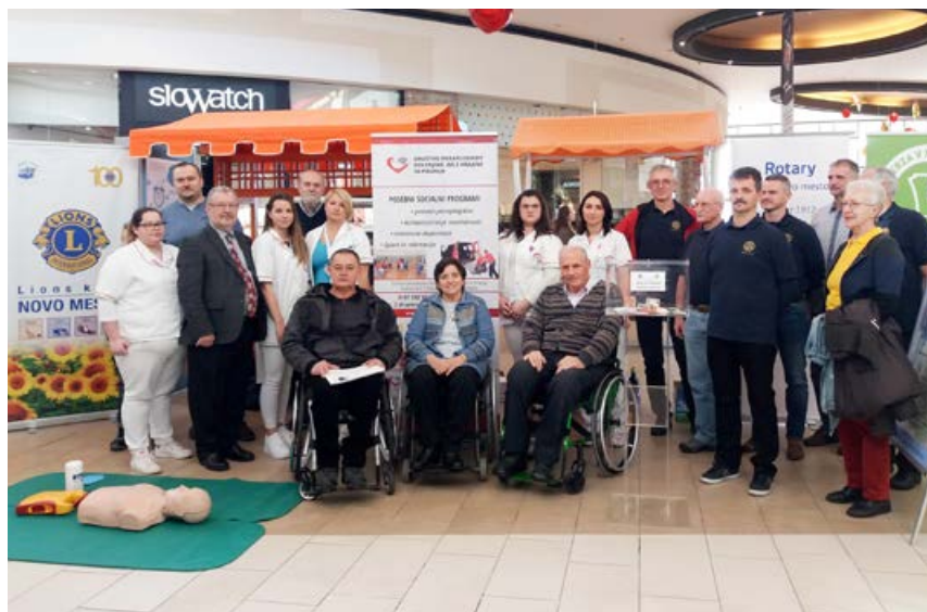
Zbrani na dobrodelnem dogodku v Qlandiji

Izkupiček dobrodelnega dogodka in zbranih sredstev donatorjev bodo organizatorji namenili našemu društvu kot pomoč pri že nabavljenem vozilu (pred dvema letoma) za prevoze članov.