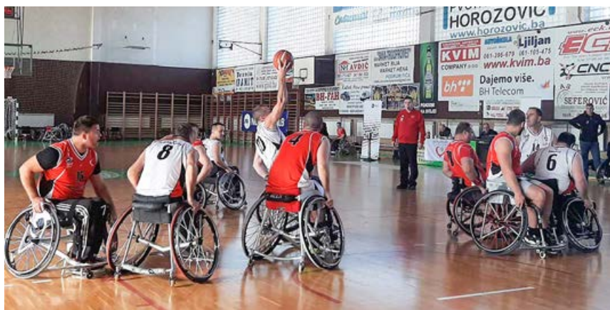
Tekma v drugem krogu v Sanskem Mostu (Foto: arhiv Dečman)

Tekmovanje je 7. decembra 2019 v športni dvorani Krešimira Ćosića pripravila domača ekipa KKOI Zadar. Na srečanju sta igralce nago-