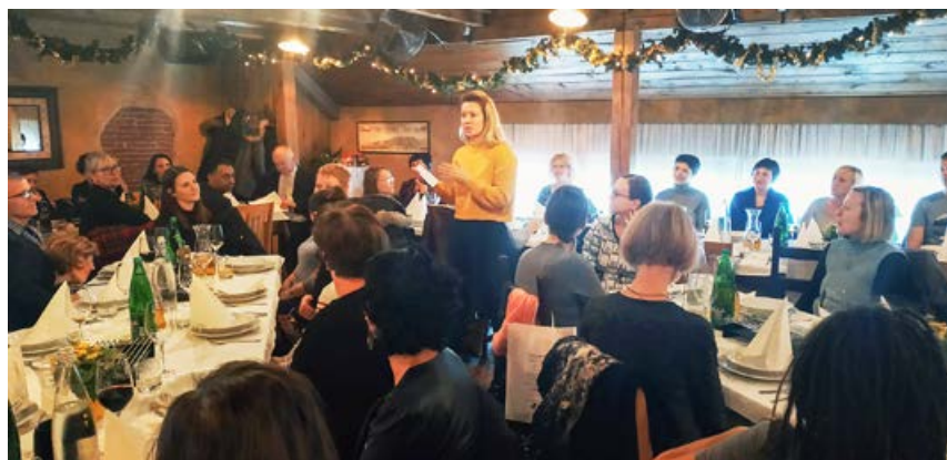
Na srečanju ob izteku leta

P redsednik je med drugim pripomnil: »Sodelujete v organizaciji, ki ima petdesetletno zgodovino organiziranega delovanja in v devetih lokalnih društvih združuje paraplegike in tetraplegike. Za njih izvaja šest posebnih socialnih programov, od začetka letošnjega leta pa tudi dejavnost po Zakonu o osebni asistenci. Kot odgovoren delodajalec želimo, da se v organizaciji dobro počutite, razvijate svoje poklicne pristojnosti in hkrati z vso odgovornostjo opravljate svoje delo do naših uporabnikov. V končni fazi so namreč za dostojno in kvalitetno življenje odvisni prav od vašega profesionalnega pristopa. Zveza paraplegikov si bo tudi v prihodnje prizadevala za urejene delovne pogoje, še naprej bo skrbela za ustrezno delovno zaščitni material, financirala bo dodatno pokojninsko in invalidsko zavarovanje, zagotavljala finančna sredstva za primerne osebne dohodke primerljive v javnem