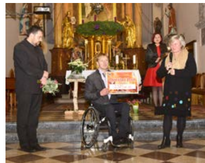
Na dobrodelnem koncertu so se zbirala sredstva za ureditev vrtnega prostora na sedežu DPPP.