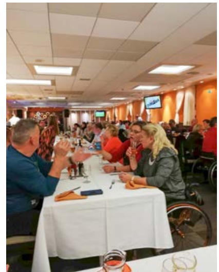
Na novoletnem srečanju smo se zbrali v velikem številu.