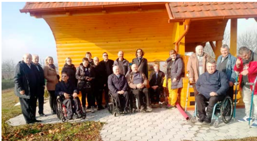
Na društvu smo gostili predstavnike s področja čebelarstva.

Gospod Sever je predstavil idejno zasnovano čebelarjenje na vozičkih ter gradnjo učnega čebelnjaka, ki so si ga vsi skupaj ob koncu srečanja tudi ogledali. Sam zelo spodbuja idejo o izobraževanju čebelarjev inštruktorjev