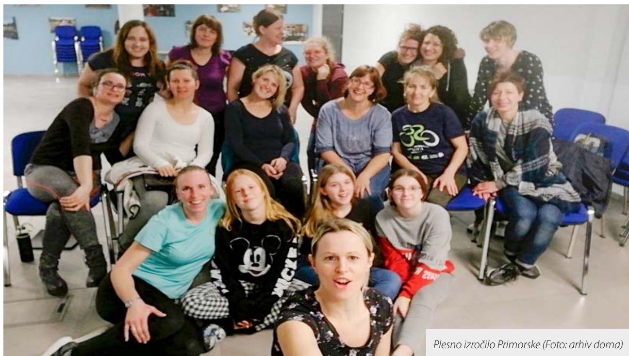
Plesno izročilo Primorske

k nam kot udeleženci seminarjev ali kot posamezniki z družinami. Zatorej na snidenje pri nas.