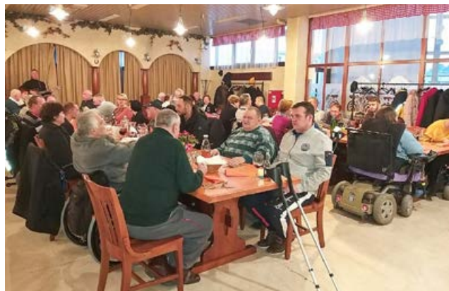
Prijetno druženje v gostišču Emonec.

Vanganelška 8/f, 6000 KOPER Spletna stran: društvo-para-kp.si E-pošta: dpik.koper@gmail.com