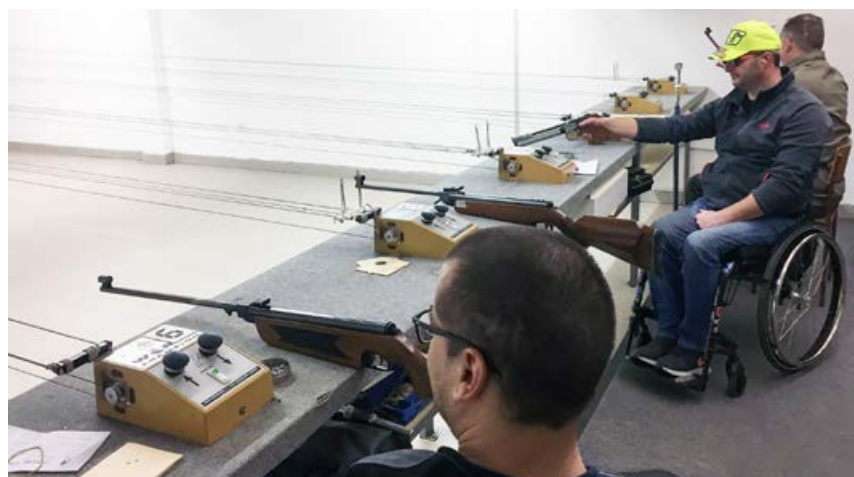
Na strelišču Bukovec v Jakličevem domu na Vidmu

V ekipni konkurenci je prvo mesto suvereno osvojila ekipa strelcev DP Murska Sobota (1.088), na drugo mesto se je uvrstila DP Maribor (1.038), na tretje pa ekipa našega društva (970). Četrta