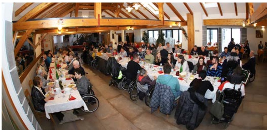
Prednovoletno srečanje v Gostilni Pugelj