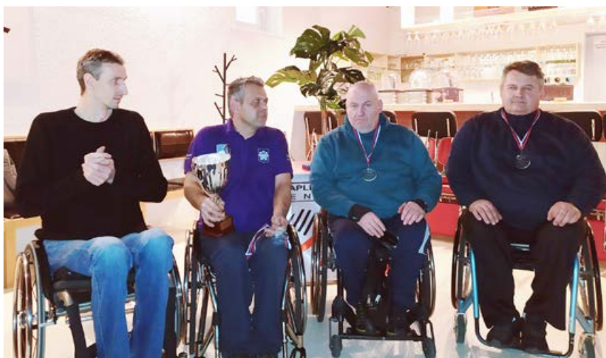
Najboljši na enajstem meddruštvenem turnirju

v vsaki pa je bil kot nosilec skupine po en boljši igralec iz prejšnjega turnirja (Slaček-Zupančič). To je preprečilo izpad najboljših igralcev. Igrali so po sistemu vsak z vsakim, zato se je tekmovanje tudi nekoliko zavleklo. Po dveh dobljenih igrah sta se v nadaljevanje tekmovanja uvrstila po dva najboljša igralca iz posameznih skupin.