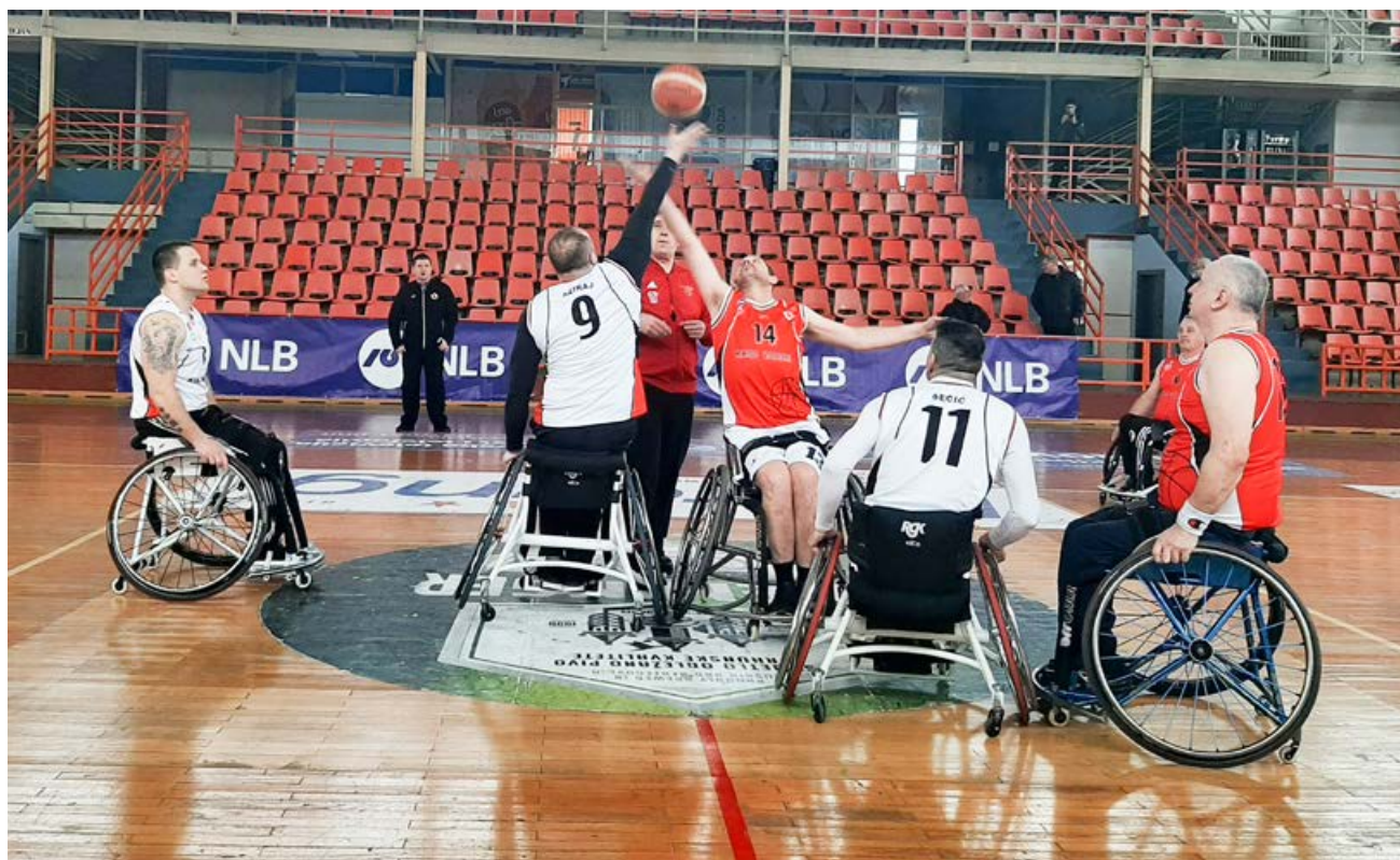
Začetni met na tekmi tretjega kroga v Bihaću