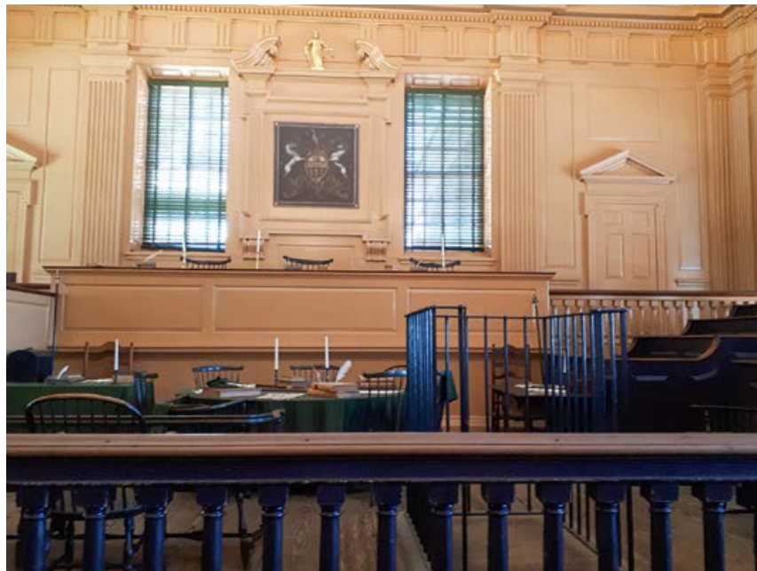
INDEPENDENCE HALL-Philadelphia, kjer je bila podpisana deklaracija za mir in napisana prva ameriška ustava

Vzleteli smo zgodaj zjutraj, po sončnem vzhodu, in pogled z letala na pokrajino, obsijano s soncem, je bil res lep. Let je bil poln turbulenc in ko sem po nekaj urah želela na WC, sem morala čakati precej dolgo, da minejo, saj smo morali biti vsi na svojih sedežih. Ko so bile turbulence končno mimo in so mi začeli pripravljati WC, se je zatikalo pri vratih in je zopet trajalo nekaj časa. Ker so WC-ji zelo ozki, za nas iz dveh sosednjih naredijo enega malo večjega, da je prostora za dva