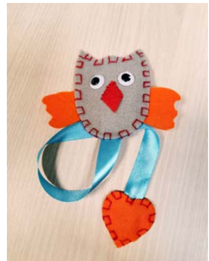
Kazalo za knjige