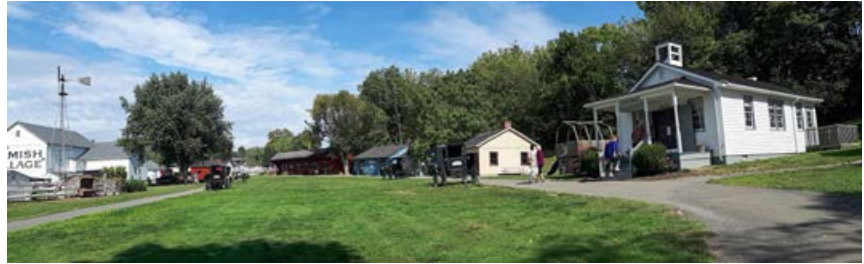
Celo barva obleke je ponekod zapovedana

Naslednji dan smo se ustavili pri Amiših, kar je bilo na Aninem seznamu želja. Sicer se pa tam tako ali tako vsi ustavljajo, ker je v ZDA vse do mak-