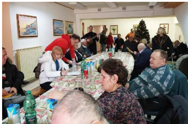
Najprej smo se zbrali v prostorih društva