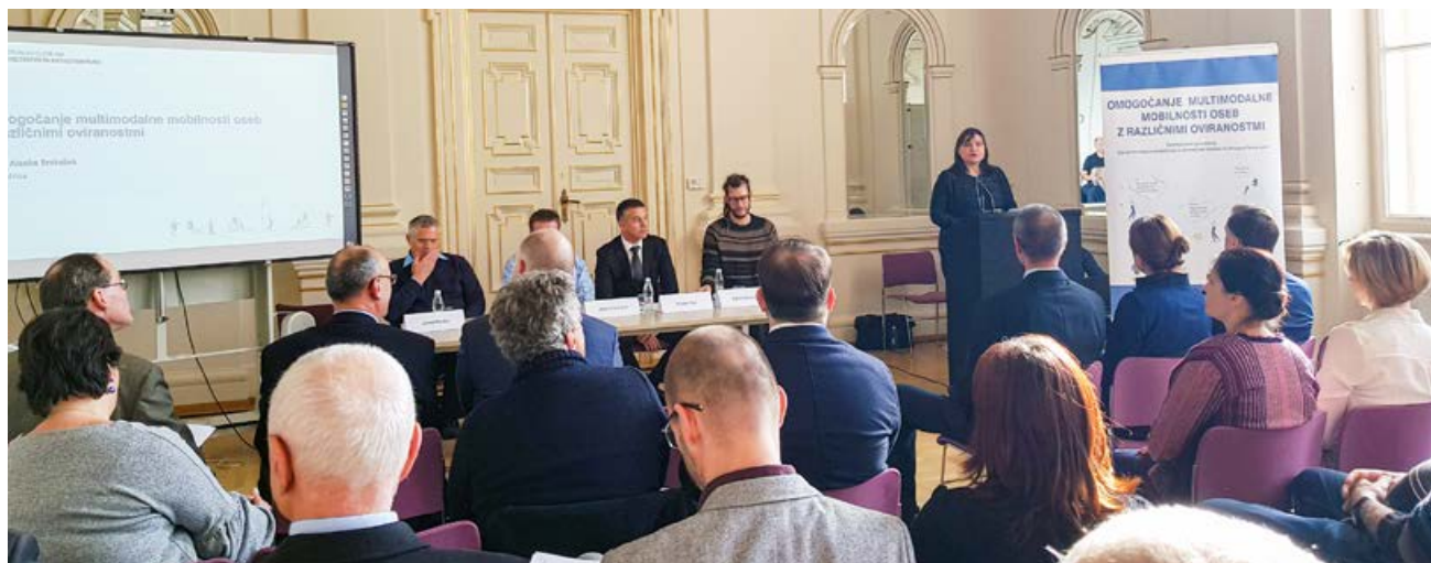
Na predstavitvi projekta v Narodni galeriji v Ljubljani

Promocijski dogodki so že v lanskem letu potekali: v Postojni za južno primorsko in notranjsko-kraško regijo, v Mariboru za Štajersko, Pomurje in Prekmurje, v Celju za štajersko, savinjsko in zasavsko regijo, v Novem mestu za Dolenjsko in Posavje, v Kranju za gorenjsko regijo in v Slovenj Gradcu za koroško regijo.