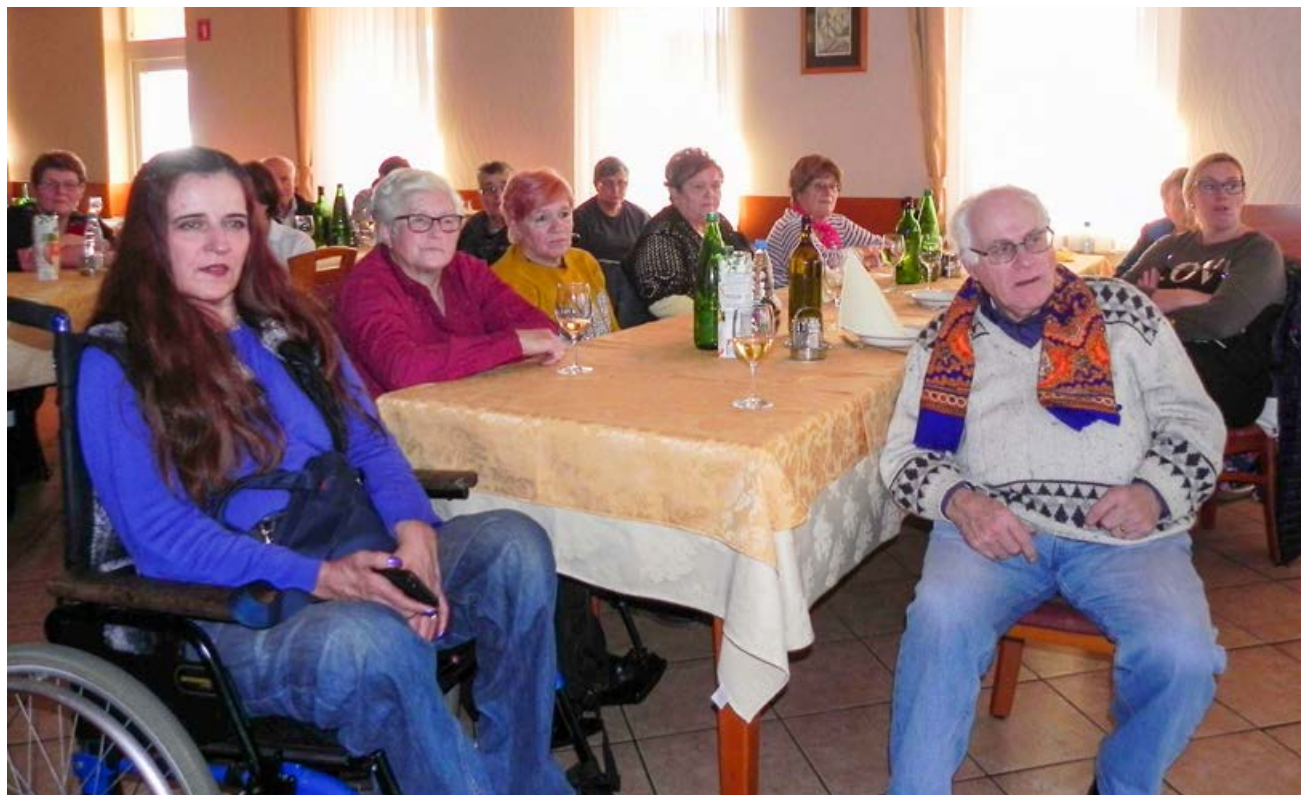
Člani z zanimanjem poslušajo predstavitev.

razmere za psa. Po uradnem delu pa se je začela zabava. Ob glasbeni spremljavi Dua Žur so mnogi tudi zaplesali. V dobri družbi in odličnem vzdušju čas kar prehitro mine in tako je bilo tudi tokrat.