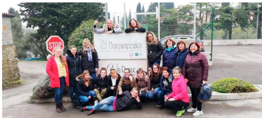
Petje se je slišalo tudi iz sob, kjer so dekleta bivala.

V eseli in ponosni smo, da so se pri nas v objemu morja, mediteranske klime, zelenja in miru dobro počutile. Mi smo jim pokazali gostoljubnost, profesionalnost, dobro vzdušje, okusno hrano in kvaliteto sodobno namestitev, ki jo premore dom. Lepo je bilo videti, da so uživale v dvorani, v restavraciji, v naši lepi okolici, celo v sobi so prepevale. Upamo, da se bodo ponovno vrnile k nam kot članice pevskega zbora ali kot posameznice z družinami.