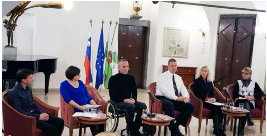
Okrogla miza ob predstavitvi knjižice Dostopna Ljubljana