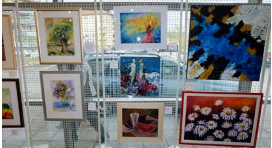
Letošnja dela izstopajo tudi po kakovosti in izvirnosti.