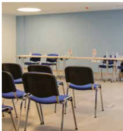
Večnamenska konferenčna dvorana z naj sodobnejšo tehnološko opremo