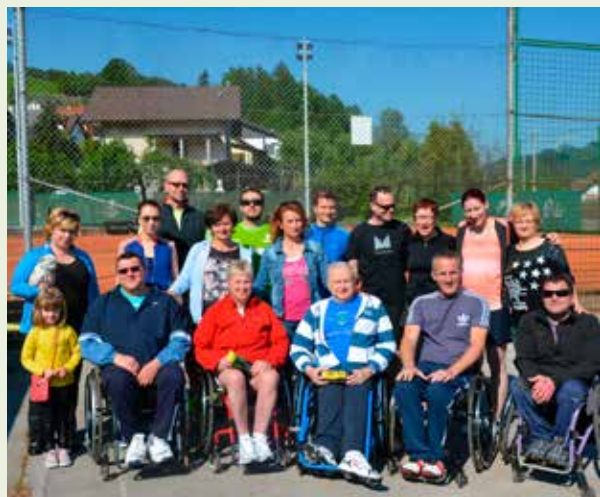
Lep sončen dan in še lepše vzdušje v Marija Gradcu

hodnje leto v Laškem pa naj bi se srečali igralci, ki so igrali na prvem turnirju leta 1996.