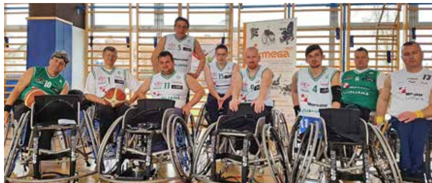
Z novimi vozički do novih zmag

Ekipa Društva paraplegikov ljubljanske pokrajine, ki uradno nosi ime DP Ljubljana Mercator , je tako 5. aprila 2016 na svojem treningu v Dragomlju v prisotnosti predstavnikov dobavite-