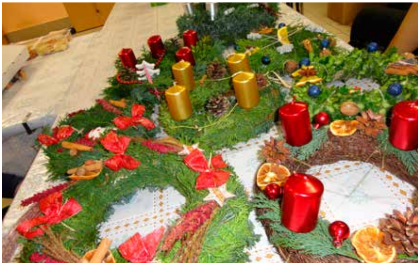
Pisani venčki so v adventnem decembru risali nasmeha na obraze.