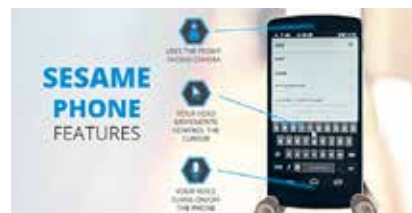
Pametni telefon Sesame

P od motom »dotik je precenjen« je nastal prvi mobilni telefon na svetu, ki ga je mogoče upravljati brezdotično, čeprav ima na dotik občutljiv zaslon. Projekt Sesame Phone želi življenje v telekomunikacijski družbi olajšati ljudem, ki zaradi telesne invalidnosti niso sposobni z rokami upravljati funkcij telefona, si pa želijo igrati igre in komunicirati. Z besedami »Open Sesame« (Sezam, odpri se) se pametni mobilnik aktivira, kamera nad zaslonom mora videti uporabnika, pojava se virtualni prst, ki ga po zaslonu