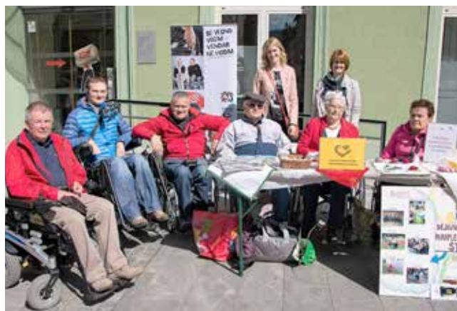
Naša stojnica na dnevu zdravja v središču Celja.