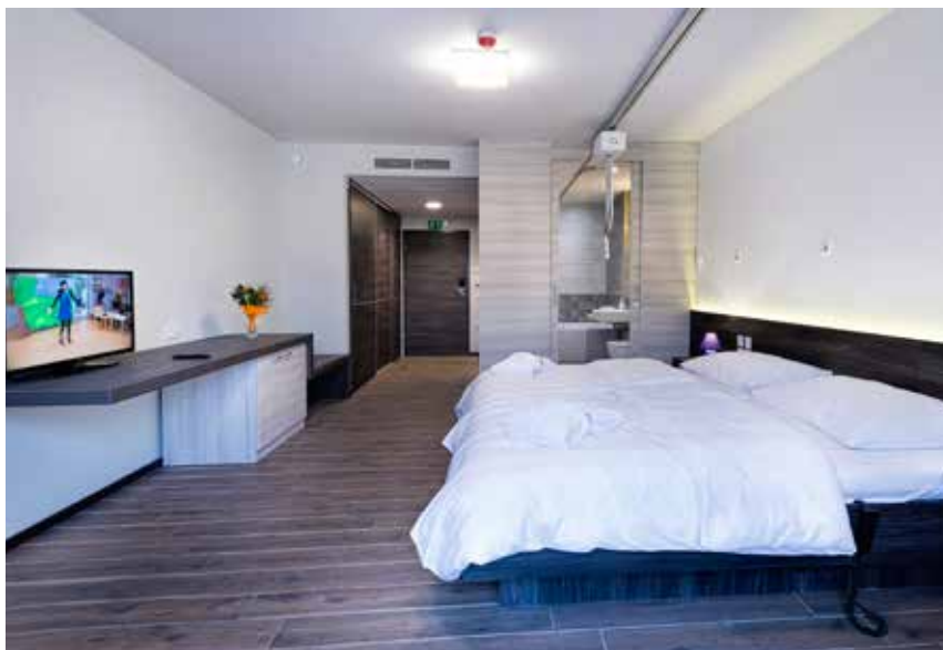
Sobe v nastanitvenem delu nudijo veliko manevrskega prostora in so sodobno opremljene.