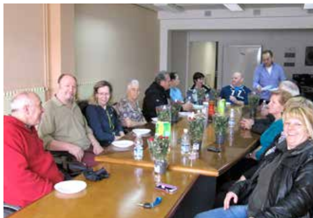
Članice in člani, spremljevalke in spremljevalci so skupaj praznovali 8. marec.