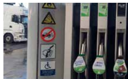
Označba za invalide na OMV bencinskih servisih.

Z aktivnostmi, ki jih izvajajo znotraj njihove nove usmeritve »We care more«, postavljajo na prvo mesto zadovoljstvo gostov in njihovo dobro počutje ob obisku bencinskih servisov.