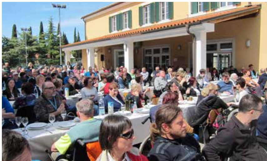
V Pacugu se je na dnevu odprtih vrat zbralo preko tristo članic in članov Zveze.

nimajo lastnih prevoznih sredstev ali pa nimajo dostopa do prilagojenega javnega prevoza. Prevozi predstavljajo temelj za izvajanje različnih socialnih programov, organizacije pa morajo zagotoviti prilagojena kombinirana vozila z odgovornimi usposobljenimi vozniki asistenti.