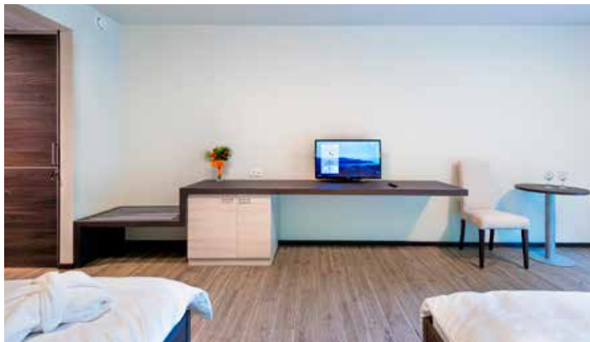
Postelji sta lahko tudi ločeni.