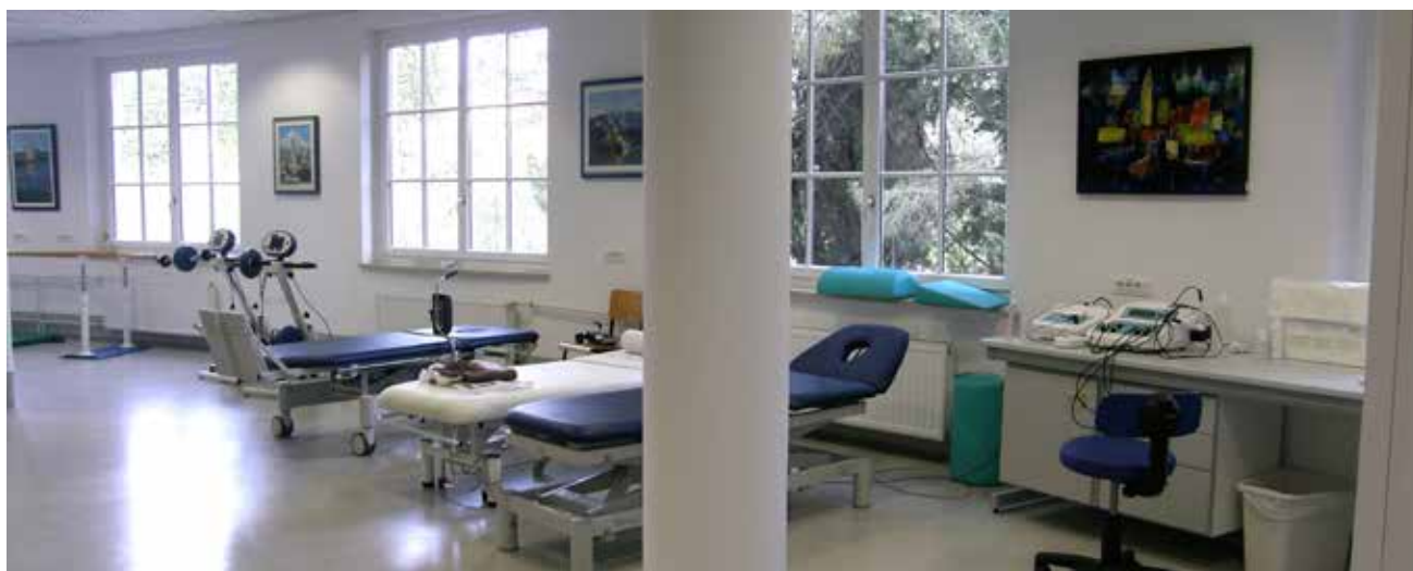
V fizioterapiji smo nabavili novo opremo in aparature.