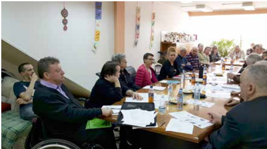
Zbor članov je soglasno potrdil poslovno poročilo za leto 2015.