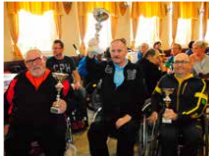
Ligaški prestol je osvojila ekipa DP Ljubljana.