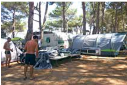
Zdaj pa samo potegnemo

Prvi, drugi, tretji, četrti in peti korak, pa je bila prikolica že skoraj postavljena. Tokrat sva jo z Davidom skoraj sama postavila, saj campletka res nima konkurenta pri enostavnem postavljanju. No, poleg se je sicer zbralo nekaj naših sosedov in večina prijateljev, s katerimi smo skupaj dopustovali. S skupnimi močmi smo prispevali k tistim nekaj malenkostim, ki so nujne za brezskrbno dopustovanje, pa zabijanje klinov in dobro napete vrvi, ki so bile v čisto moški domeni, pa kakšna pijača vmes ... in campletka je ponovno stala, le da smo jo tokrat tudi v notranjosti uredili tako, da nam je maksimalno služila za dopustovanje v naslednjih desetih dneh.