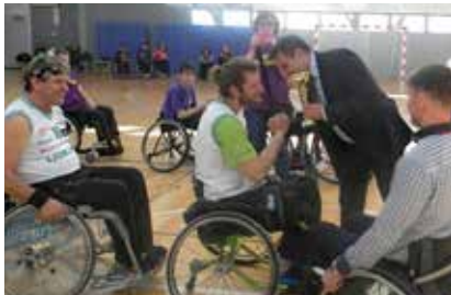
Košarkarji so poleg naslova državnih prvakov osvojili tudi pokal Zveze.

Športniki našega društva imajo organizirano vadbo in tekmujejo v vseh ligaških tekmovanjih, ki jih organizira Zveza paraplegikov Slovenije. Zato beležijo kar nekaj odličnih športnih uvrstitev.