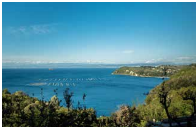
Pogled na morje z zgornje terase