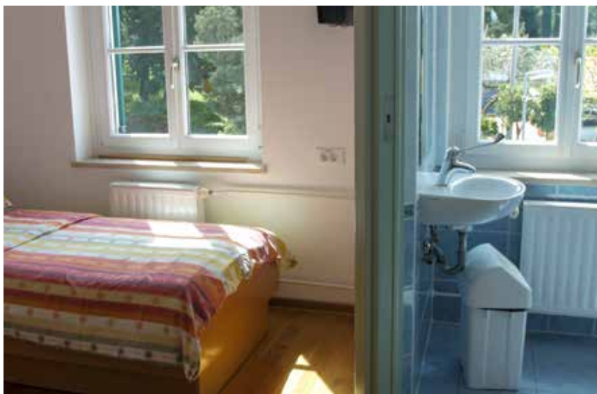
Soba v centralnem delu Doma paraplegikov s sanitarijami s tušem in posteljo z električnim vznožjem