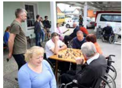
Druženje in ustvarjanje na sončku

je znanje nadgrajevalo več likovnikov in rezbarjev iz šestih pokrajinskih društev, med njimi tudi člani Mednarodnega združenja slikarjev, ki svoja dela ustvarjajo z usti ali nogami. Pod mentorskim vodstvom Rassa Causeviga so se naši umetniki izpopolnjevali v tehniki olje na platno, risbi s svinčnikom in akvarelu. Sončen in prijeten pomladanski dan, z lepo naravno okolico društvenih prostorov, je dal slikarkam in slikarjem veliko motivacije in inspiracije za plodno ustvarjanje.