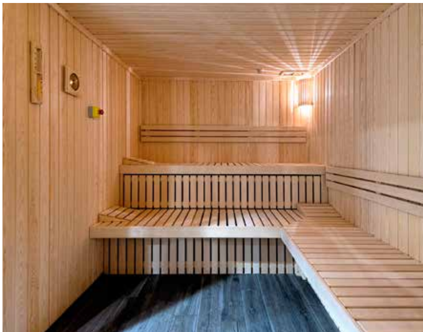
Razvajanje v savni ni več nedostopno.