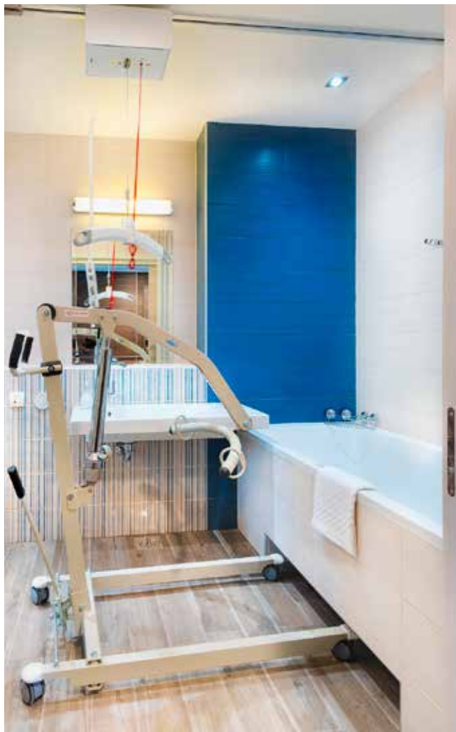
V kopalno kad lahko vstopate s pomočjo stropnega ali pa sobnega dvigala.