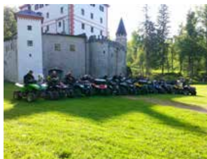
Pred s soncem obsijanem gradom Snežnik

Izpred zavoda Ars Viva smo krenili ob 10. uri, od tam nas je pot vodila po naslednjih občinah: Loška dolina – grad Snežnik, Cerknica – Cerkniško jezero ter hrib Slivnica, Bloke – Bloško