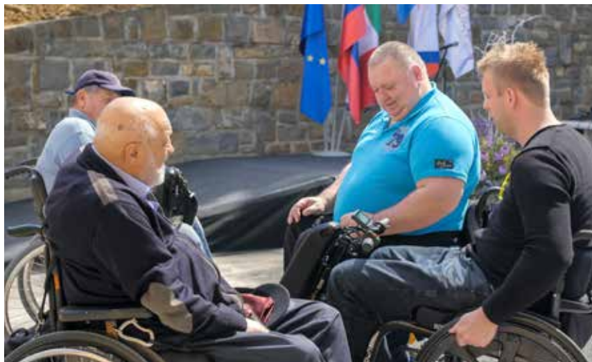
Gostje na otvoritvi Doma paraplegikov Pacug so si z zanimanjem ogledali novo pridobitev v naši ponudbi, Raptor.

Za vse dodatne informacije o vozičkih na ročni pogon, Raptorju in drugih izdelkih, ki jih najdete v naši ponudbi, smo na voljo po e-pošti: blanka.markovic@zveza-paraplegikov.com ali ziga.bajde@zveza-praplegikov.com . Pokličete nas lahko na telefonsko številko 041 653 640.