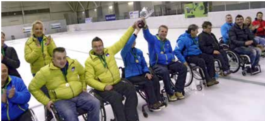
Državno prvenstvo v curlingu za igralce na invalidskih vozičkih

V Ledeni dvorani v Zalogu je 4. maja 2016 v organizaciji Zveze za šport invalidov Slovenije – POK potekalo državno prvenstvo v curlingu za invalide na vozičkih.