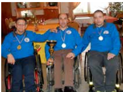
Člani DPPP med najboljšimi v ligi ZPS