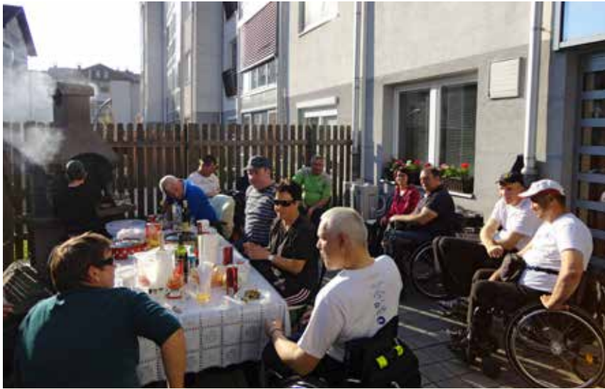
Krasen piknik kar na terasi društva

na žaru in se pri tem odlično odrezal. Ostali smo bodrili in klepetali. Glasba se je vrstila po izboru članov. Naredil se je prijeten večer in počutili smo se ... doma, saj je piknik potekal kar na našem društvu.