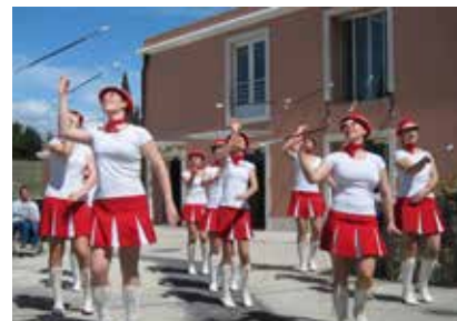
Za zabavo so poskrbele mažoretke iz Povirja.

Pester program odprtih vrat je z izbranimi besedami povezovala Petra Medved , popestrile pa simpatične mažoretke iz Povirja.