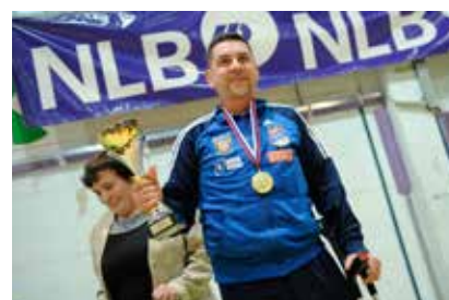
Zmagovalni pokal za ekipo KKI Vrbas

Ob zaključku tekmovanja je udeležence nagovoril vodja lige Gregor Gračner in se zahvalil vsem za pomoč pri organizaciji in izvedbi lige, še pose-