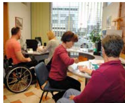
Za svoje zdravje bi morali bolj poskrbeti.