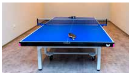
Na voljo vam je namizni tenis.