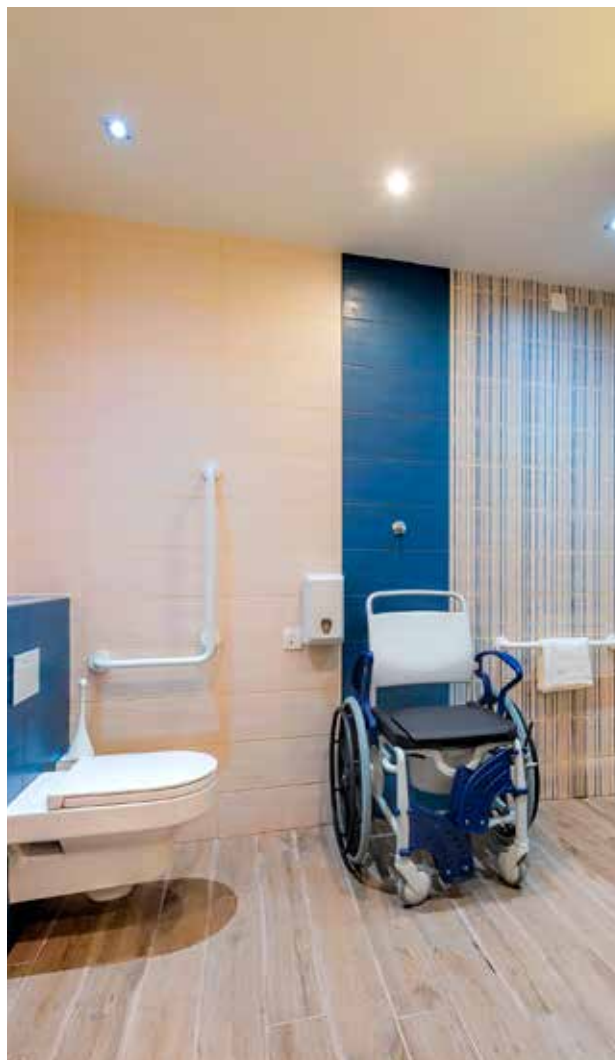
Za čas bivanja si lahko izposodite tuširni voziček.