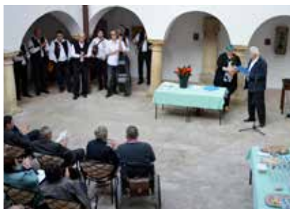
Podelitev v prečudovitem atriju velenjskega gradu