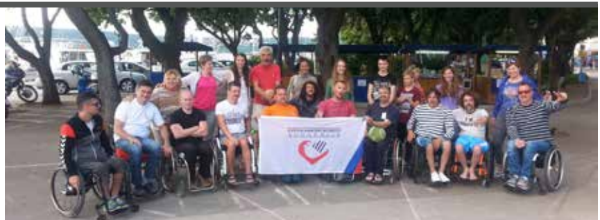
Na zaključku srečanja v središču mesta Punat, ko smo prikazali košarko.

Sobotno tekmovanje je potekalo v lepem vremenu, pod ugodnimi pogoji, saj je voda ostala mirna in nam je nudila idealne pogoje za izvedbo in