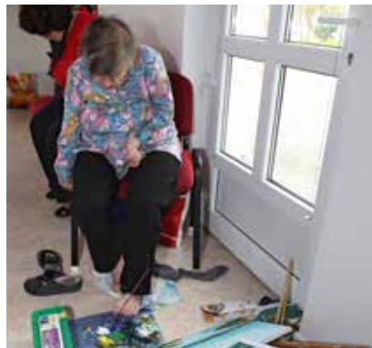
Slikarka, ki slika z nogami.

Aprila smo v prostorih našega društva pripravili tradicionalno spomladansko delavnico za slikarke, slikarje in rezbarje Likovne sekcije Zveze paraple-