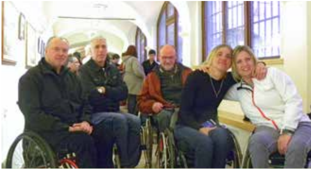
Otvoritev razstave v Galeriji Kranjske hiše v Kranju