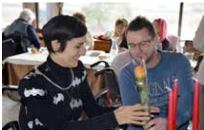
Majhna pozornost ob prazniku

Tudi tokrat smo jim praznovanje pripravili v prostorih hotela Kongo & Casino v Grosupljem, veselega druženja pa se je udeležilo nekaj več kot trideset članic in pet naših zaposlenih mladenk. Srečanje jim je polepšal DUO MIX iz Mozirja. Mladeniča, ki igrata na vrsto inštrumentov, sta s širokim repertoarjem pesmi zadovoljila prav vsak glasbeni okus. Same pa so pripravile nekaj zabavnih točk in požele obilo smeha. Našim damicam so s prikupnimi praktičnimi darilci praznovanje polepšali še: kozmetika L'Occitane en Provence , kozmetika Trebnik in Žito d. d. ter seveda z rožico za vsako tudi predstavnik društva.