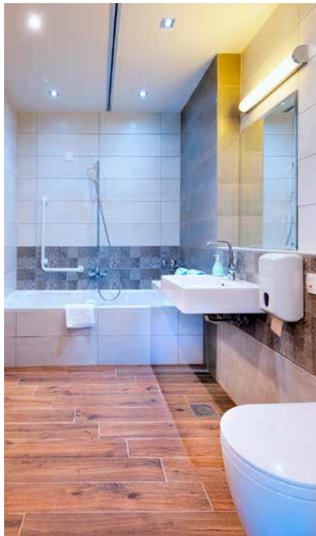
V kopalno kad lahko vstopate tudi s pomočjo aqualifta.