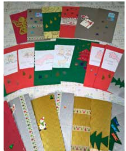
Člani, so vam kaj znane?