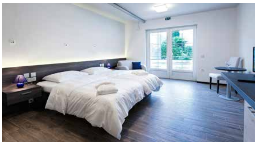
Izhod na prostorno teraso in pogledom na morje