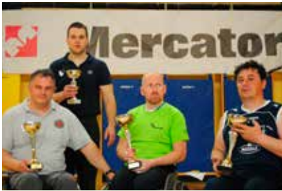
Predstavniki najboljših ekip z najboljšim strelcem

Tako kot se v košarki pogosto dogaja, je bila tudi ta tekma razburljiva in napeta vse do zadnjih minut.