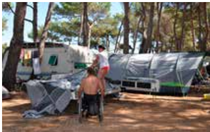
Že z odprtjem stranice se pokaže priročna kuhinja