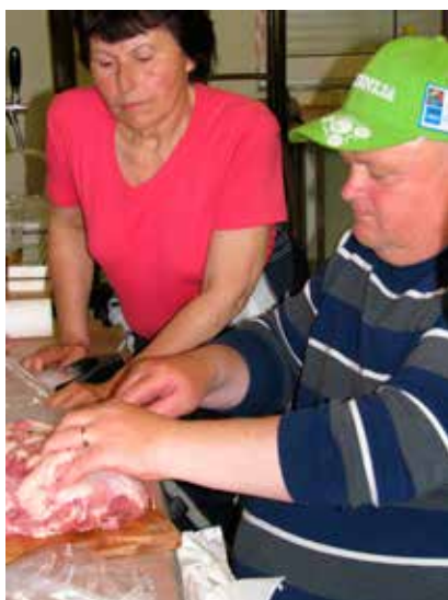
Tudi predsednik z veseljem poprime za delo na kolinah.

Verjamem, da smo marsikateremu našemu članu popestrili dan, še pose-