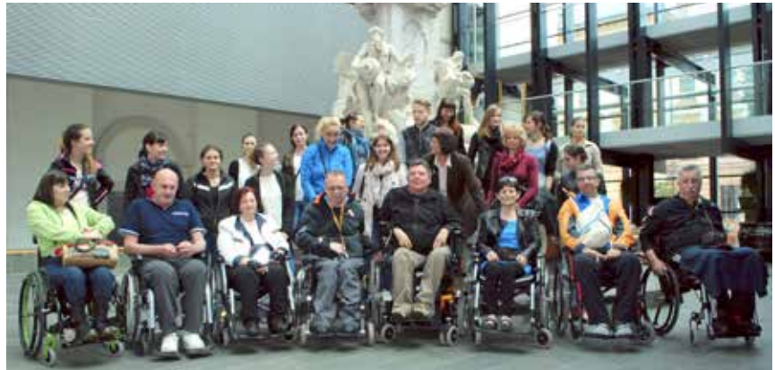
Pred Robbovim vodnjakom

Društvo paraplegikov ljubljanske pokrajine v maju že po tradiciji za bližnje člane pripravi ogled kakšnega kulturnega dogodka ali pa turistične točke naše bele Ljubljane. Ta dogodek pa je tesno povezan s preverjanjem do-