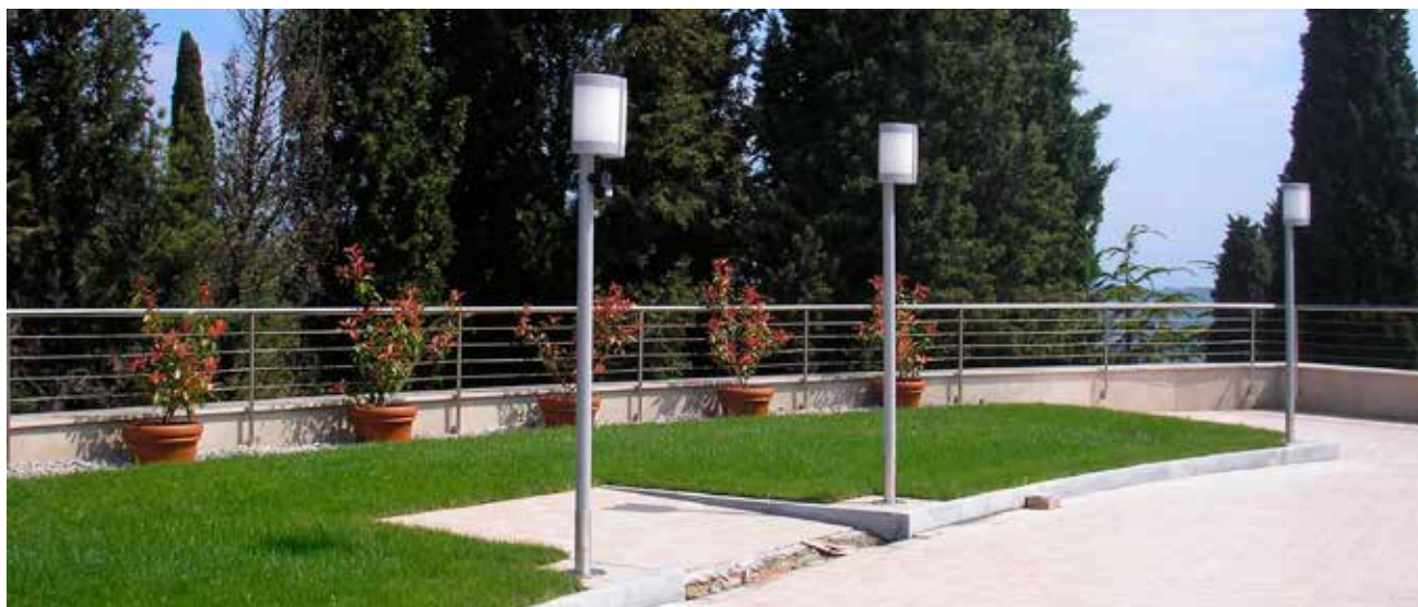
Na pohodni strehi centralnega dela je večnamenska terasa.