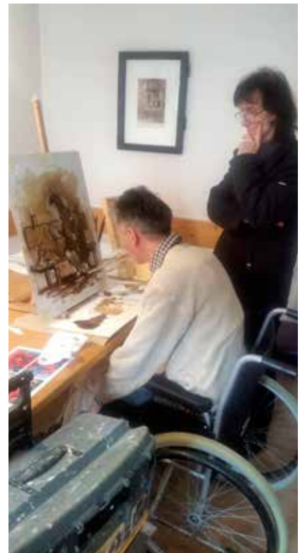
Vsaj enkrat mesečno pripravljamo slikarska druženja, namenjena vsem, ki bi radi poglobili svoje likovno znanje.

kovno teorijo in prakso. V Zavodu ARS VIVA najmanj enkrat mesečno pripravljamo slikarska druženja, namenjena vsem, ki bi radi poglobili svoje likovno znanje in se na poljuden način ter z veliko praktičnega dela seznanili s temi, ki jih večinoma obravnavajo le na specializiranih šolah. Primeren je za od-