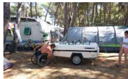
Malo jo še zakajlamo, da nam ne pobegne

Pa smo jo spakirali in se odpravili. Vožnja je tekla super, kot da ne bi imeli ničesar priklopljenega zadaj, hitro smo prišli do trajekta – šli smo namreč v kamp Nerezine na Lošinj – kjer je vse teklo gladko. Ko pa smo prišli do parcele v kampu, odklopili campletko in se pripravljali, da