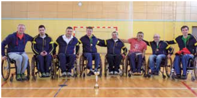
Košarkarji na državnem prvenstvu z grenkim priokusom