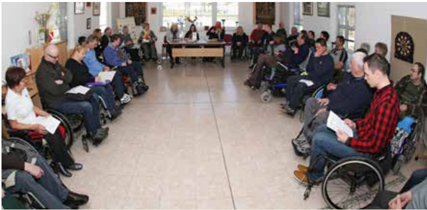
Vsi zbrani v društvenih prostorih

Na Društvu paraplegikov Dolenjske, Bele krajine in Posavja smo veselo pozdravili tudi to pomlad in se z veseljem nastavljamo sončnim žarkom, ki nas vedno znova napolnijo z energijo.