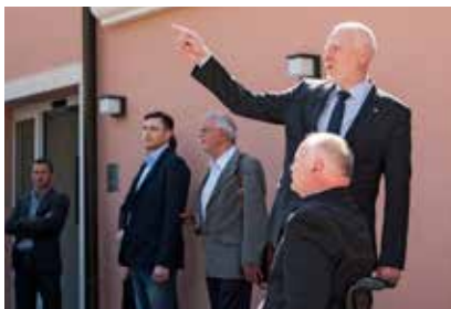
Dr. Milan Brglez si je po uradni otvoritvi z zanimanjem ogledal dom in njegovo okolico.

Dr. Milan Brglez – predsednik Državnega zbora RS in pokrovitelj slovesnega dogodka je v slavnostnem nagovoru poudaril, da vse ranljive družbene skupine terjajo posebno