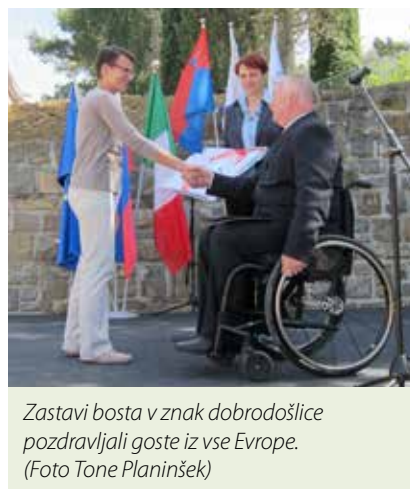
Zastavi bosta v znak dobrodošlice pozdravljali goste iz vse Evrope.

Predsednik se je ob tej priložnosti zahvalil tudi našim slikarjem, ki so domu poklonili 19 svojih likovnih del. Njihove slike (nekatero so bile ustvarjene z usti) bodo ponosno odsevale in