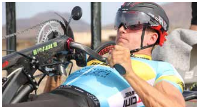
Najbolje se počuti, ko kolesari. Takrat ima tudi najmanj bolečin.

ku, ki je povzročil infarkt v hrbtenjači. Dali so mi zdravila in me seznanili, da imam velike možnosti, da si opomorem in bom ponovno lahko upravljal mišice na nogah, saj je strdek pritiskal na živčni sistem le 45 minut. Zanimivo je, da je moje občutenje celega telesa normalno, tudi noge čutim, vendar ne morem premikati mišic. Po dveh tednih v bolnišnici sem zdravljenje nadaljeval v rehabilitacijskem centru v Belgiji. Tam sem močno delal prav vsak dan v želji, da se povrne možnost upravljanja z mišicami, vendar se to ni zgodilo. Po treh mesecih sem odšel domov, vendar sem se še tri mesece vsak dan vračal v center za rehabilitacijo z namenom izboljšanja moči spodnjega dela telesa.