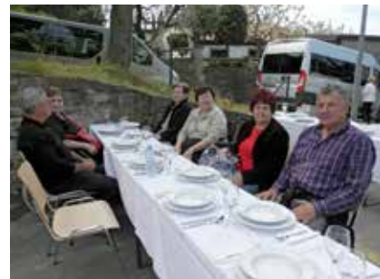
Člani DPPP obiskali Dom paraplegikov v Pacugu.