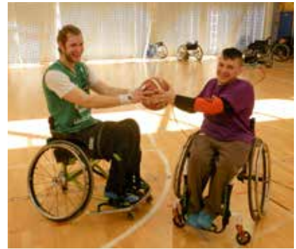
V finalnem derbiju med DPLjubljana Mercator in DP Maribor Palfinger marino na XV. pokalu ZPS sta igrala tudi dva prekmurska košarkaša.