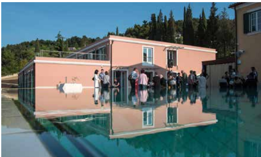
Pogostitev ob bazenu in čudovitih zvokih pesmi Alenke Godec