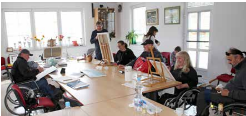
Umetniki ustvarjajo v notranjih prostorih.