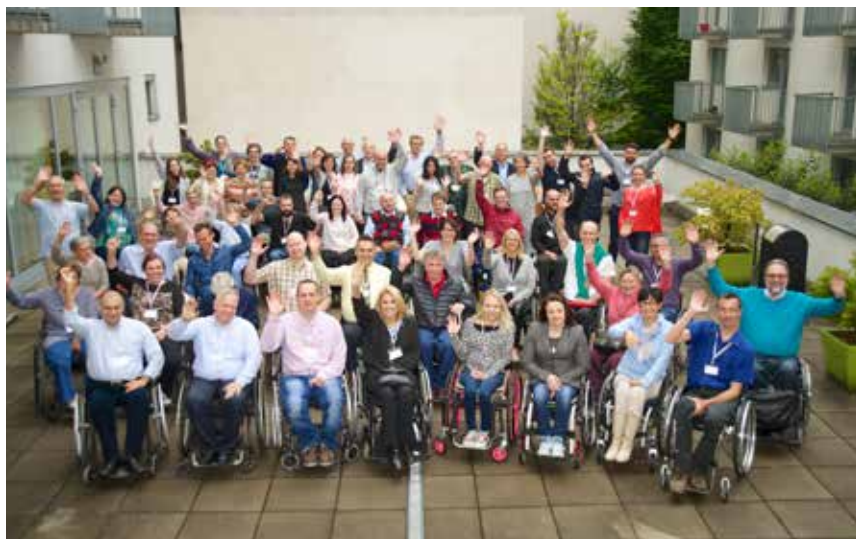
Zbrani predstavniki paraplegikov iz 17. držav.

Na Dunaju sta od 11. do 13. maja 2016 potekala kongres in redna letna skupščina evropske zveze paraplegikov (ESCIF), ki ga je organizirala avstrijska zveza paraplegikov. Letošnja tema kongresa je bila »Uspešna integracija po okvari hrbtenjače«. Dogodka so se udeležili predstavniki iz 17 držav, med njimi tudi Slovenija s predstavniki Zveze paraplegikov Slovenije.