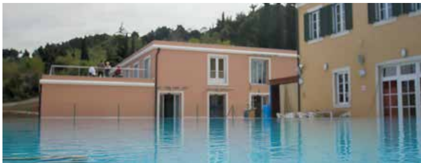
Še naprej vam je na voljo bazen z morskovo vodo, ki je pridobil prekrivne ponjave.

Če želimo nuditi kakovostno oskrbo našim gostom moramo v to tudi kaj investirati, zato je bil nakup fizioterapevtskih pripomočkov/aparatur ključnega pomena. V fizioterapiji imamo zdaj nove aparature, ki omogočajo kvalitetno obdelavo gostov. Nabavili smo tudi najnovejšo aparaturo Tesla Szym.