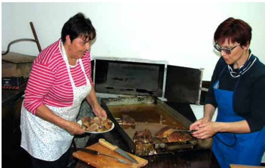
Niti misliti si ne morete, kako je dišala svinjska pečenka iz krušne peči.