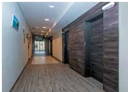
Prostren, svetel hodnik krasijo slike naših slikarjev.