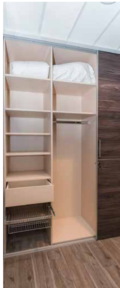
Priročna in dostopna dvokrilna omara z izvlečnimi elementi in dvojnimi zaklepanjem