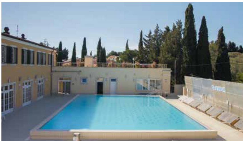
Pogled na bazen z zgornje terase