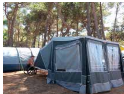
Zabijemo še kline in je to, to.

Vsekakor bo campletka in dopustovanje v kampu tudi letos, po možnosti tokrat res čisto ob morju, prva izbira.