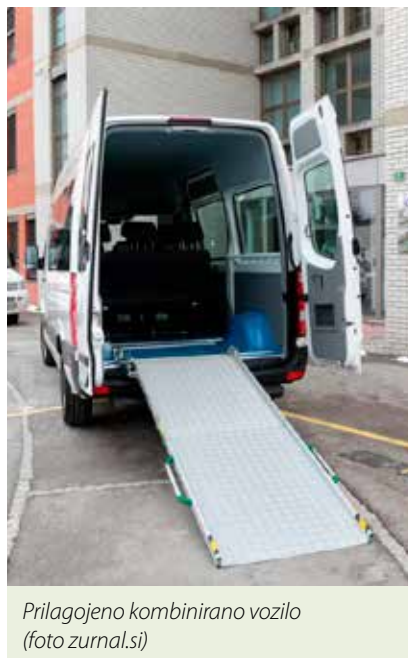
Prilagojeno kombinirano vozilo

je povpraševanje večje od ponudbe. Sodelujoči so poudarili potrebo po večji dostopnosti javnih prevoznih sredstev na področju celotne Slovenije. Predstavniki invalidskih organizacij so izpostavili težavo s parkiranjem prilagojenih kombiniranih vozil za prevoz invalidov na parkirnih mestih za invalide in izrazili potrebo po namenski parkirni kartici za prilagojena kombinirana vozila, ki ne bi več imela oznake kače, ovite okoli palice (ki prilagojena kombinirana vozila izenači z vozili zdravstvenih in socialnih delavcev), ampak