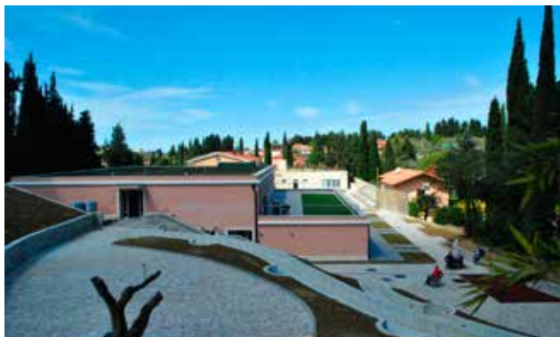
Iz zgornjega nadstropja se lahko v pritličje spustite po klančini ali pa uporabite eno od dveh dvigal.