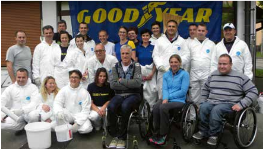
Goodyear za Good namen

gostilne in potem navdušena nad njihovo dobro hrano, prijazno postrežbo, domačnim vzdušjem.