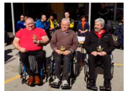
Najboljši kegljaji med veterani v sezoni 2015/2016

Turnir so poleg glavnega pokrovitelja Občine Domžale in Zveze paraplegikov Slovenije podprli še številni pokrovitelji in donatorji.