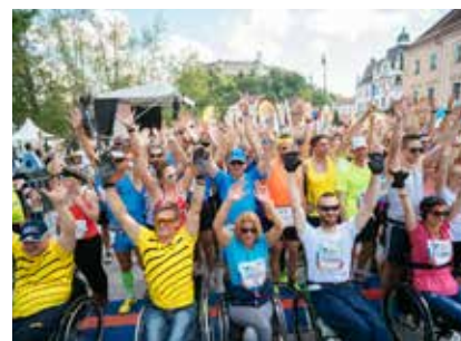
Start tekačev v Sloveniji

Predsednik Republike Slovenije Borut Pahor , ki je lani kot prvi predsednik na svetu javno podprl ta dobrodelni tek, je letos znova predal listino o častnem pokroviteljstvu nad tekom Wings for Life World Run Slovenija. Tudi sam se je udeležil teka z nasmehom na obrazu in izboljšal svoj lanski rezultat. Pred tekom nam je zaupal: "Z veseljem znova tečem za tiste, ki tega ne morejo. Lani je bilo super in vem, da bo tudi letos. Veselim se napredka na področju zdravstva, ki ga bo tek dosegel čez nekaj let."