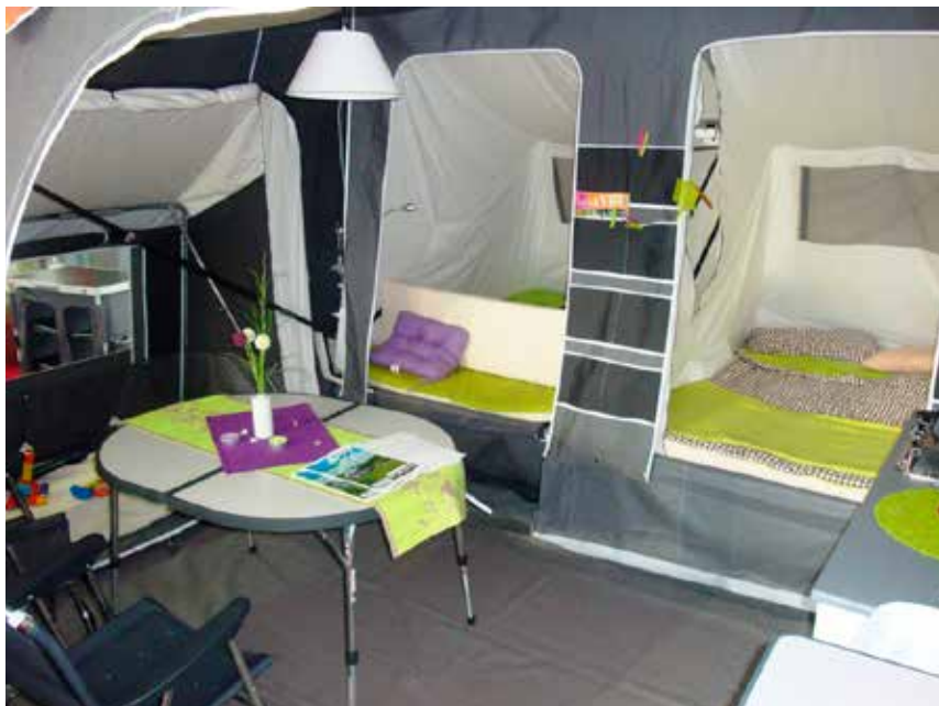
Postavljen camp-let je priročna in zelo dostopna prikolica.