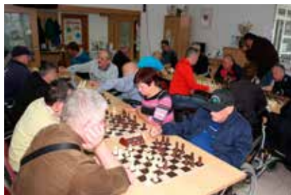
Memorial Jožeta Radeja z zaključkom šahovske lige

V ekipni konkurenci sta pokale za prvo mesto z enakim številom točk (13,5) osvojili ekipi DP Ljubljana in DP Celje, pokal za tretje mesto je osvojila ekipa DP Koper.