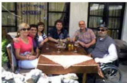
V družbi gostiteljev

Vsak slikar je naslikal najmanj dve sliki, organizatorji pa bodo vsa dela in kataloge pripravili za razstavo, ki jo bodo v multinacionalnem objektu Porta Makedonija v Skopju odprli 3. decembra