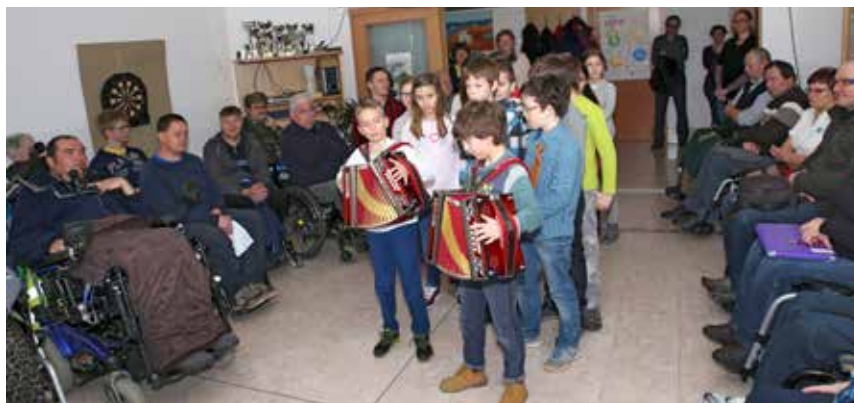
Začetek Zbora članov so popestrili mladi glasbeniki in pevci.

Meditacija je tehnika, s katero lahko vplivamo na živčni sistem, da smo sposobnejši visoke stopnje koncentracije