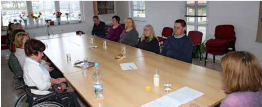
Zelo pozorno poslušamo navodila za meditacijo.

in kontrole v organizmu. Vodila je eno uro meditacije, za katero je razložila, da nadomesti več ur našega normalnega spanja. Povedala nam je tudi, da naj, ko se pripravljamo na tako spanje, naši želodčki ne bodo polni in naj se zberemo, umirimo in poslušamo navodila, da lahko vzpostavimo stik sami s sabo in svojo dušo. Vsi prisotni smo bili po končani meditaciji navdušeni, sproščeni, umirjeni in napolnjeni z energijo.