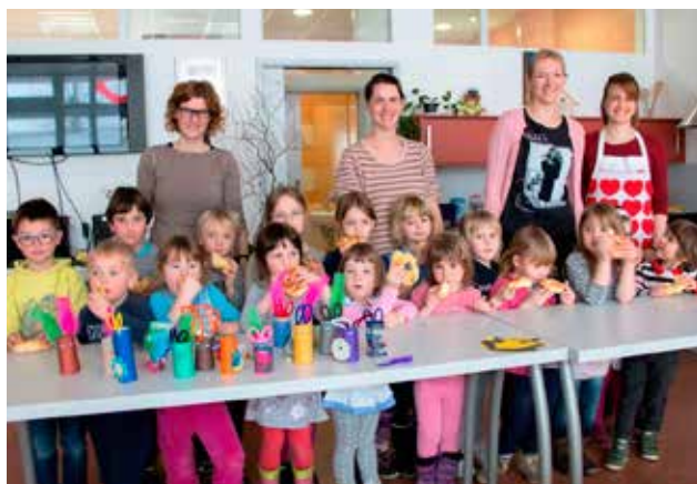
Otroci so ponosno pojedli svoje izdelke.

Animacija za otroke in bogat program s pevskimi in plesnimi točkami različnih generacij je pritegnil veliko obiskovalcev. Pooblaščenec župana,