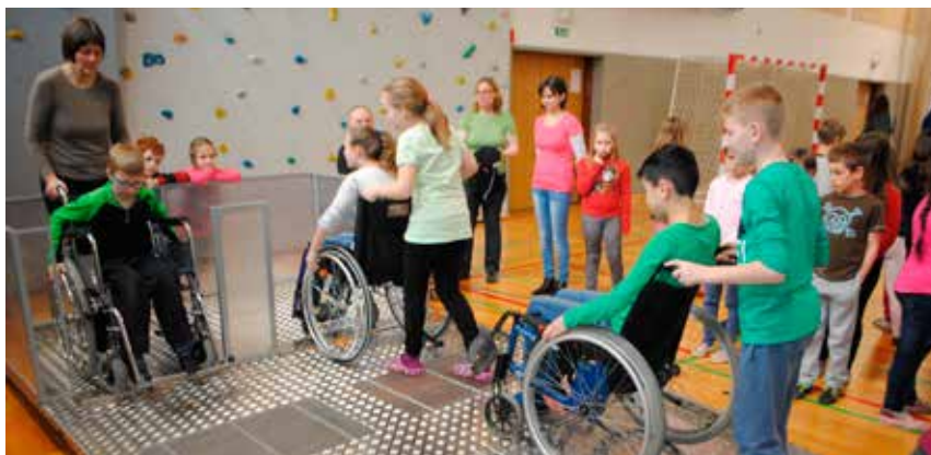
Učenci na poligonu z različnimi klančinami in drugimi ovirami

V letošnjem letu smo se s projektom » Različnost je zakon « predstavili na dveh osnovnih šolah. Namen