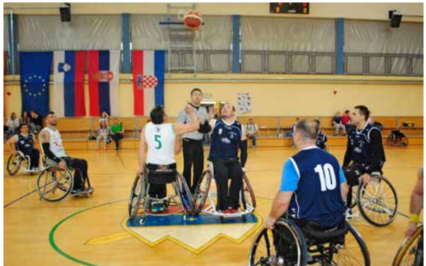
Sodniški met finalne tekme

V finalni tekmi sta se za pokal Toneta Pogačnika udarili neporaženi ekipi iz predtekmovanja KIK Una Sana in DP Ljubljana Mercator. Že v prvih sekundah je povedla ekipa iz BiH, naši so kmalu izenačili, nato pa sta se ekipi izmenjavali v vodstvu in prvi polčas zaključili z rezultatom 35 : 26 v korist Slovenije. V končnici tekme je bila po številnih napakah in zgrešenih metih le boljša domača ekipa in tako z rezultatom 61 : 54 osvojila zmagovalni pokal.