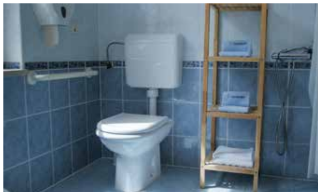
V centralnem delu objekta je priročen sanitarni prostor s tušem in stanskim tuširnim stolom.

Sanitarni prostori so različni. V treh sobah so sanitarije s kadjo in stropnim dvigalom in dvojnimi vstopom v sanitarni prostor. V ostalih sobah so sanitarije s tušem. Na voljo so različni tehnični pripomočki: stenski tuširni stol, prostostoječi tuširni stol, toaletni voziček ali sobno dvigalo.