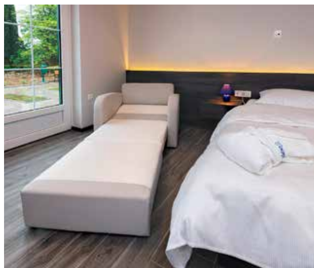
... spremeni v dodatno ležišče.