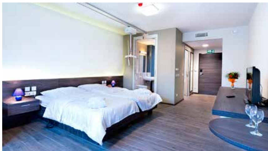
Stropno dvigalo vas popelje iz postelje do wc školjke, umivalnika ali naravnost v kopalno kad.