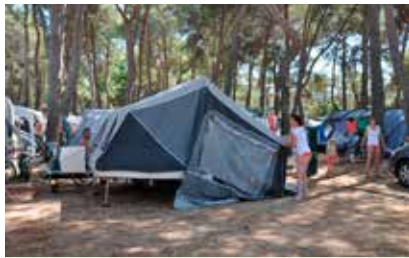
In jo napeljemo na drugo stran