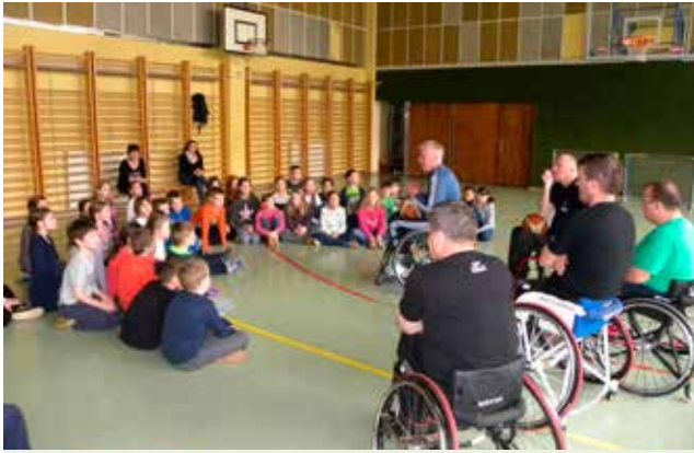
Četrtošolci v projektu »Pogled k sončku« spoznavajo ljudi s posebnimi potrebami.