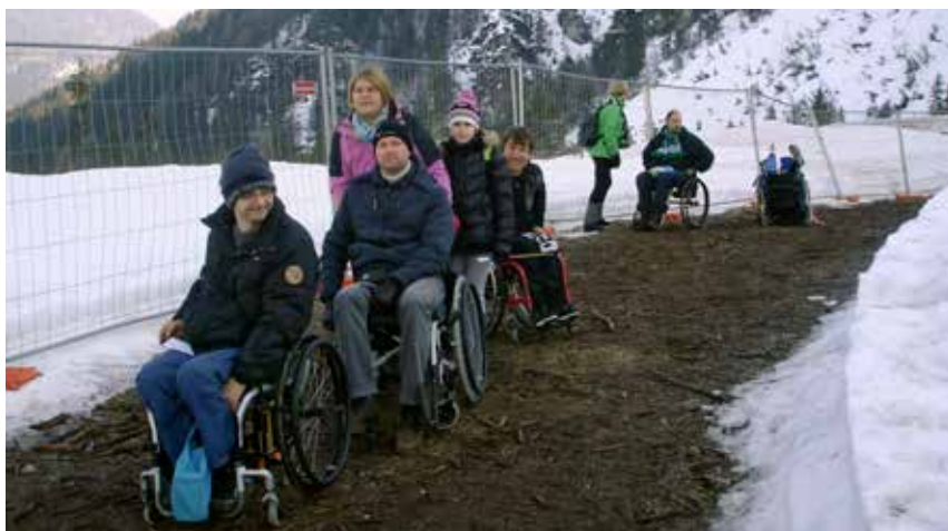
Dolga pot navzdol

Cesta je suha, skoraj brez prometa, zato je vožnja prijetno tekoča. V Tolminu čakamo na Mateja , ki z družino prihaja iz Čepovana. Kombi ima premalo sedežev za vse, zato na pomoč priskoči