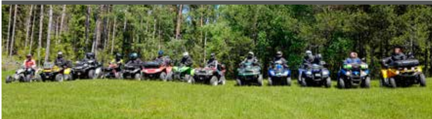
V prvo (ne)srečna trinajstica. Le koga ne mika, da bi se jim pridružil?

Po osmih letih premora smo se motoristi štirikolesnikov ponovno zbrali od 20. do 22. maja 2016, tokrat v Občini Loška dolina, natančneje pri Zavodu Ars Viva v Podcerkvi pri Starem trgu, ki ga je organizirala Zveza paraplegikov Slovenije.