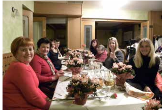
Zadovoljne in zadovoljene