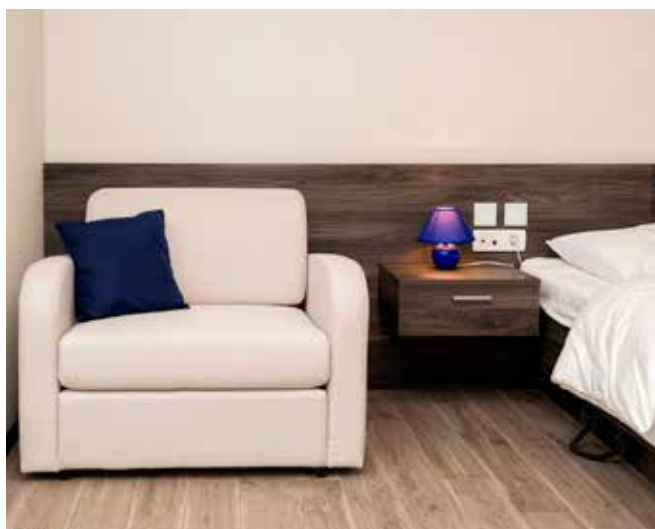
Enosed se lahko v hipu ...