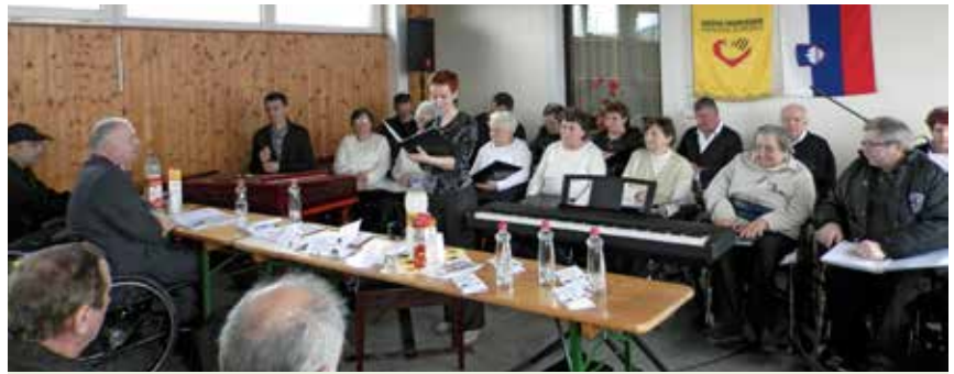
Nastop pevcev DPPP na 37. zboru članov