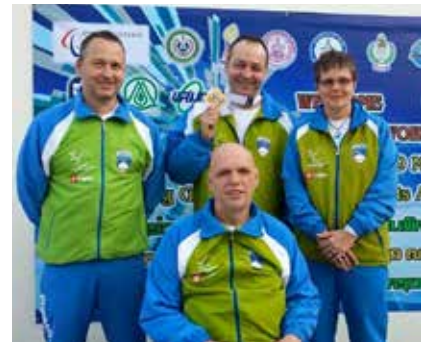
Svetovni pokal na Tajskem.

Ob zaključku tekmovanja je strelce nagovoril podpredsednik ZŠIS – POK Jože Okoren in kandidatom za Rio zaželel uspešen nastop.