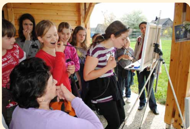
Praktični preizkus slikanja s čopičem v ustih

Med njimi so bili seveda tudi umetniki, člani Mednarodnega združenja slikarjev, ki slikajo z usti ali nogami. Lep spomladanski dan pa je omogočal, da so naši likovni umetniki navdih za nova dela našli tudi v lepi okolici doma. Slikarke in slikarji so se pod mentorskim vodstvom Rassa Causeviga izpopolnjevali v različnih tehnikah – olju na platnu, akrilu, risbi, akvarelu in grafiki.