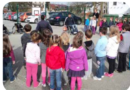
Predstavitve košarke na vozičkih v vrtcu Zarja