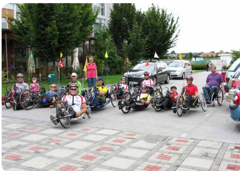
Mogoče bo na letošnjem srečanju v Moravskih Toplicah udeležba še večja.