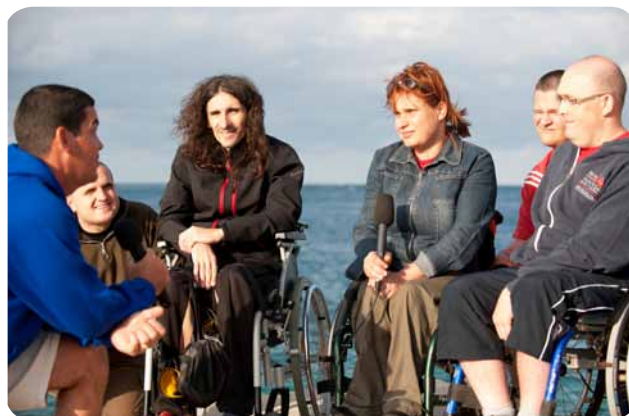
Ali so ti res jedli iz ust?

Leta gospodovega ... v mojo sobo zakoraka velik človek sivih las. Kot bog Pozejdon. Med pogovorom mi postavi vprašanje. Faca, te zanima, da bi bil z nami v ekipi, ki se bo udeležila prve mednarodne ekspedicije potapljačev invalidov ... na Kubi?