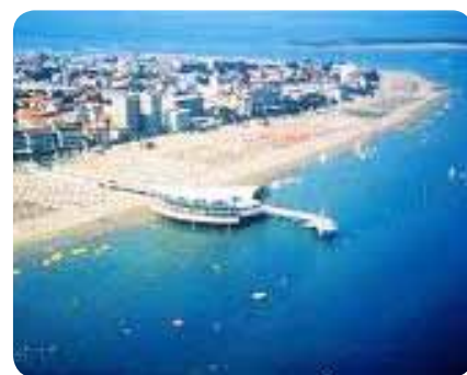
Prelep razgled na polotok in mesto Lignano v Italiji.

Ogledali smo si urejena teniška igrišča, pomole s privezi, igrišča in velike trgovine. Kot bi mignil, je bilo že popoldne in tudi želo-