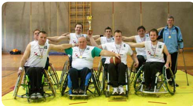
Naša ekipa je že tretjič zapored osvojila naslov državnih prvakov v košarki.

odigranih rednih kolih uvrstile naslednje ekipe: DP Mercator Ljubljana, združena ekipa DP Kranj-DP Novo mesto, DP Celje in DP Maribor. Naslov državnih prvakov je že tretjič zapored osvojila ekipa DP Mercator Ljubljana, ki je v finalnem srečanju z rezultatom 63:43 premagala ekipo DP Kranj. V tekmi za tretje mesto sta se pomerili poraženi ekipi polfinalnih tekem – ekipa DP Celje in ekipa DP Maribor. Z rezultatom 61:53 je slavila ekipa DP Celje.