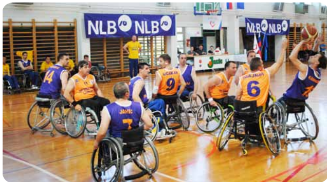
Castalvecchio (v modrih dresih) je zmagala s tesnim rezultatom 65:63.

Osvojila ga je ekipa Castalvecchio, druga je bila ekipa DP Mercator Ljubljana, tretja KKI Vrbas, četrta RSV Kärtner, peta pa Hobit. Organizator je tokratno košarkarsko srečanje posvetil dnevu Evrope in prazniku Ljubljane, Evropa Ljubljani – Ljubljana Evropi.