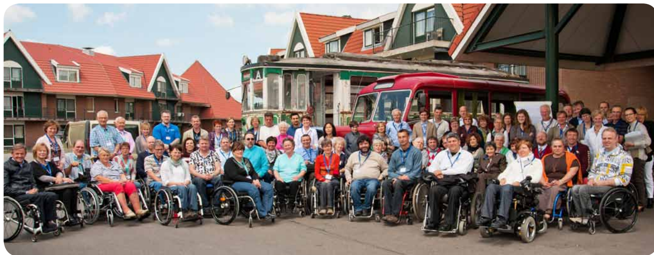
Udeleženci mednarodnega kongresa združenja ESCIF

Več informacij o delovanju združenja lahko bralci pridobite na spletni strani www.iscos.org.uk .