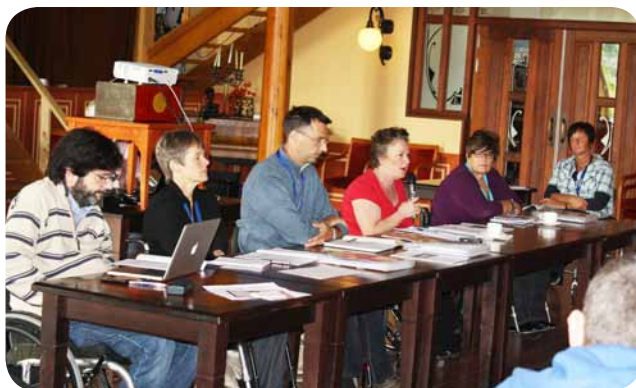
Člani upravnega odbora Evropske zveze paraplegikov

Letošnjega kongresa se je udeležilo kar 91 članov iz več kot dvajsetih evropskih držav.