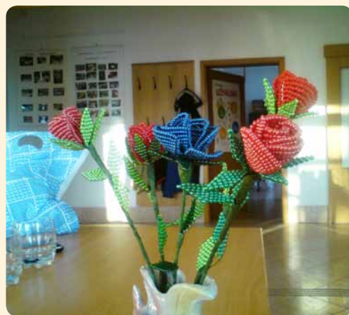
To so bili naši prvi izdelki vrtnic iz okrasnih kroglic.