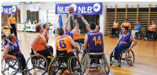
Ekipa KIK Zmaj (v modrih dresih) je bila boljše.

V športni dvorani OŠ v Kašlju pri Ljubljani je 9. marca 2011 potekal tako imenovani mali finale regionalne lige (NLB – WHELL) v košarki na invalidskih vozičkih. Po polfinalnih tekmah v Gradačcu se je zadnjih šest ekip pomerilo za uvrstitve od tretjega do osmega mesta. Naša ekipa se je potegovala za bronasto odličje, toda nasprotna ekipa KIK Zmaj iz Gradačca je bila v končnici boljše in z rezultatom 69:63 zaslužno osvojila kolajno. No, tudi četrto mesto ni slabo.