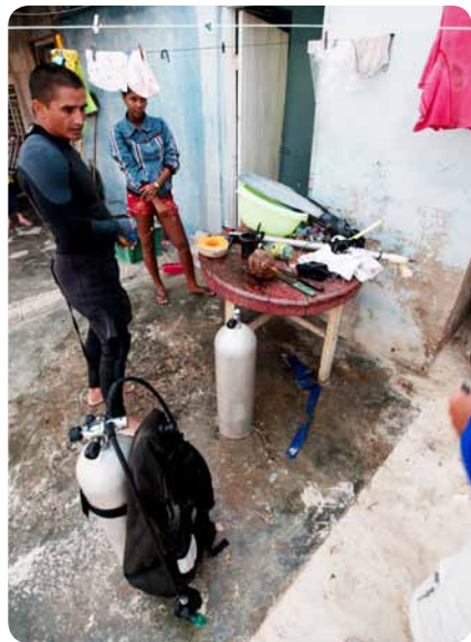
Dobri sosedski odnosi