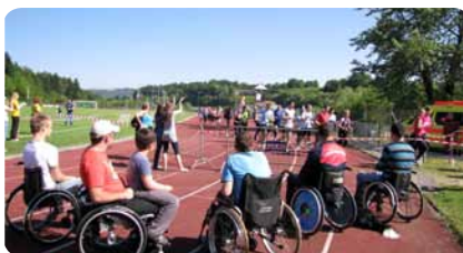
Mladi člani Leo kluba iz Novega mesta so organizirali dobredelni tek za paraplegika.

V sklopu Rudolfovih tednov športa so člani dobredelnega kluba Leo iz Novega mesta organizirali Prvi Leo tek. Potekal je v nedeljo, 8. 5. 2011, v športno-rekreacijskem centru Portovald.