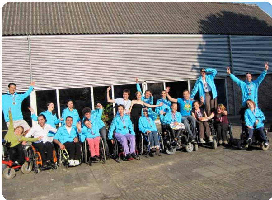
Uspešna slovenska ekipa velja kot najglasnejši navijači