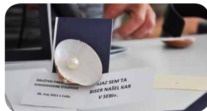
Kulturna prireditev Jaz sem ta biser našel kar v sebi

Na OŠ Zreče smo se udeležili svetovnega dne LJUDJE NA ZEMLJI – VSI SMO POMEMBNI in predstavili aktivnosti našega društva. Naši člani lahko tudi letos počitnikujejo v hiški v Ankaranu. Za letovanje se je pokazalo veliko zanimanje in termini so polno zasedeni, prosti termini so le še termini do 14. junija in po 20. septembru. Prijavnico – če je kdo morda še nima – dobite na naši spletni strani, na sedežu društva ali na željo tudi po pošti.