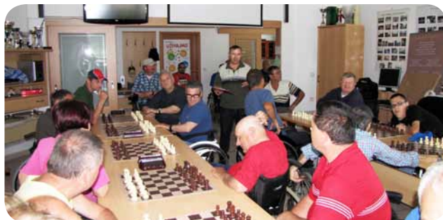
Začetek šahovskega turnirja