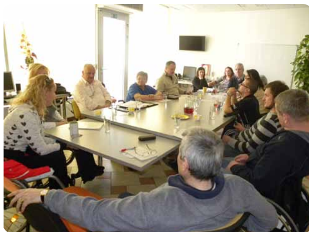
Socialni poverjeniki se redno sestajajo.