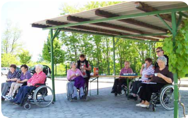
Družabnost s članicami društva Vizija Slovenske Konjice

V sklopu Tedna vseživljenjskega učenja smo pripravili tudi meddruštveno in medgeneracijsko srečanje z Društvom Vizija iz Slovenskih Konjic. To srečanje je bilo že kar nekaj časa načrtovano in nato končno tudi izpeljano. Članice so se ob tem pomerile tudi v vrtnem kegljanju in preizkusile ročne spretnosti ter imele še nekaj časa tudi za klepet.