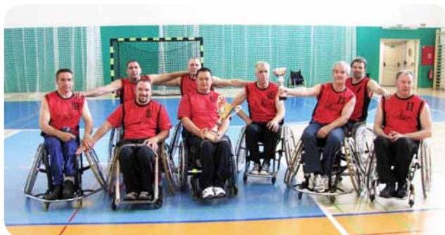
Pokal Zveze je osvojila združena ekipa DP Novo mesto-DP Kranj.