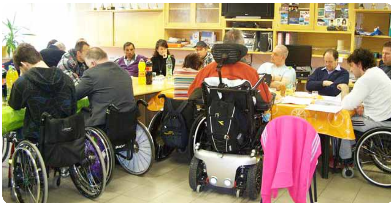
Udeleženci občnega zbora DP Koroške