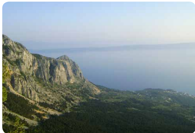
Prelep razgled na Jadransko morje

Nekako sem že navajen, da so prvomajski prazniki bolj ko ne deževni, a kljub temu se nisva mogla upreti že lansnemu povabilu znancev z Makarske reviere, točneje iz Podgore, da jih obiščeva v času cvetenja lavande oz. sivke.