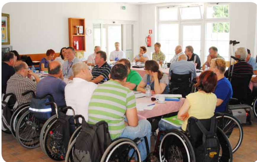
Delegati iz vseh devetih pokrajinskih društev pri sprejemanju vrsto sklepov.

Dograditi moramo še nastanitveni objekt in pridobiti opremo za izvajanje kompleksne obnovitvene rehabilitacije. Ob tem je razveseljivo, da zelo dobro sodelujemo z Občino Piran in županom Petrom Bossmanom, ki ima za naše težave pri dograditvi doma veliko