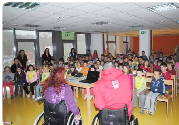
Učenci so spoznali dejavnost društva in se seznanili z našim delom in življenjem.

Na petih delavnicah smo jih seznanili z izvajanjem socialnih programov, predstavili smo jim kulturno dejavnost, šport in interesne dejavnosti. Seveda smo jih ves čas in povsod opozarjali na vzroke nesreč, ki so nas pripeljale na invalidski voziček, vse z namenom, da bi se jim učenci čim bolj lahko izognili. Predstavitve smo popestrili s projekcijo zanimivih slik, ki so nazorno pokazale našo dejavnost, v sproščenem