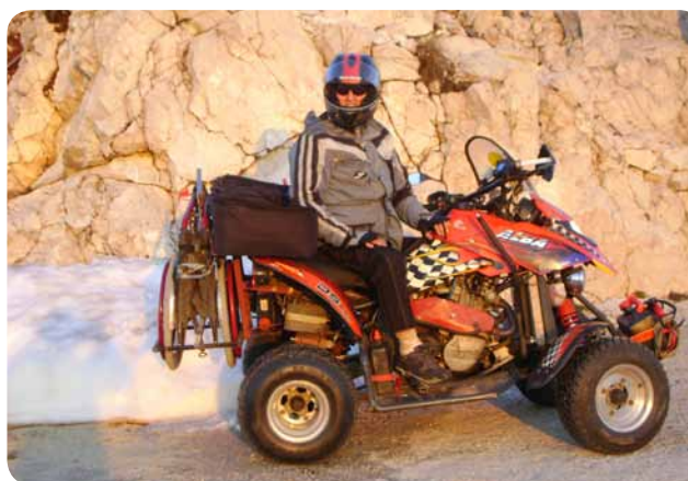
Z vzdržljivim štirikolesnikom spet na dolgo pot