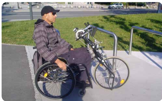
Bolj praktičen pripomoček, ki se pripne na sobni voziček.

ni zgodil kdaj prej, ampak upam, da se bo ponavljal v naslednjih letih. Vsem se zdi prav zanimivo, da uživam na ročnem kolesu, in da sem ravno jaz, ki nisem invalid, organiziral takšno srečanje, sami se pa prej nikoli niso zbrali. V Avstriji so skupinski treningi in rekreacija kar nekaj vsakdanjega in tamkajšnji ročni kolesarji so zato tudi v izredno dobri formi. V slogi je moč, in če se komu kdaj ne ljubi na kolo, a ve, da ga čaka nekaj kolegov, bo seveda šel. Če pa zmeraj poganjaš sam in nimaš družbe, je zagotovo težje in tudi rezultati niso tako dobri.