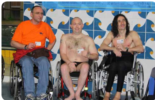
Tres hombres from SHS

Vsi, ki ste v »main streamu«, ste lahko dogodek zasledili na Pop TV in na tretjih Sprehodih pod morjem v Slovenskih Konjicah. Dobro obveščeni ste tam lahko