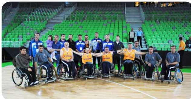
Že tretjič zapored je zmagala ekipa KIK Sana iz Sanskega Mosta

Pred polfinalnimi tekmami med Partizanom in Bu-