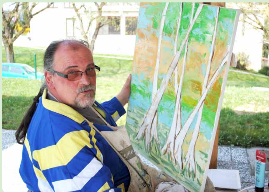
Slika Breze, novejšo delo Borisa Štera