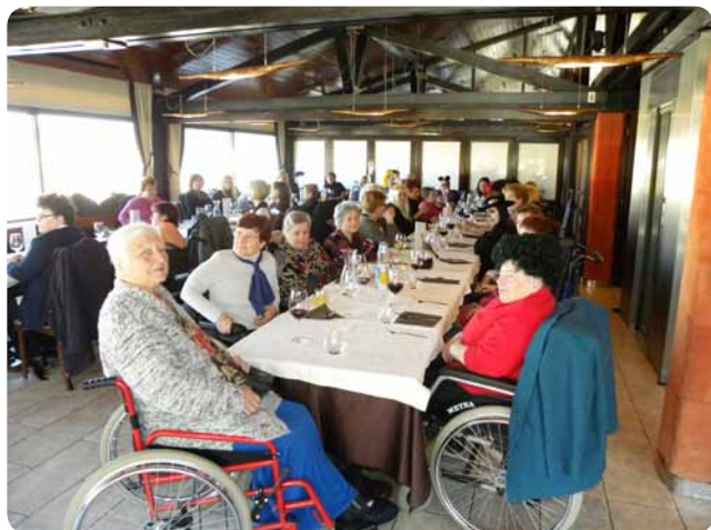
Dan žena s pustovanjem