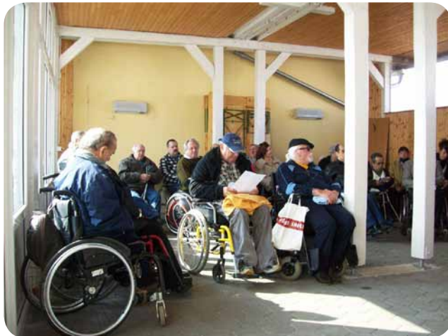
Številna udeležba na občnem zboru članov

V letu 2011 smo imeli še dva zaposlena pri programu javnih del, ki je bilo stoo odstotno (razen regresa zaposlenih) financirano iz sredstev ZRSZ, ter enega prek programa DBO, kar nam je bilo v veliko pomoč pri izvajanju programov. Zelo cenimo tudi delo in pomoč prostovoljcev, ki se vključujejo v naše dejavnosti, in jih občasno tudi nagradimo.