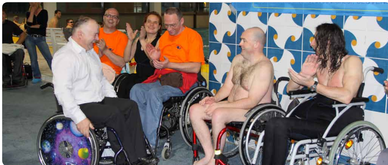
Podelitev denarnih nagrad

Da, bratje in sestre, v Mariboru je Če lahko vozim, se lahko potapljam prekosil vse projekte aktualnega mariborskega ljubljenege vodje. Tretja izdaja mednarodnega druženja v Pristanu, ki ni več le tradicionalna