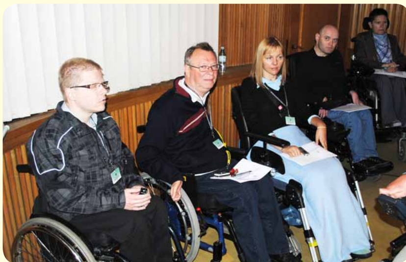
Predstavniki Zveze na posvetu

(Razmerje med reprezentativnimi invalidskimi organizacijami in državo pri uravnavanju invalidske politike po Konvenciji o pravicah invalidov).