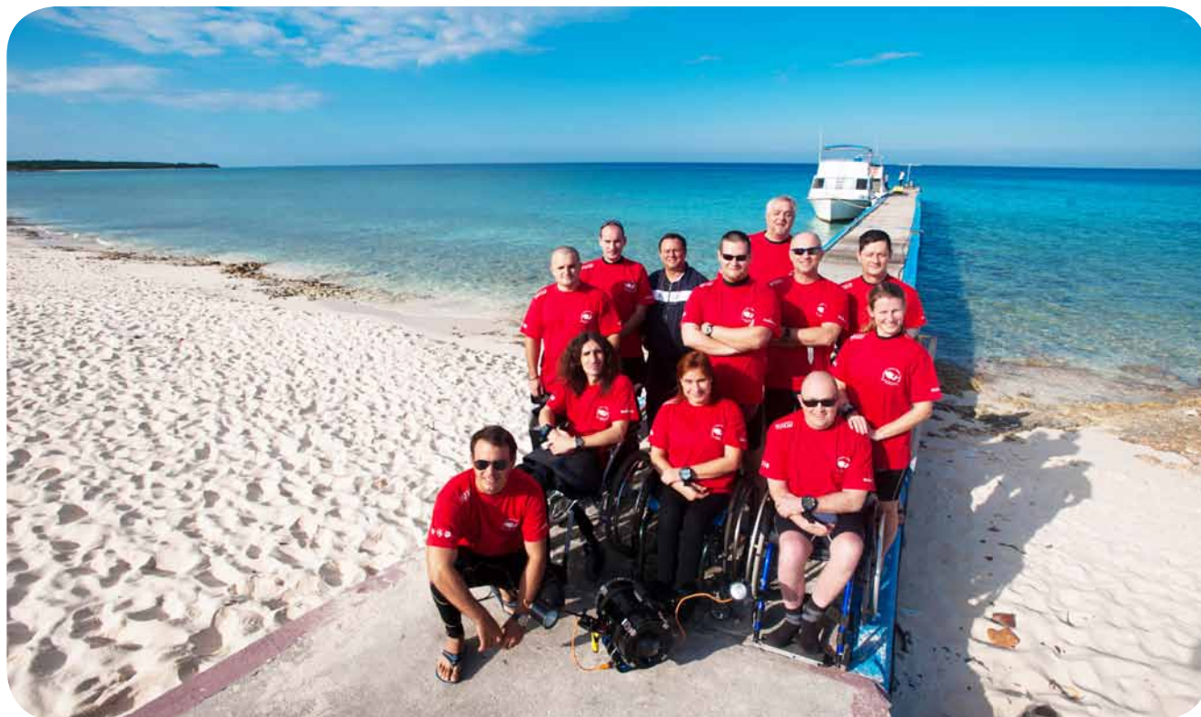
Razglednica s Karibov