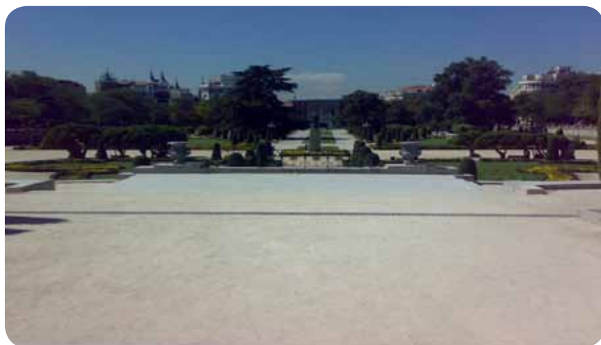
Lepo urejen park Retiro

od enega muzeja do drugega popelješ. Z vrha avtobusa sva si tako ogledala dober del mesta, denimo Plazo de España s kipom Don Kihota in Sanča Panse. Plaza ali trg je pomemben prostor, središče kulturnega dogajanja, kjer se zbirajo ljudje, in to zlasti ob praznovanjih.