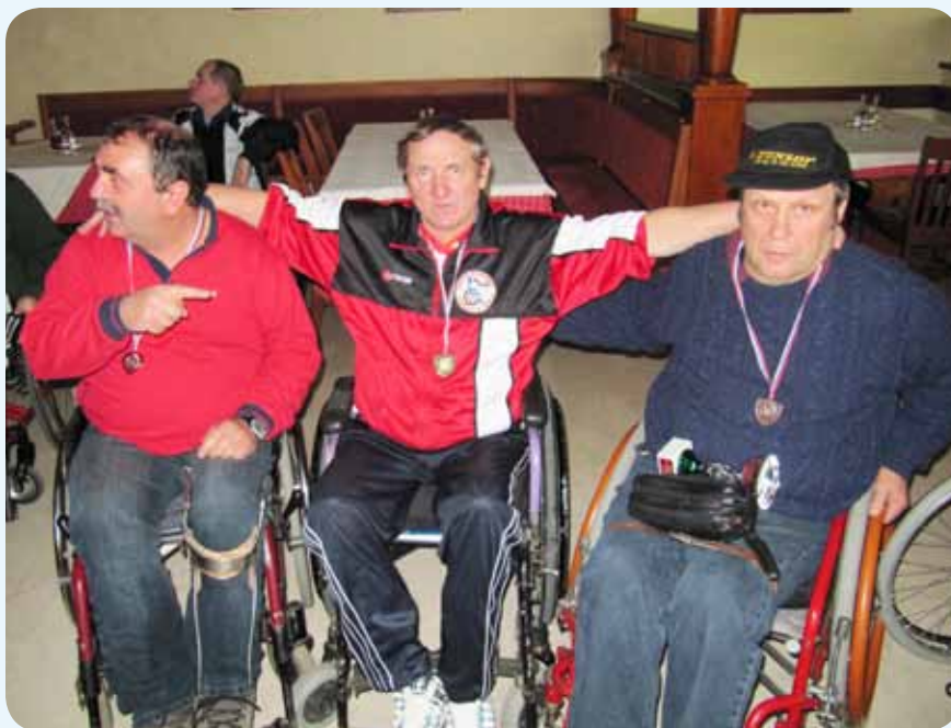
Zbrani prvi trije v absolutni kategoriji

Rezultati prvih treh v posamezno odprti kategoriji: