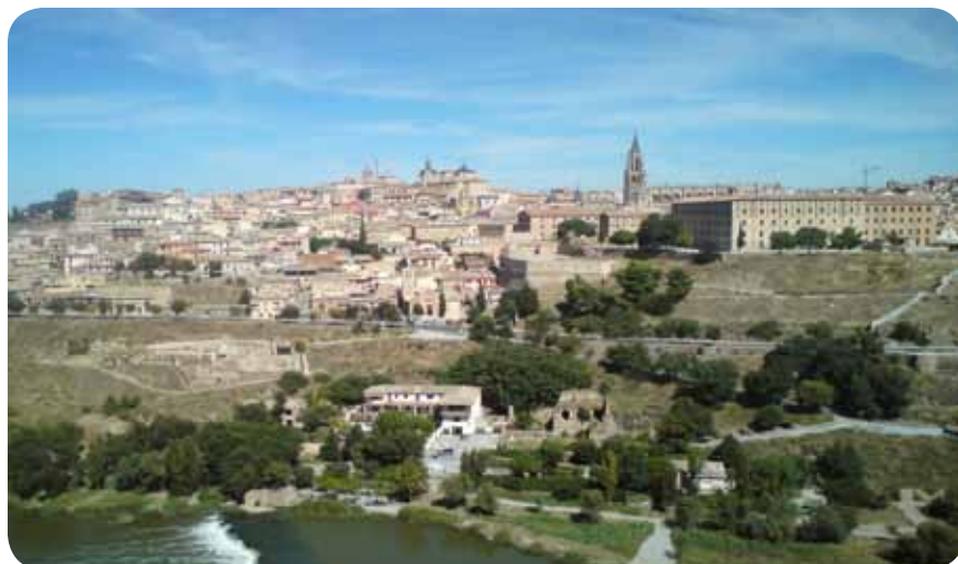
Toledo slikan iz turističnega avtobusa.