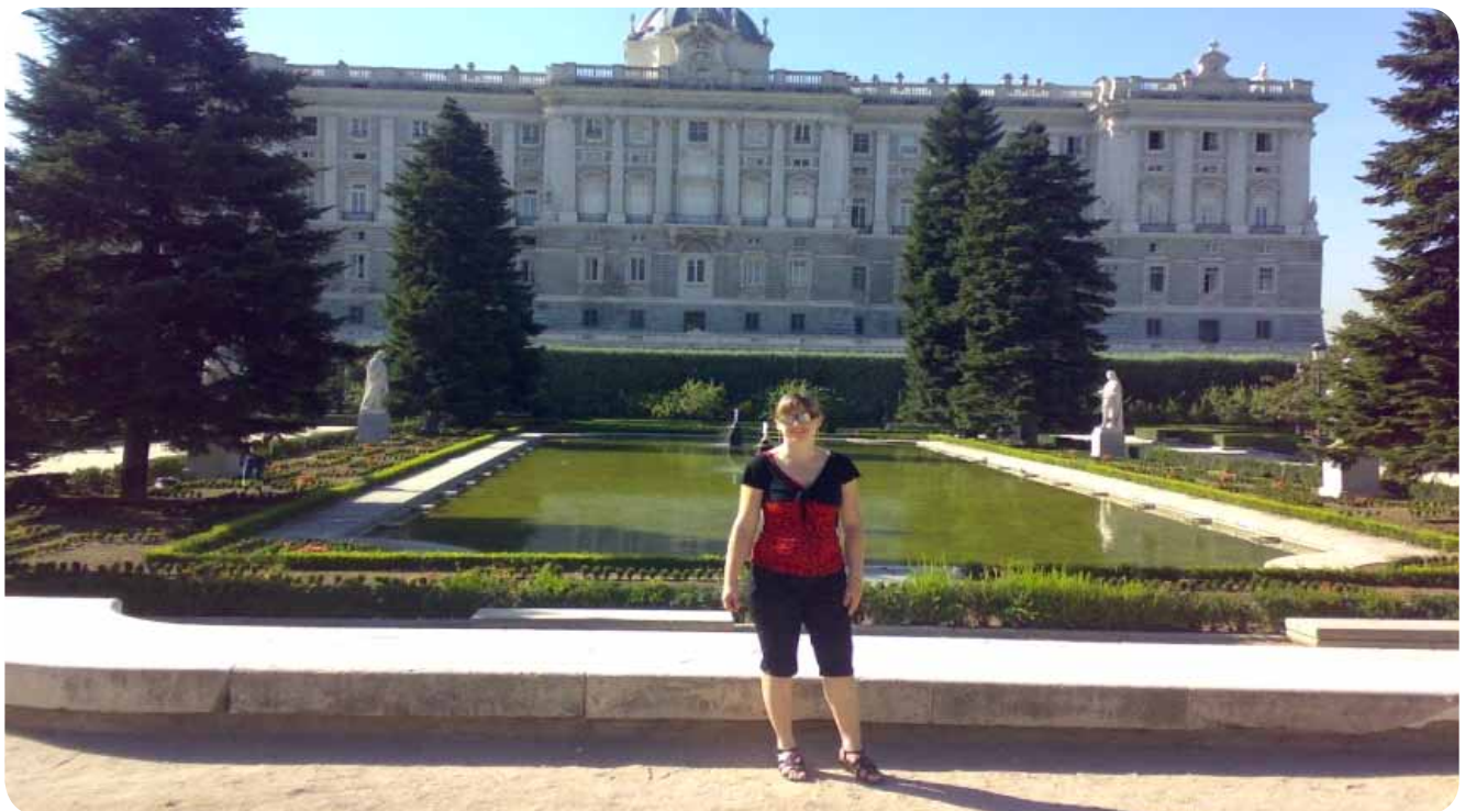
Elegantni Sabatinijevi vrtovi pred kraljevo palačo.