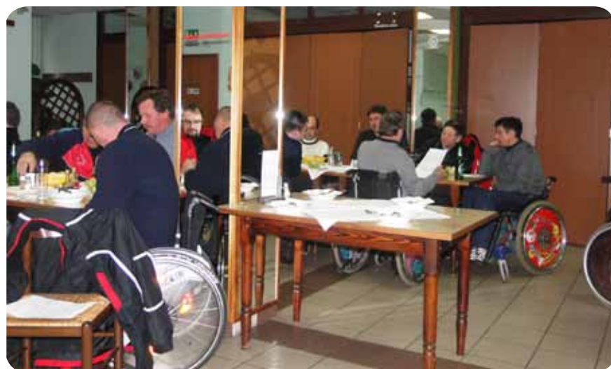
Po tekmovanju prijetno druženje