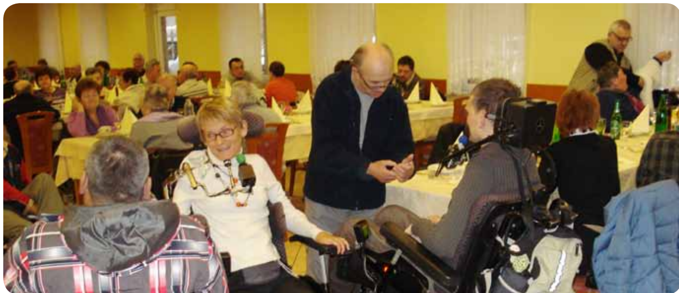
Številčna družčina ob koncu leta