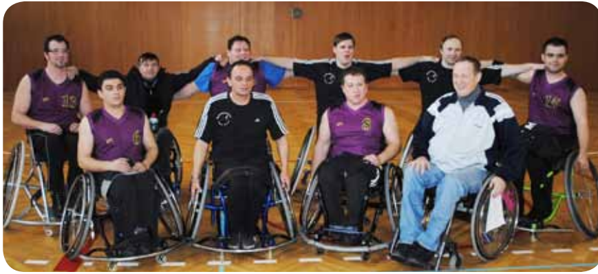
Mariborčani so nekoliko nepričakovano, a povsem zasluženoma osvojili pokal organizatorja.