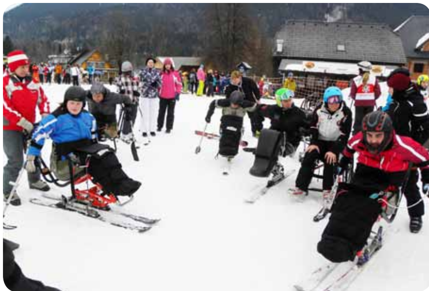
Še zadnji napotki, nato pa na vlečnico

Zveza paraplegikov Slovenije je v Kranjski Gori od 25. do 27. januarja 2011 v sodelovanju s Smučarskim klubom športnikov invalidov ALBATROS in Zvezo za šport invalidov Slovenije – paraolimpijski komite pripravila tridnevni smučarski kamp. Udeležilo se ga je 16 smučark in smučarjev iz naših pokrajinskih društev, društva Paralitikov, drugih društev in celo smučar iz Hrvaške. Na smučišču ob hotelu Larix so začetnikom in tudi bolj izkušenim smučarjem na dvodnevni dopoldanski in popoldanski tečajih tudi tokrat pomagale študentke delovne terapije zdravstvene fakultete v Ljubljani.