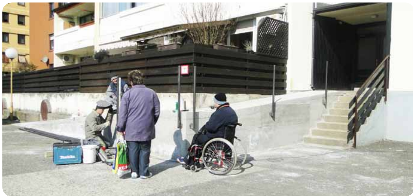
Zaključna dela podjetja LAC, d.o.o., pod nadzorom predsednika DPSŠ