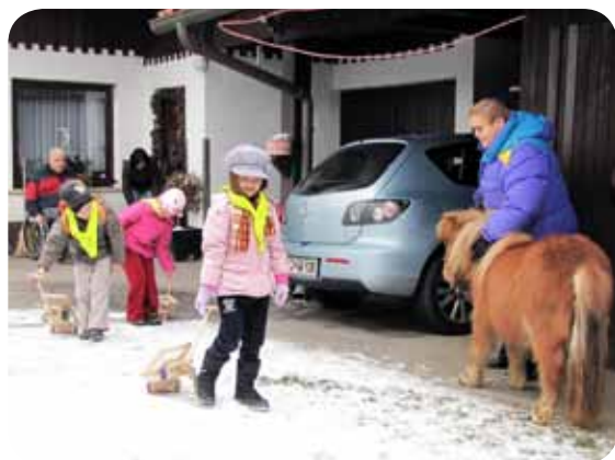
Na koncu je vsak odvtel svoj vozek.