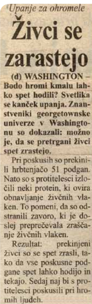
DELO - 07.12.1995