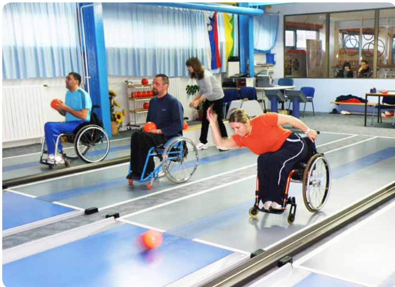
Tekmovanje za kegljače iz vseh pokrajinskih društev