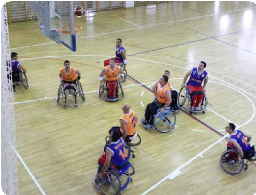
V prvi tekmi v Sesvetih sta se pomerila KKI Zagreb in KKI Vrbas.