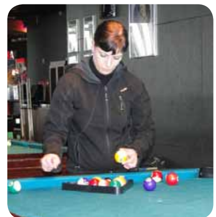
Edina ženska predstavnica

servisiranju medicinskotehničnih pripomočkov, pri nakupu in adaptaciji osebnih vozil, prevozih v bolnišnice in ambulante. V telovadnicah in kegljišču, v bazenu in društvu izvajamo program ohranjanja zdravja.