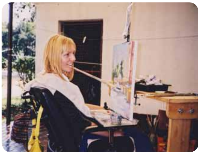
Če mi uspe, sem zelo vesela.

Včasih nas spravita v pravi obup. Tako se na delavnica sliši tudi kakšna sočna kletvica in celo kakšne solze se pojavijo, še posebno pri umetnicah nežnejšega spola. Lahko rečem, da sta stroga, toda vedno pripravljena pomagati, svetovati in tudi vse skupaj obrniti v kakšno šalo. Na delavnicah je vselej pestro in večinoma dobro razpoloženje.