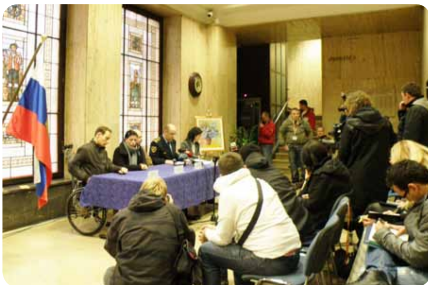
Okrogla miza o varnosti v prometu je potekala v avli Ministrstva za notranje zadeve RS.