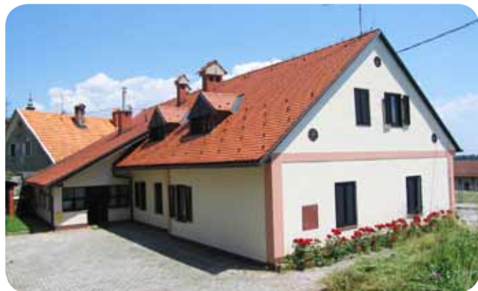
Dergančeva domačija - Dom paraplegikov