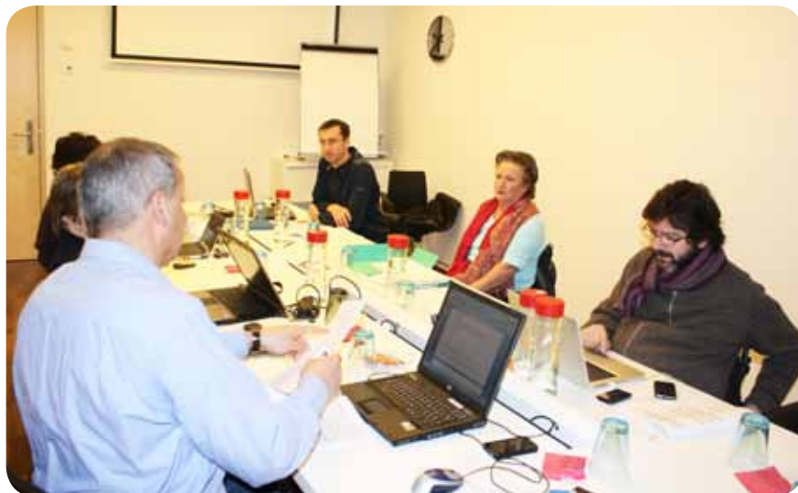
Sestanek upravnega odbora ESCIF v Berlinu

Daljša točka je bila tudi na temo novih internetnih strani www.escif.org . To točko sem vodil jaz, saj so