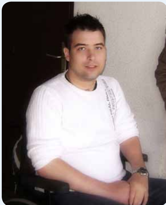
Mladi Laci se je hitro aktivno vključil v društvene dejavnosti.

Verjetno se je tudi tebi porajalo vprašanje, ali res ne boš več hodil?