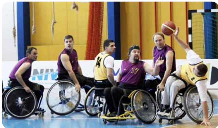
Žogo bo težko podati soigralcu.

Zaključek regionalnega tekmovanja bo 17. aprila, ko se bosta ob finalni tekmi NLB LIGE pomerili tudi najboljši ekipe naše regionalne lige. Takrat bomo dobili zmagovalno ekipo za sezono 2010/2011.