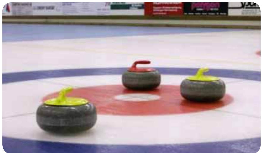
Kamni za curling

Od klasičnega curlinga se razlikuje predvsem v tem, da met poteka iz vozička, pri čemer se noge ne smejo dotikati ledu. Vozički, ki se uporabljajo pri tem športu, so navadni in ne zahtevajo posebne prilagoditve. Mogoče je uporabljati celo električni voziček. Kamni se lahko spustijo