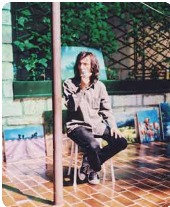
Tudi mentor včasih občuduje naša dela.

Počasi sem se jim začel pridruževati. Tako sem se prvič udeležil enotedenske likovne kolonije v Semiču. Prvo moje delo je bila s tušem narisana slika, ki je prav gotovo ne bi nikomur pokazal. Ne da bi vedel, jo je eden od mentorjev obesil na razstavo, ki je bila na koncu likovne kolonije. Bil sem presenečen, ko sem svojo sliko zagledal na razstavi v Semiču.