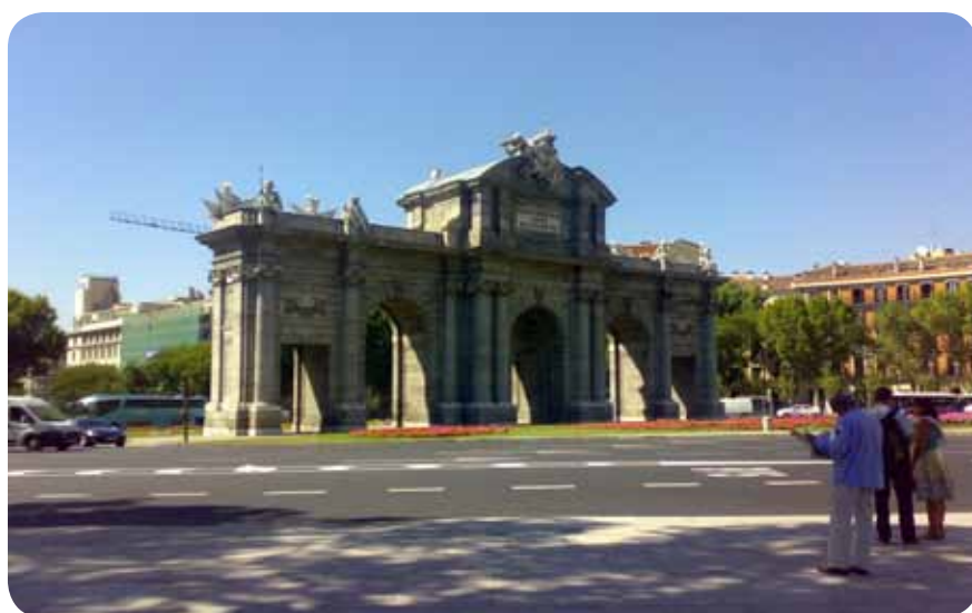
Takšna so videti puerte ali vrata, na sliki je Puerta de Alcalá.