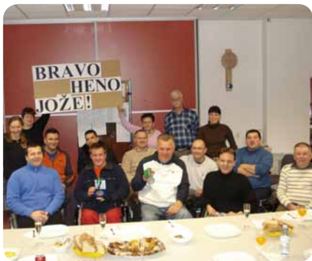
Ponosni smo na naša dobitnika srebrnih medalj.

Naši košarkarji so se udeležili tradicionalnega košarkarskega turnirja v Dobravi pri Ljubljani in osvojili drugo mesto. Na medijsko odmevnem turnirju drugega kola košarkarske lige na vozičkih, ki smo ga organizirali s pomočjo II. Osnovne šole in občine Rogaška Slatina, sta ostali doma dve zmagi, premagali smo DP Maribor in DP Kranj Novo mesto.