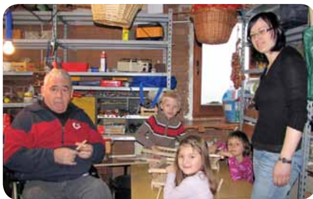
Tine v delavnici z otroki in učiteljico 1. razreda