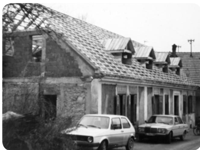
Temeljita obnova Dergančeve domačije