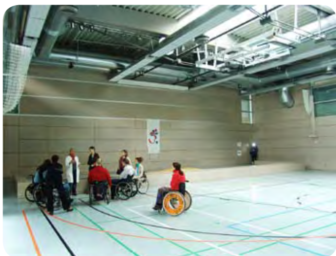
Prostori za rekreacijo v rehabilitacijski kliniki v Heidelbergu.

tem, ki bi zares izvedel gib ali neko aktivnost.