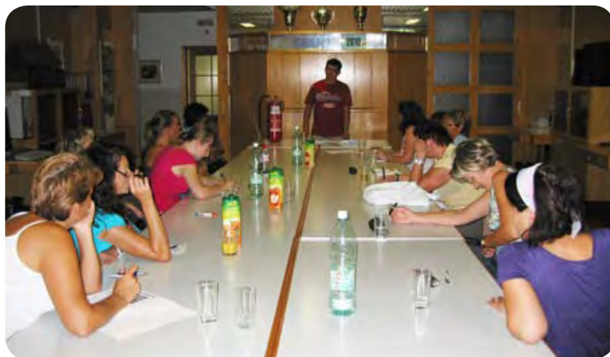
Izobraževanje osebnih asistentov na sedežu Zveze.