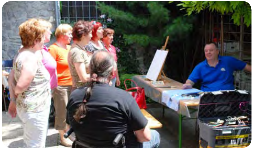
Vaščanke Leš so zapele nekaj ljudskih pesmi.