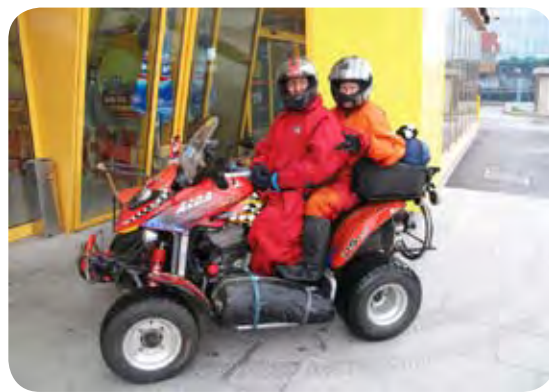
Postanek na poti domov.

Moram priznati, da sva na tej, 1800 kilometrov dolgi poti, videla veliko dvignjenih palcev, med pogovori pa doživela še več odobravanja in priznanja, da si upava na takšno pot. Mnogi sploh niso mogli dojeti, da paraplegik (če seveda najprej počisti svoje podstrežje) sploh lahko potuje in uživa povsem enakovredno življenje. In takrat sva bila ponosna sama nase. Prav je, da se