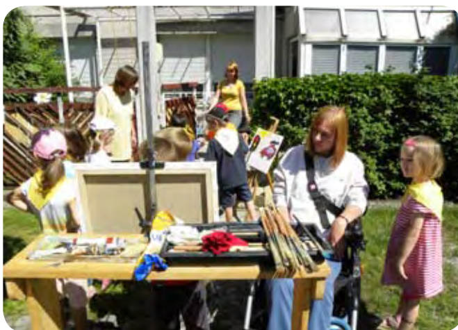
Malčki so tudi sami poskusili, kako se slika s čopičem v ustih.