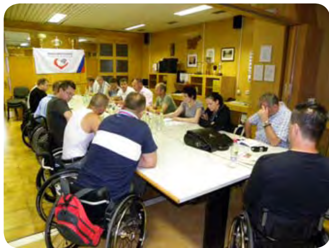
Predstavniki ekip in vodstvo regionalne lige se pripravljajo na novo sezono.