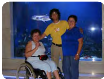
Akvarij v Piranu, avgust 2010

Udeležili smo se likovne predstave otrok v Ljubljani in 7. mednarodnega Dneva brez vozička v Ilirski Bistrici.