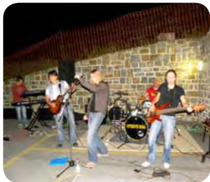
V sredo smo imeli res pravi rock.

Seveda so nas na koncertu navdušili z značilno rock glasbo. Zaigrali so nam znane uspešnice še bolj znanih ansamblov YU-ROCKA (Bijelo dugme, Riblja čorba, Plavi orkestar, Parni valjak, Pankrti, DENIS&DENIS, Divjle jagode) in nas na trenutke popeljali nekoliko nazaj, v čase dobrega starega rocka. Seveda je bil to pravi rock, da se je tresel cel Pacug, med drugim pa smo slišali znane skladbe, kot so: Kad ljubi Bosanac, za njim pa še Računajte na nas, Motori, Lipe cvatu, Bandera rossa itd. Na koncu lahko zapišemo, da ta ansambel še veliko obeta, kajti preprosto rečeno – res so dobri!