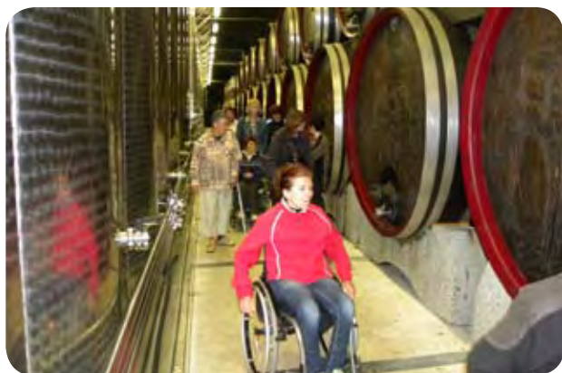
Ob obisku vinske kleti v Metliki

Seveda so se dobro imeli, v društvu pa smo veseli, da smo tistim našim članom, ki zaradi različnih vzrokov