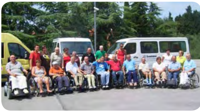
Še spominski posnetek za slovo

malokdaj zapustijo svoje domove, omogočili nekaj lepih in verjetno tudi nepozabnih trenutkov.