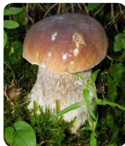
Jurčki na Pokljuki so redko kdaj črvi.

Videl sem ga kar skozi okno koč. Velik je bil več kot 15 cm, zraven pa je bil seveda tudi manjši bratec.