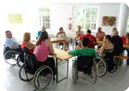
Socialni poverjeniki so konec tedna posvetili svojemu izobraževanju.