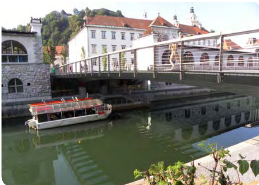
Mesarski most, pod njim pa rečni pristan

Velika višinska razlika med levim in desnim bregom Ljubljanice je premagana z obojestranskimi stopnišči, spremljata pa ju serpentinasti klančini, ki omogočata prehod tudi ljudem na invalidskih vozičkih in materam z otroškimi vozički. Klančini sta tehnično dovršeni in se odlično vklapljata v objekt, vendar pri slabši vidljivosti in pri