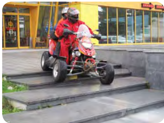
Še dobro, da stopnice niso ovira.

Po dveh dneh pa ponovno v sedlo in po magistrali še globlje v notranjost Dalmacije. Zalivčki, marine, divje plaže, nekatere strmo spuščajoče se proti morju, nekatere peščene, polne turistov, dopustnikov in plavalcev, veter na obrazu in svoboda, ki mi jo daje štirikolesnik. Vmes kakšen postanek, kavica, točenje goriva na bencinski črpalki. Šibenik, Trogir, Split – vse je že za nama. Večja mesta kar po vrsti obvoziiva po obvoznicah. Ne da se nama po precejšnji vročini