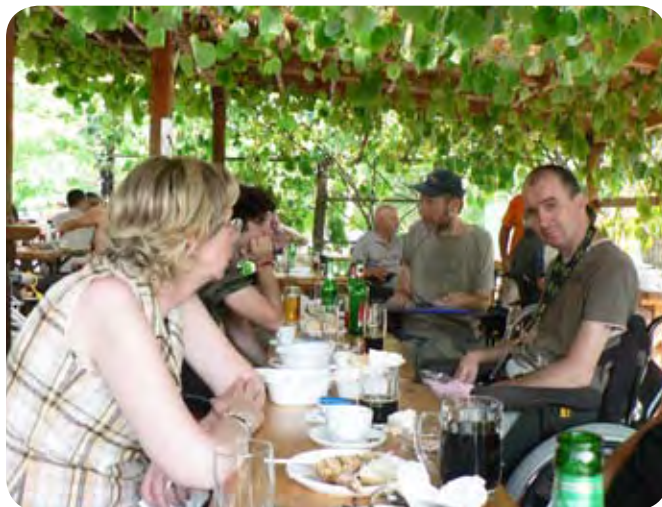
Po kosilu smo imeli čas za pogovore.

Po končanem ogledu muzeja smo se na hitro odpravili navzdol po Trentarski dolini mimo Bovca, proti Kobaridu, in tam zavili desno v Breginjski kot. To je dolina na skrajnem zahodnem robu Slovenije, med Starim selom in Breginjem,