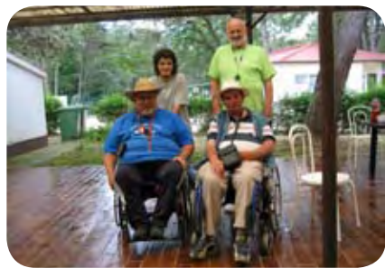
Pineta, junij 2010

V teh nekaj mesecih sem kot voznik s člani Zveze obiskal kar nekaj krajev. Uredil in pripravil sem počitniški dom v Pineti (Hrvaška) in počitniške hiše v Čatežu.