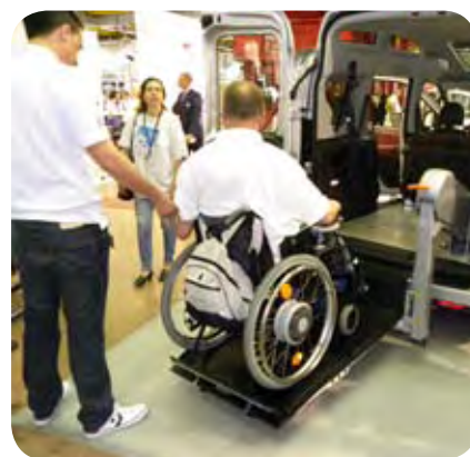
Veliko je bilo prilagojenih avtomobilov in različnih klančin.

Nekaj članov društva si je v Bologni ogledalo letošnji mednarodni sejem varovanja zdravja z medicinskotehničnimi in drugimi zdravniškimi pripomočki – EXPOSANITA. V sedmih ogromnih dvoranah so se predstavili številni izdelovalci medicinskotehničnih