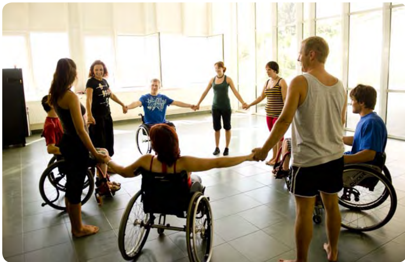
Plesnih delavnic smo se udeleževali vsak dan.