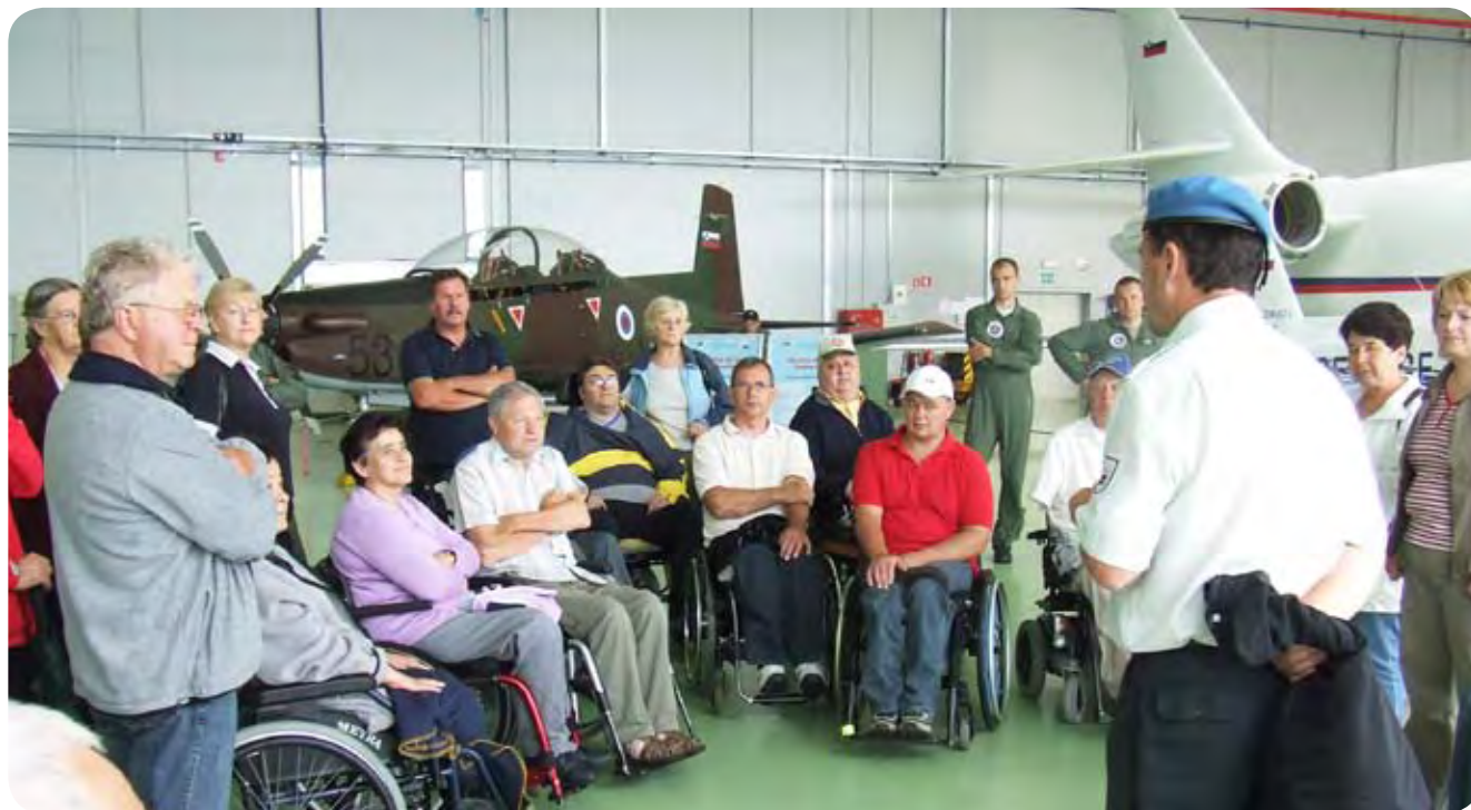
Zanimivo predavanje, v ozadju pilatus in falcon