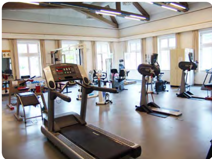
Telovadna dvorana v kliniki v Heidelbergu.