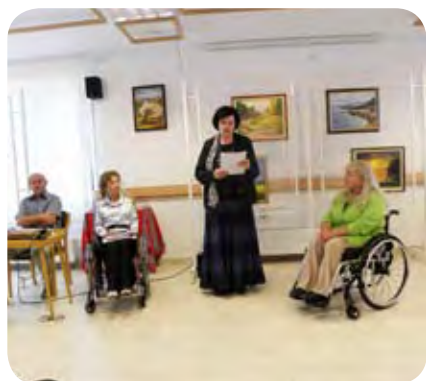
Kritiko likovnih del je posredovala Vlasta Dolenc - Rebek.