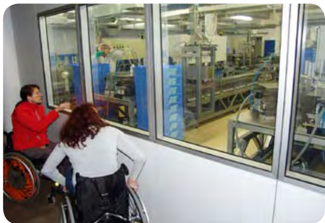
Proizvodni prostori podjetja Manfred Sauer.

janje občutljivih in kvantitativnih metod, s katerimi bi lahko ocenjevali rast živčnih nevronov in funkcionalno okrevanje po poškodbi hrbtenjače.