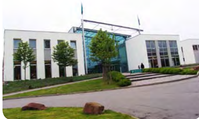
Fundacija Manfred Sauer.