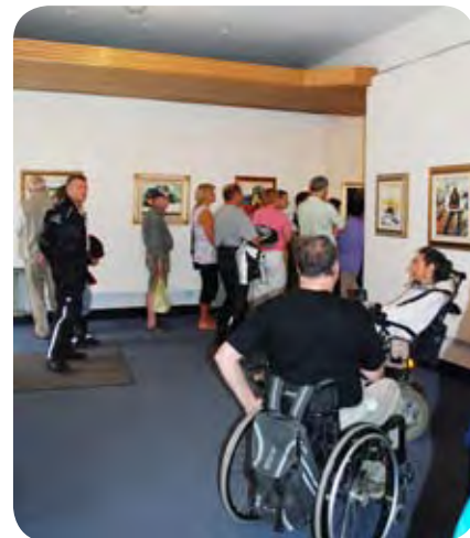
Kljub dopustom so si razstavo ogledali številni obiskovalci.