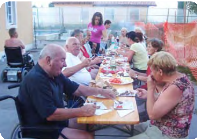
Po kopanju se je prilegla dobra hrana

Brez zamere, med njimi sem tudi sam, ampak tokrat me je druženje z omenjenimi prijatelji še dodatno prijetno izpolnilo. Bili smo družina; tarnali smo, se izpovedovali, nakladali, se veselili, polemizirali in celo prepevali. Dobro smo se razumeli in ostajam pri svojem mnenju, da so druženja v takih skupinah najlepša doživetja, tako za mlade in mlajše, ki si želijo več izzivov, kot za starejše, ki upamo na dolge prijateljske pogovore in obujanje spominov na mladost. Društva paraplegikov pozorno sledijo novim smernicam, ki jih narekujejo člani sami, zato pa je na voljo toliko različnih programov, ki odlično zapolnjujejo naš prosti čas.