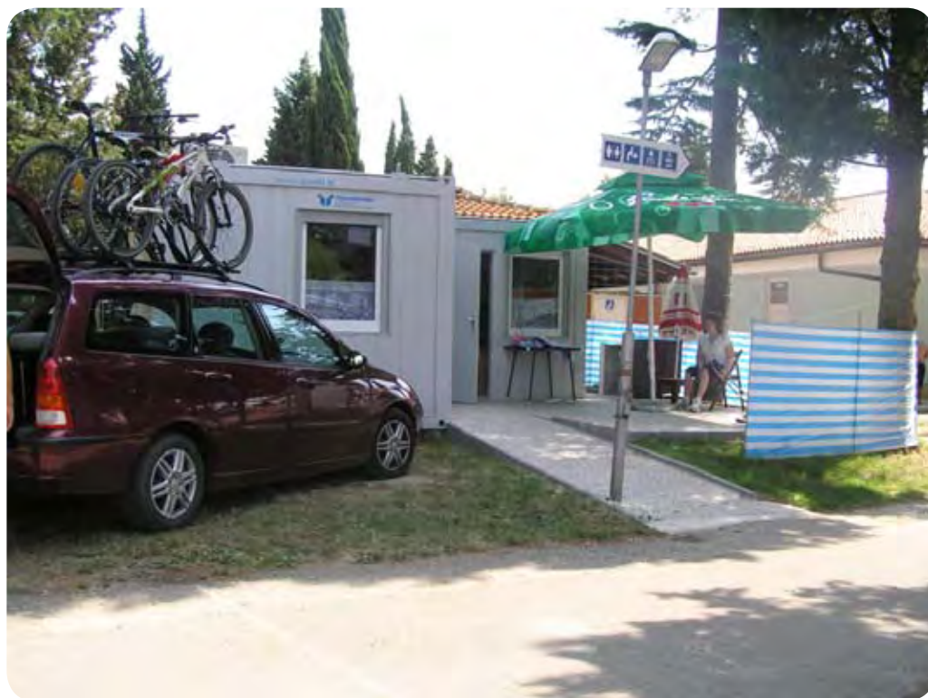
Kontejner je bil zaseden vso sezono.

Priporočamo, če želite preživeti čudovit dan, so še sporočili.