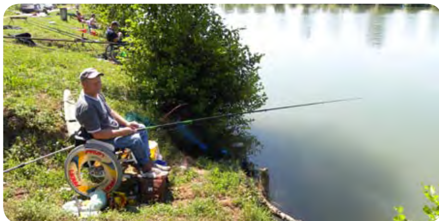
Tokrat so ribiči imeli kar dober ulov.

Ribiči so od Zveze paraplegikov dobili tudi različne plovce, ki jih bodo lahko koristno uporabili pri svojem priljubljenem hobiju.