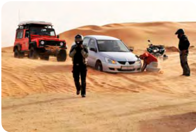
Peščeni zameti na cesti.

Libijci so izredno solidarni ljudje in denar tam nima posebne veljave, to smo videli in doživeli večkrat na tem potovanju. Pri nakupu kruha