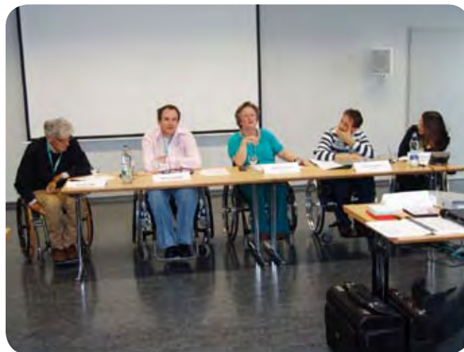
Delovno predsedstvo okroglega omizja na kongresu.

Raziskovalni projekti so usmerjeni v razvoj računalniških orodij, ki bi bila sposobna ustrezne prepoznavne možganske aktivnosti iz posnetih vzorcev elektroencefalografije. Zelo poenostavljeno: ti vmesniki bodo lahko teoretično iz vzorca možganske aktivnosti prepoznali misli, hotenja ali namere, ki nastajajo pred in med gibanjem oziroma funkcionalnimi aktivnostmi, sočasno pa nadzirali robotski sis-