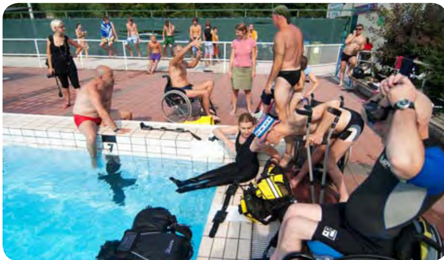
Gneča ob bazenu.

Prireditev smo si tokrat zamislili v mednarodni zasedbi, zato smo na dogodek povabili paraplegike iz Avstrije, Hrvaške, Italije, Madžarske in Srbije. Povabilu so se žal odzvali le prijatelji iz Srbije in Hrvaške, a lahko kljub temu rečemo, da nam je uspelo uresničiti mednarodno zasedbo.