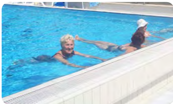
Žene na klepetu v bazenu, možje pa verjetno (?) pri točilnem pultu

V imenu vseh 21 počitnikarjev se zahvaljujem Društvu paraplegikov Dolenjske, Bele krajine in Posavja ter Zvezi paraplegikov Slovenije, ki so nam to letovanje omogočili. Tako smo tudi mi lahko dejavno uresničili to večno modrost: »Živi tako, kakor da je vsak dan tvoj poslednji«. Prav to želim vsem, ki bodo svoj oddih v prihodnje načrtovali v Pacugu.