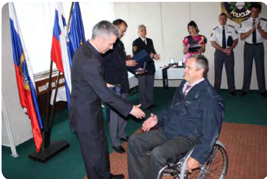
Predsedniku društva je priznanje izročil generalni direktor policije.