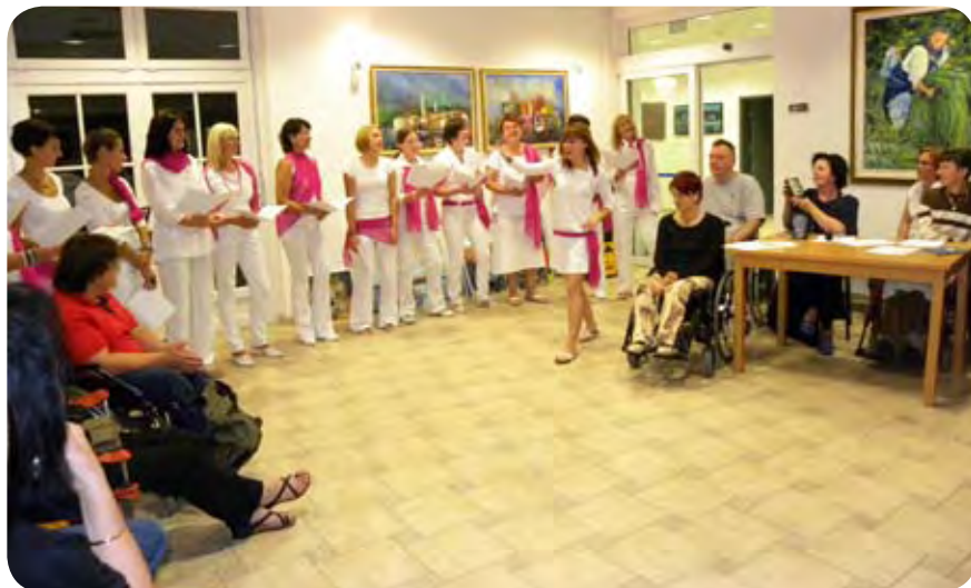
Na koncu so nas očarale ŠIŠKE.

Likovni umetniki so 3. septembra z zadnjo likovno delavnico končali