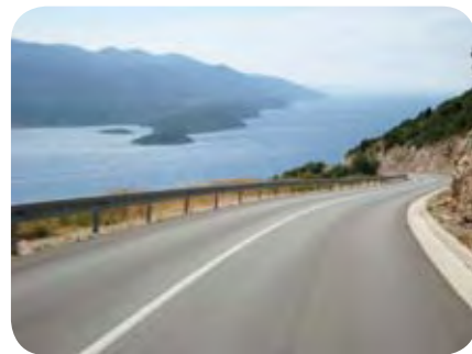
Pogled na jadransko magistralo.

Gospod si je dobro izmislil tisto, da se na njegov dan ne sme nič delati. Tako v nedeljo ostaneva v kampu, počivava na plaži, dobro jeva in že sledi psihična priprava za naslednji dan. Po zajtrku, kupljenem v sosednji trgovini, se lotiva pospravljanja, sledi plačilo na recepciji in veter že hladi obraza, skrita pod čelado. Zadru se izogneva po obvoznici, mimo naju drvijo prelepi zalivčki, polni dopustnikov. Po registrskih