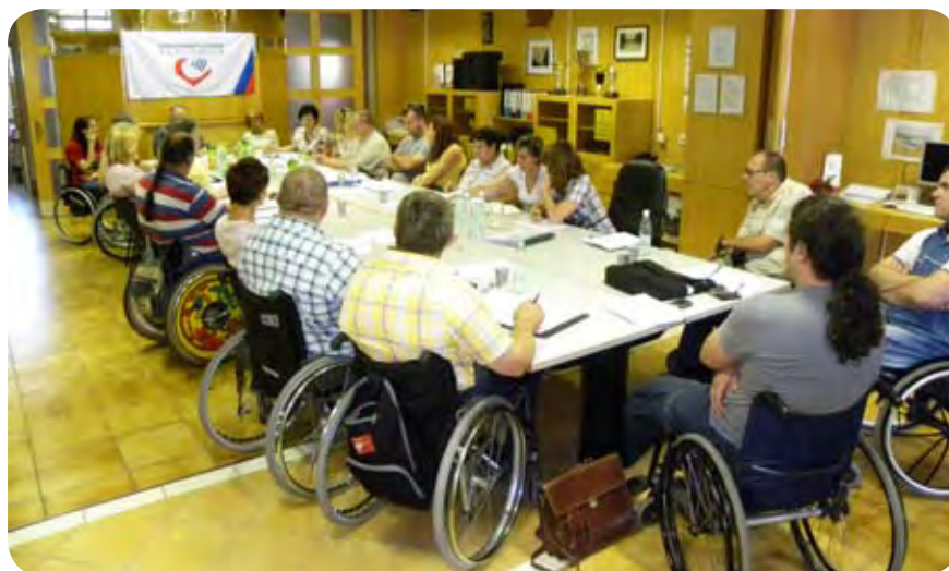
Predstavniki društev so se na posvetu dobro seznanili s poslovanjem.