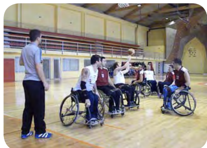
V finalnem srečanju je bilo boljše moštvo organizatorjev.

V otvoritveni tekmi sta se pod koše zapeljali ekipi DP Mercator