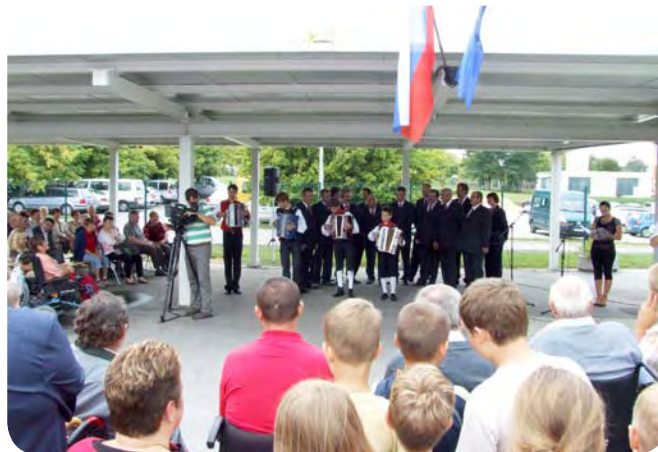
Še en spomin na 30-letnico društva v Novem mestu.

V okviru interesnih dejavnosti so bile izvedene aktivnosti, zanimive za vse člane. Tako smo organizirali tri predavanja in deset predstavitev v javnosti, več srečanj članov, dva izleta, obisk kulturnih predstav, organizirali in sodelovali smo na likovnih delavnicah ter pripravili kulturne programe na srečanjih. Ob 30-letnici društva smo pripravili večjo proslavo in predstavili