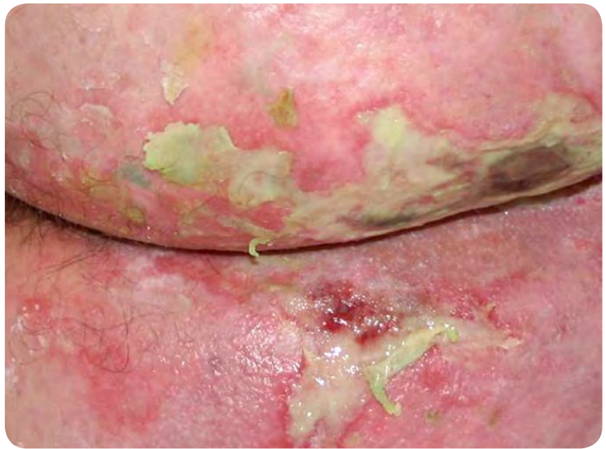
Fotografija preležanine zaradi prekomernega pritiska v tipični regiji.

Faza preoblikovanja rane je zadnje obdobje med celjenjem. Oblikuje se nov epitelij, brazgotinsko tkivo se dokončno preoblikuje. To obdobje lahko traja tudi do enega ali dve leti, včasih celo dlje (12). Preoblikovanje akutne rane nadzorujejo mehanizmi, ki vzdržujejo ravnotežje med nastajanjem in razgradnjo komponent ter s tem omogočajo normalno celjenje. Med zorenjem se snopi veziva v rani debelijo in natezna čvrstost rane raste sorazmerno z zbiranjem vezivnega tkiva, predvsem kolage-