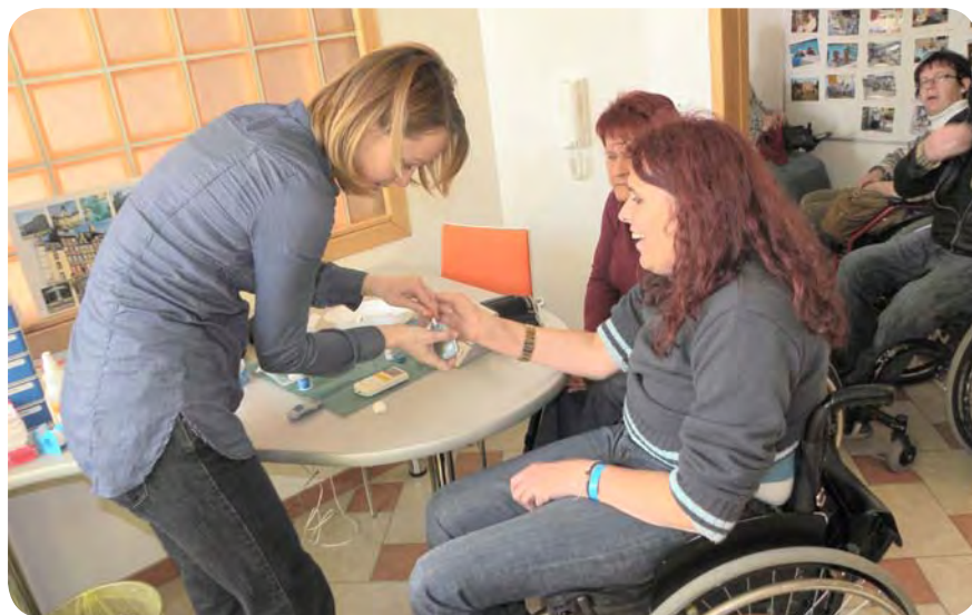
Tudi paraplegiki nismo izjema pri teh boleznih.

Po pregledu je vsakdo prejel svoj izvid preiskav, tisti s povišanimi izidi merjenja pa opozorilo zaradi nevarnosti, ki ogroža njihovo zdrav-