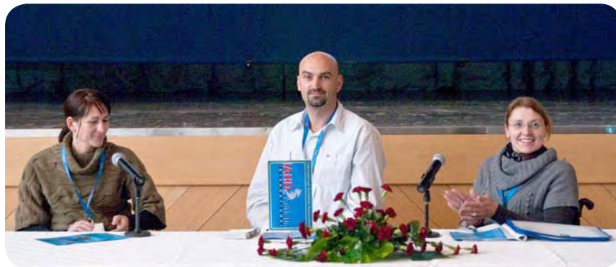
končno smo vodili tudi posamezne sklope predavanj