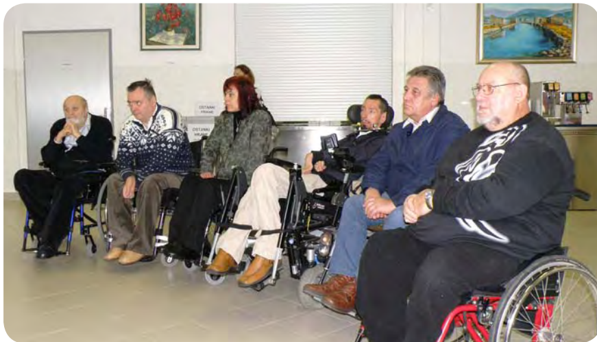
En del razstavljalcev...