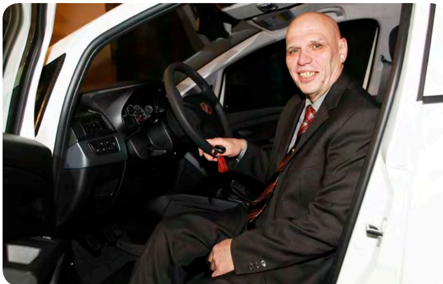
Presenečenje je bilo nepričakovano in veliko.

Še preden je Ančo odgovoril, mu je Tof pokazal ključke in ga pobaral, kaj misli o novem avtomobilu, ki so mu v tistem trenutku pod odrom sneli ponjavo. Ančo je pogledal bleščečega se punta in še vedno ni dojel, da bo odslej on nje-