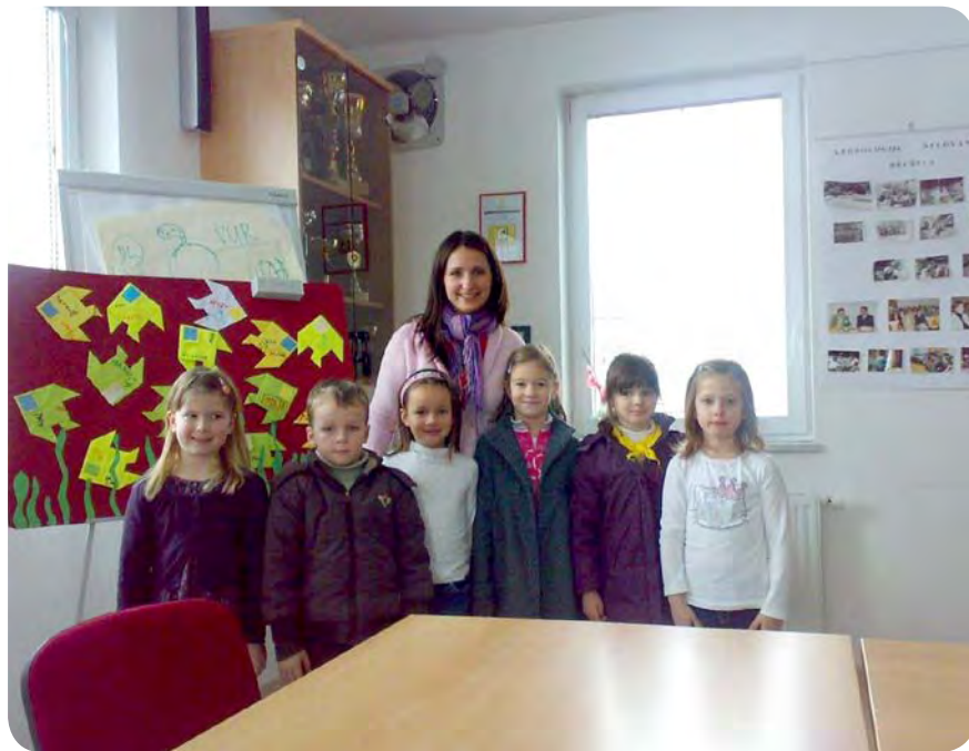
Otroci 1. razreda OŠ s svojimi izdelki.