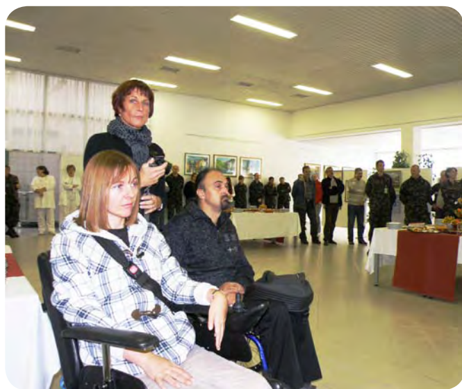
... in drugi del razstavljalcev.