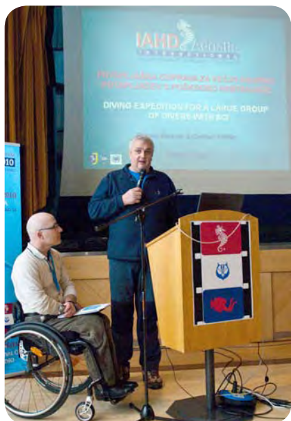
Končno smo tudi paraplegiki predavali profesorjem in doktorjem znanosti