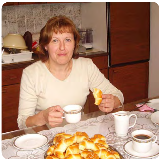
Po končani peki je treba izdelek poizkusiti.

nutki. Kljub številnim težavam, ki se jim ni mogoče izogniti, ji za zdaj še ni treba uporabljati invalidskega vozička. Zelo veliko pripotuje z