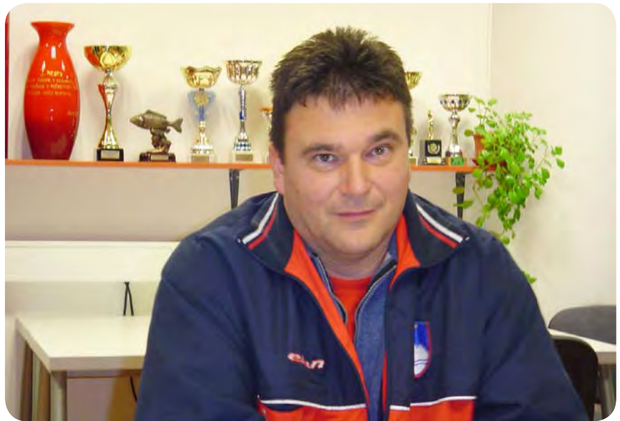
Na uspeh gledam kot na potrditev za vloženo delo in treninge.

Za zdaj v glavnem vse kupujem sam. Nimam sponzorja, bi pa zagotovo prišel prav.