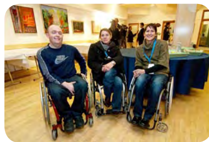
no, pa grupirali smo se tudi

Drugi spremljevalni dogodek simpozija je bil 2. festival podvodnega filma – Sprehodi pod morjem, kjer smo več ur potovali skozi morja Grenlandije, Sudana, Filipinov, Mehike in Jadrana. Izbor filmov iz 13. Beograjskega festivala podvodnega filma je bil pester saj nas je