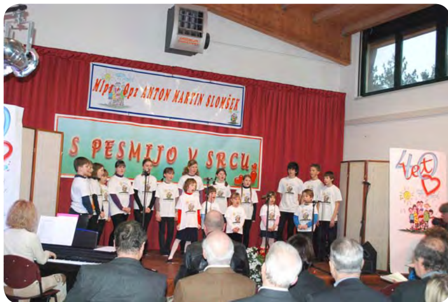
Otroški pevski zbor Anton Martin Slomšek iz Bazovice praznuje 40. Letnico.