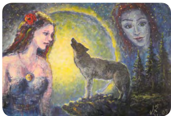
Avtor slike Željko Vertelj je štipendist Mednarodnega združenja slikarjev, ki slikajo z ust ali nogami.