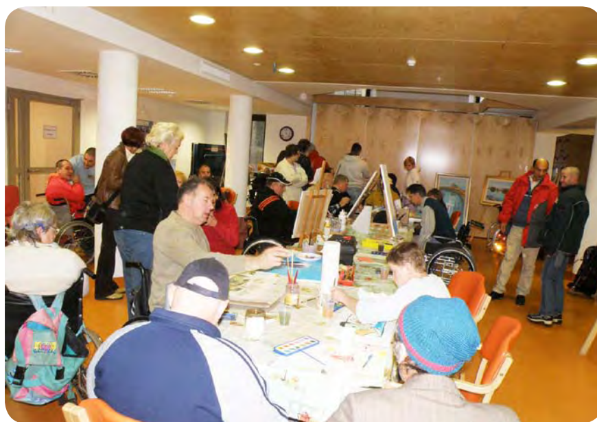
Naši slikarji pri delu.

Čakali smo visokega gosta. Svoj obisk nam je namenil sam predsednik dr. Danilo Turk s spremstvom. Ogladal si je še nenaseljen nov bivalni objekt zavoda in se z velikim veseljem ustavil tudi pri nas v delavnici. Pokazal je zanimanje za