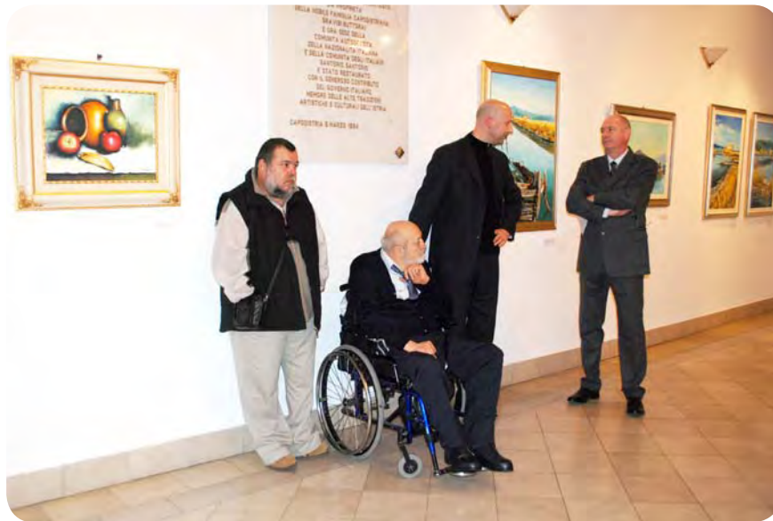
Avtorja je na razstavi predstavil umetnostni zgodovinar Dejan Mehmedovič.

je figurirani pas v prvem planu in mehko, povsem lahkotno prehaja v gestualno razpuščenejšo, nekako impresijsko zabrisano ozadje. Svetlobne vrednosti so mojstrsko podrejene kompozicijski dovršenosti podob, ki se skozi harmonično skladnost kolorita in uporabljeno površino barvne mase združujeta v pridobivanju kvalitete podobe. Slikar se drži zmernega kolorita, ki se v avtorjevem razvoju spreminja in se v končni fazi kaže kot osebna slogovna indikativna karakteristika.