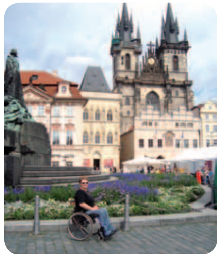
Spomenik, posvečen pobitim protestantom in opozorilo, naj se ljudje ne sovražijo, ampak imajo radi.

Vsekakor svetujem vsem tistim, ki Prage še niste videli in si jo želite ogledati, da to tudi storite. Tudi za nas, vozičkarje, je dobro poskrbljeno, razen že omenjenih tlakovcev, ampak s kakšnim hodečim spremstvom sploh ni problema. Tudi cene se bistveno ne razlikujejo od naših, razen seveda v lokalih, ki so v neposredni bližini kakšne zname-