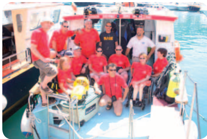
Pred odhodom na potope v luko Santo Stefano.