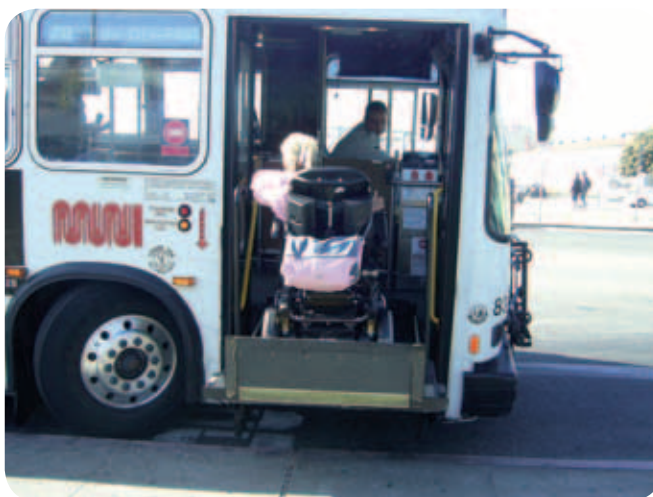
Tako sem vsak dan uživala v vožnji z mestnimi avtobusi žal slike z mojim najljubšim šoferjem nimam :)

Skratka, da ne bom predolga (o tem mestu bi lahko pisala v nedogled), ker me bo drugače urednica za ušesa, ostali smo v San Franciscu in se z avtobusi, tramvaji, metroji, taksiji, ladjicami, itd. vozili od znamenitosti do znamenitosti in tako obiskali Japonsko četrt, park Presidio in idilično marino, kjer se razkošne hišice v viktorijanskem stilu spogledujejo z morjem zaliva, najstrmejšo ulico na svetu – Lombard street, kjer avtomobili vijugajo po serpentinah, obdanih s cvetjem, doživeli smo akvarij in akademijo znanosti s svojim planetarijem,