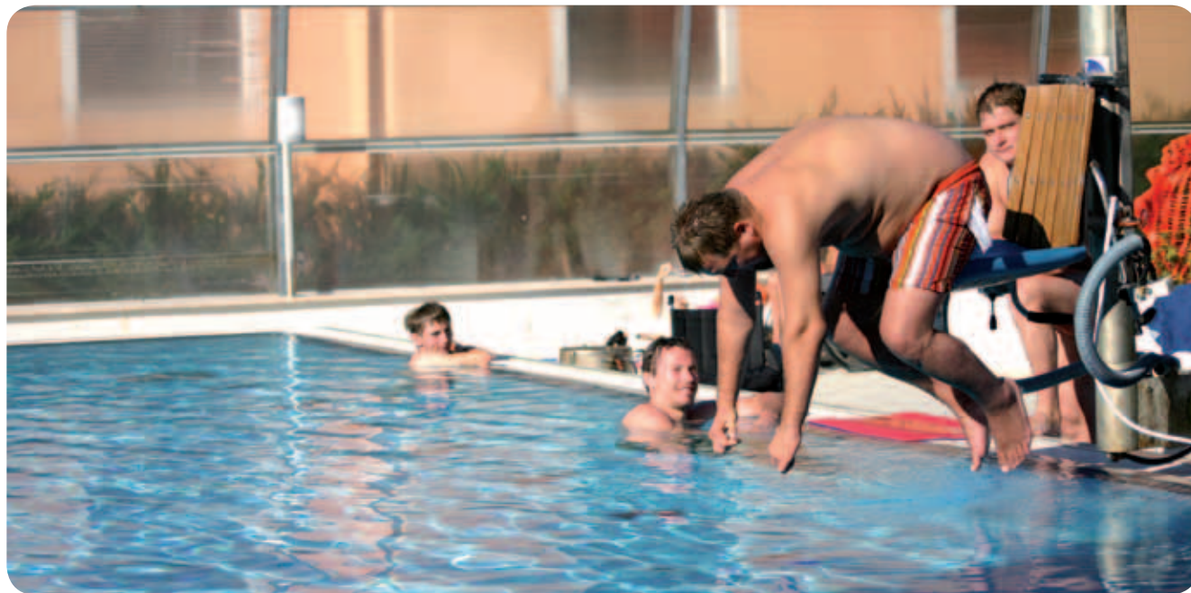
Tetraplegik skače v vodo, zadaj budno oko spremljevalca.

Kot vsako leto doslej v poletnem času je tudi letos Zveza paraplegikov in Društvo paraplegikov Dolenjske, Bele krajine in Posavja omogočila mlajšim članom petdnevno druženje v Pacugu.