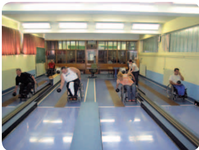
Največ je bilo kegljačic in kegljačev.

Naše društvo po končani zimsko-spomladanski rekreativnošportni vadbi junija vsako leto pripravi tradicionalno tekmovanje v kegljanju, streljanju z zračno puško, pikadu in šahu. To je nekakšen preizkus zmogljivosti vsakega športnika rekreativca, ki se lahko primerja z rezultati iz predhodnih tekmovanj.