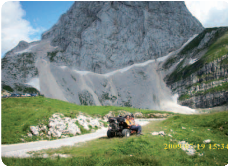
Dan je bil res prelep. Pokošeni travniki na strmih pobočjih. Pokošena trava, skrbno posušena in na starodavni način pospravljena v stanove. Ja, to je utrip prostora, ki ga doživljam tukaj s svojim ATV-jem.

in tam, v glavnem na svojem ATV-ju, otovorjen z razno kramo, spremljevalko, dobro voljo in svobodo. Fotoaparati, beležka in še kaj, kar je potrebno za pisanje, bodo z menoj. Obiskal bom kakšne lepe skrite dele domovine in sosednje države. Nekako vem, da boste v naslednjih izdajah revije Paraplegik z menoj oziroma nami, ki se počutimo svobodni, kar se meni osebno zdi