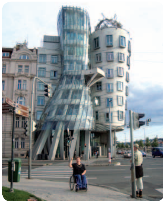
Tako imenovana Plešočka hiša, zanimiva sodobna poslovna stavba v Pragi

V starem delu mesta je znamenita astronomska ura, mimo katere smo šli kar nekajkrat, in enkrat nam je uspelo, da smo bili tam ob pravem času, ko se na uri prikaže dvanajst apostolov, sicer je pa pod to uro vedno strašna gneča. Videla sem tudi