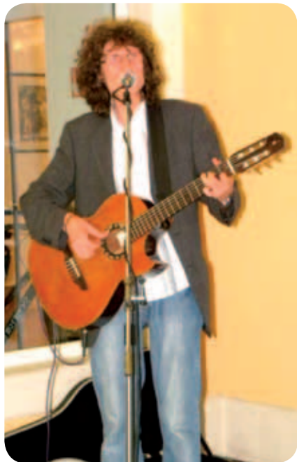
Adi med pevci eden največjih humanistov.