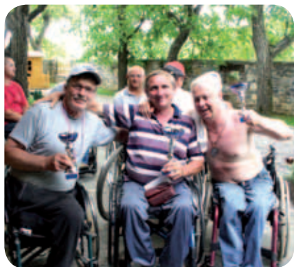
Predstavniki zmagovalnih ekip v ribolovu na Vogrščku 2009.

V nedeljo, 5. 7. 2009 , je bilo na trasi jezera VOGRŠČEK pri Novi Gorici meddruštveno tekmovanje v športnem ribolovu, ki ga je organiziralo Društvo paraplegikov Istre in Krasa in Zveza paraplegikov Slovenije.