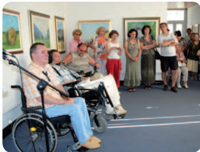
V Doliku se je ob odprtju skupinske razstave zbrala prijetna družina ljubiteljev umetnosti.

navajeni obiskovati in razstavljati v njem, kar nenadoma prenehal delovati v svoji prvotni obliki in na svoji prvotni lokaciji, zato smo se s protestnim pismom obrnili na jeseniškega župana. Kot ljudje, ki so jih nekoč že odrinili na rob družbe, vemo, da si umetniki z Jesenic zaslužijo svojo pozornost in za svoje delovanje obdržijo svoj likovni salon.