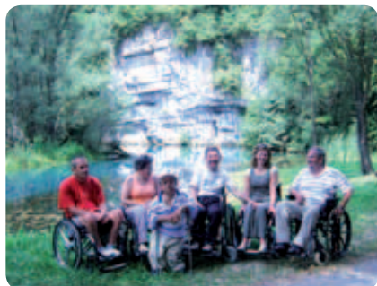
Ob vrnitvi smo si ogledali tudi Krupo in njen izvir.