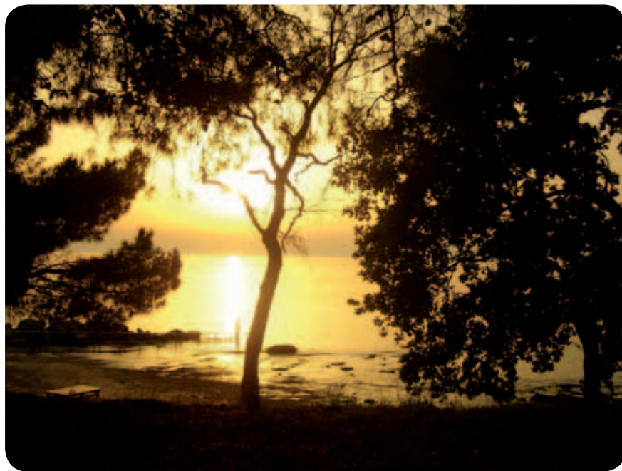
Morje je začetek življenja in vsega, kar nas obdaja.

Še bi lahko naštevala velikane, ki so pustili svoj pečat na morju, a naj končam s Titanikom, parnikom, ki je na svoji krstni poti, obtežen z raznolikimi prigodami, kljub vsej svoji veličini tragično potonil in nam za seboj zapustil spomin na prelepo filmsko romanco dveh, ki ju je morje povežalo v ljubezni.