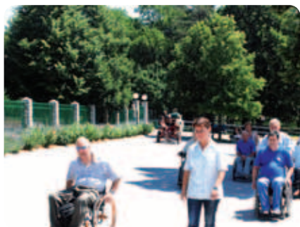
V koloni eden za drugim so si od objekta do objekta ogledali vse, kar je povezano z lipicanci.