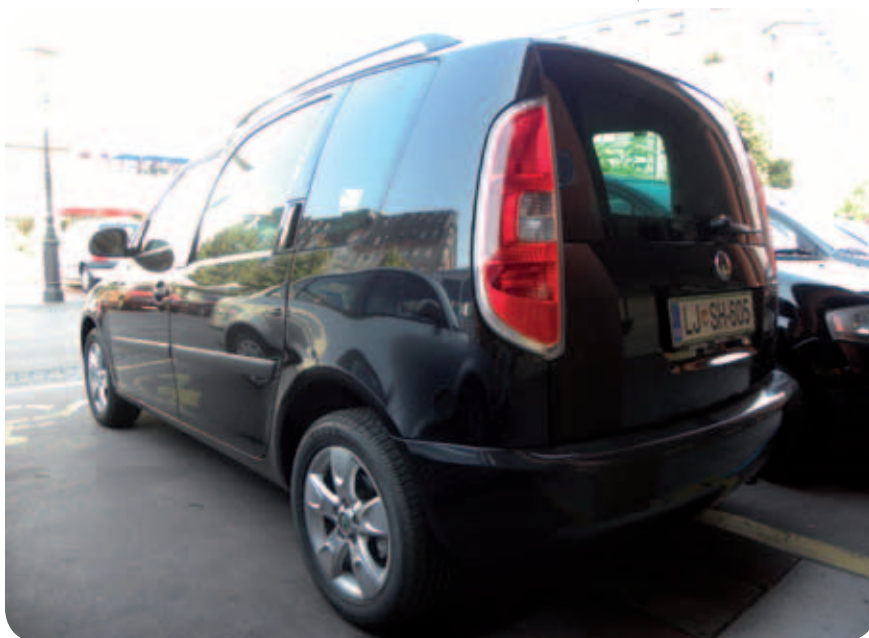
Nova škoda roomster

Teoretični del izpita lahko opravljate v kateri koli avtošoli v Sloveniji. Za praktični del izpita pa smo poskrbeli na Zvezi paraplegikov Slovenije. Kupili