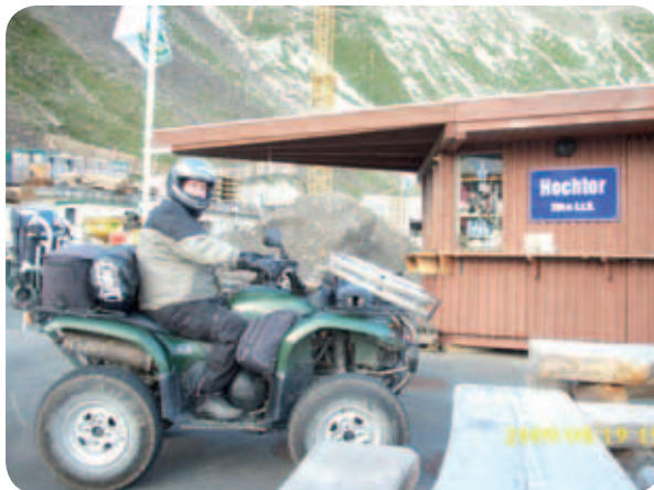
Duki na prelazu Hochtor 2504 m/nm.

Najina dvodnevna avantura je bila končana in potrebovala sva cel dan in še pol zraven, da sva ohladila zadnjo plat, strnila vtise, pregledala slike ... Čedalje bolj prihaja za nama tudi celotna avantura. Dva paraplegika v dveh dneh, 700 prevoženih kilometrov, da višinske razlike sploh ne omenjam. Brez kakršne koli pomoči neinvalidov ali kar koli drugega. Sama s svojim ATV-jema in vso naloženo kramo, ropotijo, hrano, pijačo, invalidskim vozičkom!