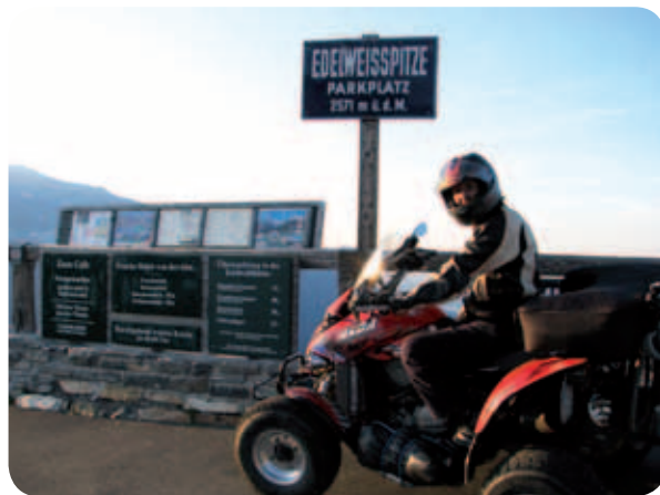
Jaka na Edelweis Spitze 2571 m/nm

Tauern presegla, premaknila, doživela še eno mejo in ponovni sončni zahod. Dolg spust do Bruck an der Grossglocknerstrasse, kjer najdeva prijeten kamp. Ker se po malem že spušča mrak, se namestiva v kampu, spijeva in nazdraviva s pivcem ter premlevava vso pot in lepote visokogorskega sveta. Prevzeta z vsem, kar sva