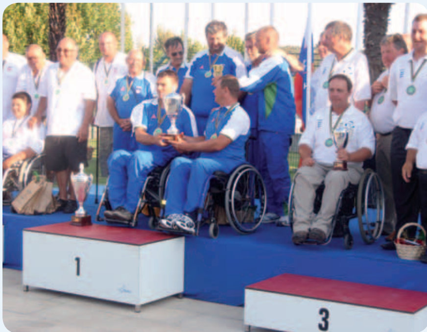
Slovenska reprezentanca ribičev invalidov je že drugič osvojila naslov svetovnih prvakov.

S tem izrednim uspehom so naši ribiči ponovili uspeh iz svetovnega prvenstva, ki je bilo leta 2004 pri nas v Radečah. Prav tako je v