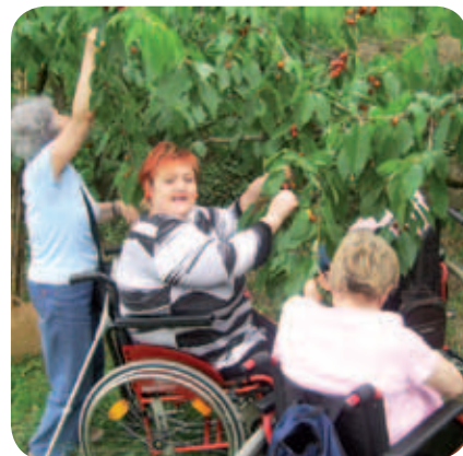
Češnje so obirale kar z vozička.

V sezoni češenj so bile s predstavnicami DP jugozahodne Štajerske in DP Gorenjske v Brjah. V goste jih je povabilo Društvo Norma 7, s katerim že več let na kulturnem področju in raznih delavnicah nadvse