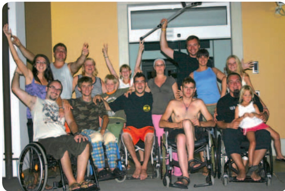
Po vročem dnevu je zvečer prišlo pravo razpoloženje