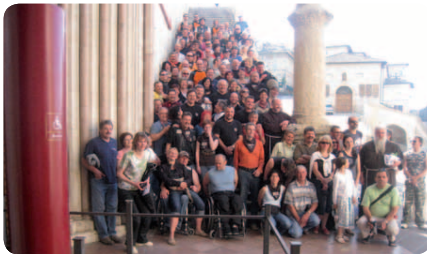
Romanje osemdesetih motoristov iz različnih krajev Slovenije po krajih, kjer je živel in deloval sv. Frančišek Asiški.

To je bila dolga in izredno naporna pot, še posebno za naša dva paraplegika. Idejni vodja tega zanimivega in vsekakor privlačnega potovanja je bil motorist pater Niko. Tridnevno druženje se je začelo z zbiranjem na črpalki v Gonarsu; tam se je pisana družčina motoristk in motoristov razvrstila v štiri potovalne skupine. Vodje skupin in zadnje v koloni so opremili z rumenimi odsevnimi brezrokavniki, vsak udeleženec pa je prejel motoristično rutko. In tako je predskupina s štirikolesnikom, trajkom, motoristoma, press avtom in spremljevalnim kombijem začela tridnevno pot proti Raveni, Ceseni, Perugi s postankom na čudoviti La Verni. Prvi vtisi po 570 km dolgi poti so bili dobri, saj so uživali na gori, kjer je Frančišek dve leti