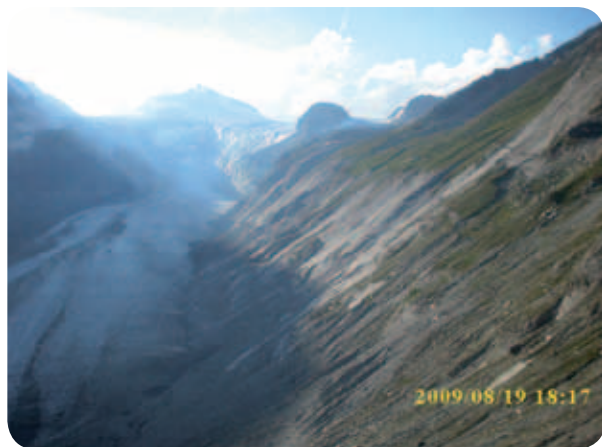
Zahod na ledeniku, ki izginja.

Avantura na Oberentauernu se končuje, ko zapeljeva v nacionalni park Nockberge. Da ne bi bilo kakšnega nesporazuma in da ne bi spet kdo pisal kakšnih dopisov na ZPS, kakšni divjaki smo ATV-motoristi, ki nimamo nobenega spoštovanja do narave, bi pojasnil, da je ob plačilu cestnine za vse avstrijske ceste v nacionalnih parkih vožnja vseh motornih vozil dovoljena in legalna. Invalidi sicer ne plačamo polne cene, imamo pa kar nekaj popusta. Ampak človek z veseljem plača uporabo ceste, saj je ta denar namensko uporabljen za vzdrževanje teh cest, ki so odprte le nekaj