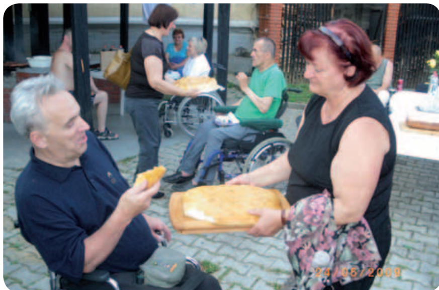
V Beli krajini so nam ob prihodu po starem slovenskem običaju ponudil kruh in sol.

Tudi v Pacugu se niso dolgočasili. Prosti čas so zapolnili z družabnimi igrami, predvsem pa so se veliko kopali, sončili in izmenjavali praktične izkušnje.