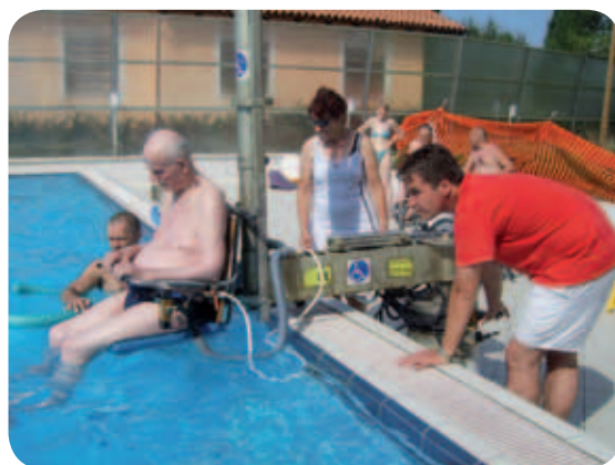
Z dvigalom preprosto v bazen

Poleg kopanja in sončenja v prijetnem mediteranskem okolju pa kopalci izkoristijo dan še za druge aktivnosti. Pri ljubljani so tarok, šah in pikado.