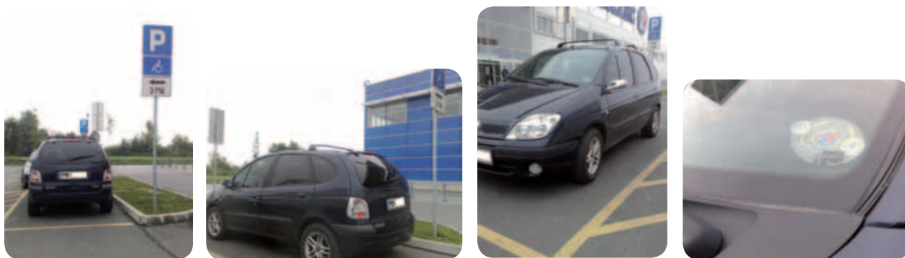
Omenjenega zakona se velikokrat ne držijo prav tisti, ki bi zakon morali najbolj spoštovati, ga čuvati in izvajati. Za primer sem fotografiral avto, parkiran na parkirnem prostoru za invalide, ki je imel na steklu namesto invalidske izkaznice oznako »International Police Association«.