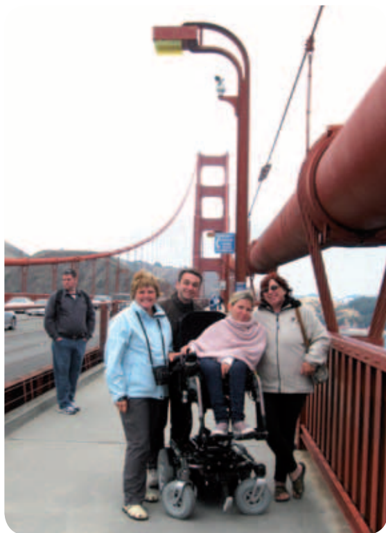
Mi štirje na slavnem simbolu San Franciscu GOLDEN GATE BRIDGE.

Ogledali smo si obračališče slavnih Cable Car (tramvajčkov, ki zmorejo strma pobočja mesta in jih še danes obračajo ročno), nebotičnike, v senci Transamerica Pyramide smo popili ogabno ameriško kavo, opravili prve nakupe v Chinatownu, kitajski četrti, ter se odpravili na obisk k morskim levom, ki že od vekomaj kraljujejo na posebej zanj postavljenih plavajočih splavih pri Pieru 39 na Fishermen's Warfu – ribiškem središču, ki je danes ena glavnih turističnih točk v mestu.