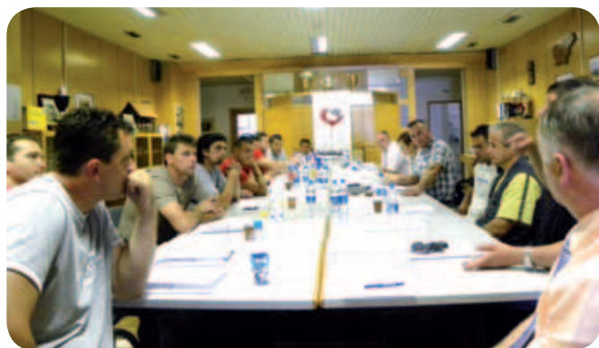
Vodstvo in predstavniki ekip na sestanku ob koncu tekmovanja