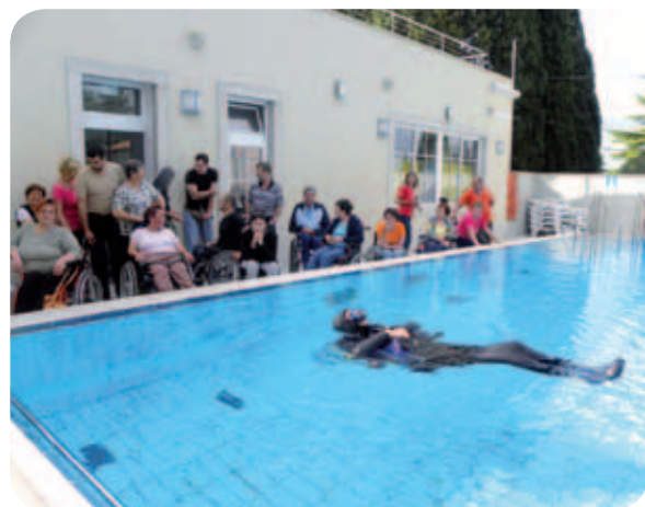
Ja, voda je bila zelo mrzla.