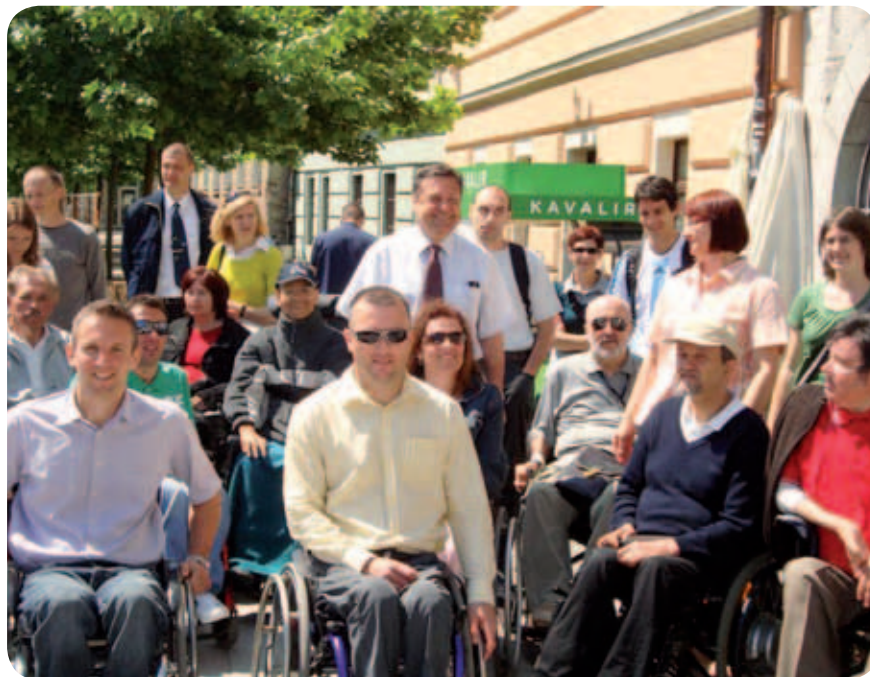
Na Mesarskem mostu je z nami pokramljal župan Zoran Jankovič.

Vozniki namreč lahko nagnejo avtobuse in jih izravnajo z višino pločnika na postajališču. Pri tem je pomembno, da vozilo pripeljejo povsem do roba. In prav tu delajo največ napak. Poleg tega lahko spustijo kovinsko klančino, po kateri potnik na invalidskem vozičku