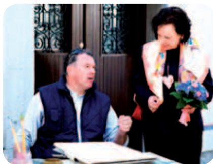
Likovno kolonijo je obiskala častna pokroviteljica projekta soproga predsednika Republike Slovenije gospa Barbara Miklič Türk.

Razstava slik je bila na ogled do 3. junija v telovadnici OŠ Orehek. Na sklepnih prireditvah so nastopali