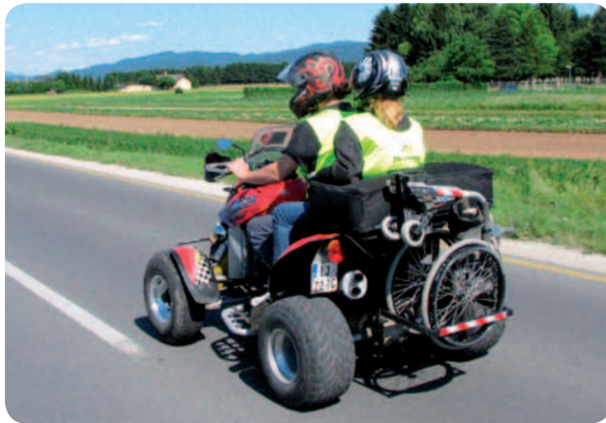
Motoristična potepanja po prelepi Sloveniji

Mnogo motorističnih navdušencev se bo strinjalo z menoj, da so solo potepanja najslajši del motorizma. No, pod motoriste mislim tudi nas in našo ATV-sekcijo. ATV-motoristi smo postali v svetu enoslednih vozil, motorjev, dobro poznani. Precej paraplegikov, ki se udeležujemo motorističnih srečanj, potujemo naokoli itd., je pozitivno presenečenih nad sprejemom v krog motoristov, ki ga doživljamo vsakič, ko se kje pojavimo. V skupini ali solo. To so prijetni občutki, prav tako, kot je prijetno čutiti svobodo, piš vetra pod čelado in pokrajino, ki drvi mimo tebe.