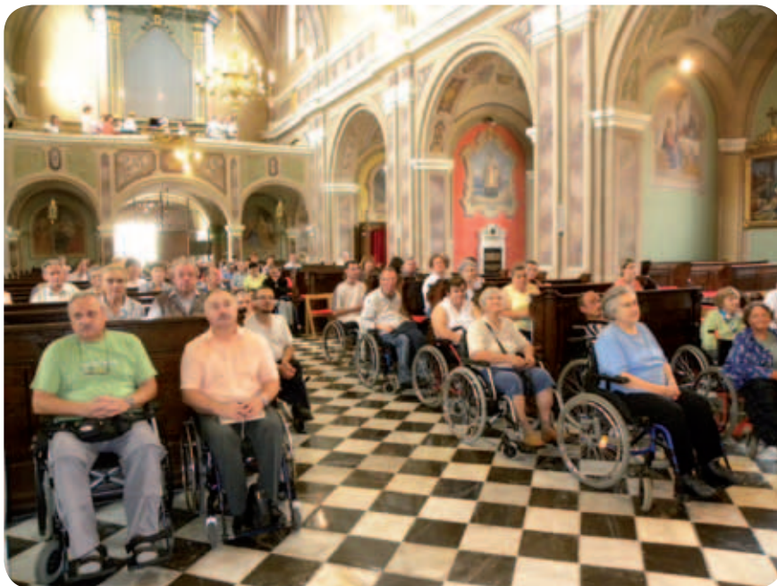
Vseslovensko srečanje paraplegikov in tetraplegikov smo začeli v Petrovčah; tam je v baziliki Matere božje potekala sveta maša.