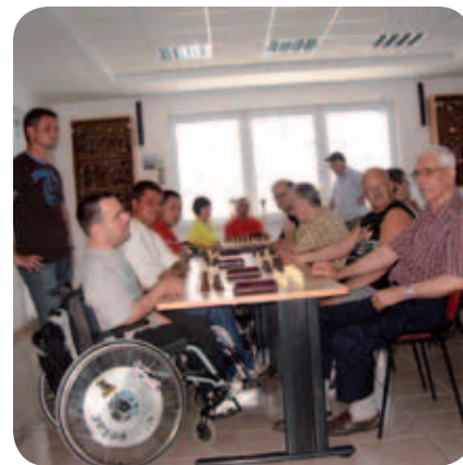
Kljub visoki temperaturi so možgani morali delati.