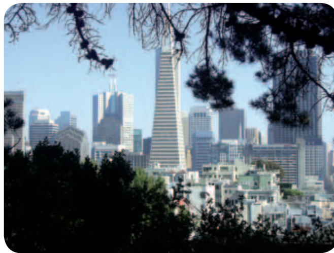
Pogled iz Telegraph Hilla na stolpnice v Downtownu s Transamerica Pyramid v sredini.

Že pri izhodu z letališča se je pokazalo, da je Amerika za invalide izjemno prijazna. Pred vrati je čakalo vsaj 20 taksijev, prilagojenih za prevoz invalidov na vozičkih, in edina skrb, ki sem jo imela, je bila barva taksija (žal rožnatega ni bilo na vo-