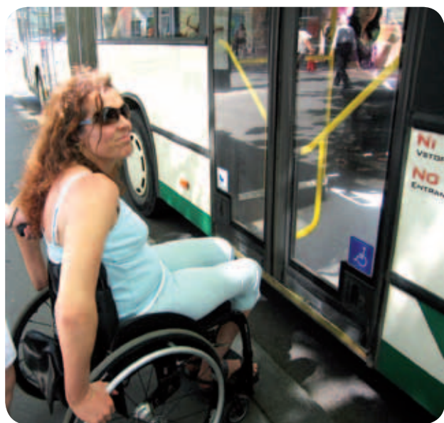
Voznik je videl potnico na vozičku, pa kljub temu ni nagnil avtobusa in zapeljal bliže pločnika.

Pri potepanju po Ljubljani in vožnji z avtobusi so nas spremljale študentke delovne terapije iz Visoke šole za zdravstvo.