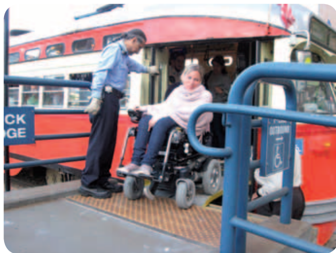
Varen sestop iz tramvaja pod budnim očesom sprevodnika.