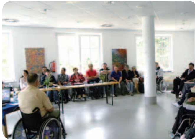
Navzoče je pozdravil predsednik Zveze paraplegikov Slovenije.

Na koncu predavanj so seveda sledila še praktična vprašanja; večina se jih je nanašala na invalidske vozičke, sedežne blazine in pravice iz pokojninskega in invalidskega zavarovanja. Nato je bilo na vrsti