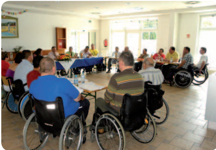
Seja druge redne skupščine Zveze

Delegate je seveda najbolj zanimala prihodnja usoda doma na Pacugu, zato so še posebno z zanimanjem prisluhnili poročilu gradbenega odbora. No, to je bilo zelo spodbudno, saj bomo že jeseni nadaljevali drugo fazo gradnje doma z drugačnim, transparentnejšim načinom. Začela se bo torej gradnja bivalnega objekta in ureditev okolice. Po konstruktivnih razpravah in pripombah so delegati vsa poročila potrdili in sprejeli. Pri