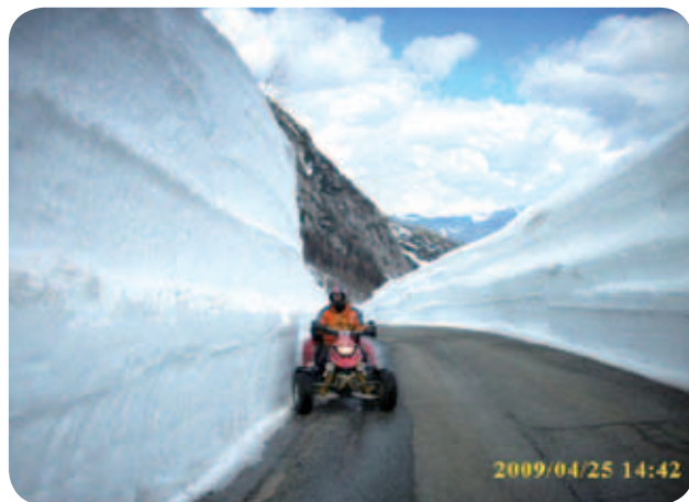
Prelaz na Vršiču: splužena cesta je bila kot vkopana, na obeh straneh pa šestmetrske stene iz snega.

Tudi letos se niso izneverili tradiciji, še več. Prelaz so očistili par dni prej, kljub rekordni snežni odeji.