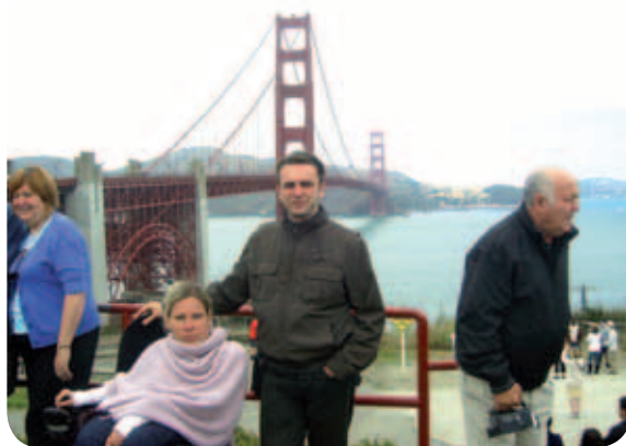
Midva in Golden Gate v ozadju.

Prvi dan nas je novim dogodivščinam naproti posprenilo sonce in ni nas zapustilo celih 12 dni. Ker San Francisco velja za najbolj prilagojeno in invalidom prijazno mesto v ZDA, smo se že doma odločili, da avto prevzamemo šele čez tri dni, ko smo načrtovali pot naprej po Kaliforniji. Tako smo se odpravili na bližnjo avtobusno postajo in precej skeptično (pač izkušnje iz domovine) pričakali prvi avtobus ... In ta je bil, kot vsi tam, prilagojen. Že takoj, ko smo stopili iz avtobusa in se ozrli okrog, smo bili pečeni. Zaljubili smo se na prvi pogled, a ne v kakšno ameriško lepoticco ali lepota, da ne bo pomote, ampak v mesto samo. Takoj nam je zlezlo v srce in mislim, da je bilo vsaj meni že prvi dan jasno, da avta sploh ne bomo potrebovali. Prvi dan smo posvetili raziskovanju centra San Francisca in kmalu smo ugotovili, da mesto lahko v resnici prehodiš oziroma jaz prevozim.