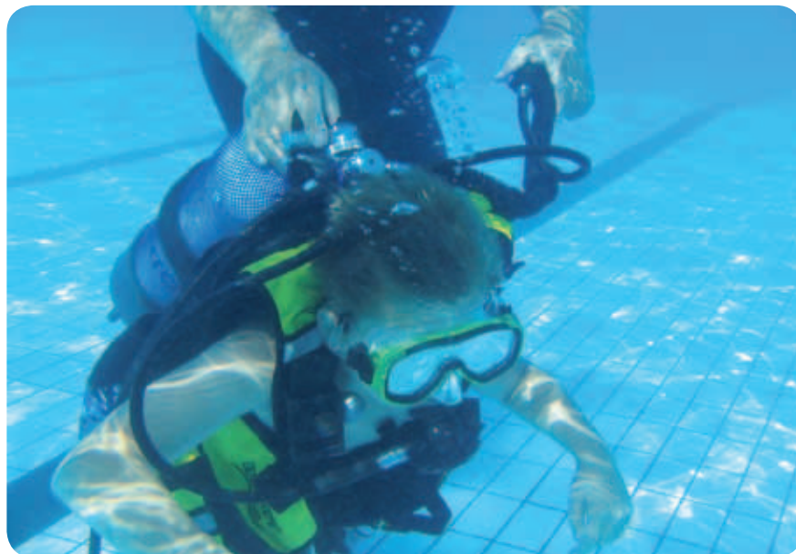
Najmlajši član spet pod vodo.

plegikov Slovenije in Plavalni klub Slovenske Konjice, ob pomoči Mesta Slovenske Konjice in Javnega komunalnega podjetja Slovenske Konjice. Projekt je sofinanciral Zavod za zdravstveno zavarovanje Slovenije, kot donator pa je materialno priskočilo na pomoč podjetje Engrotuš iz Celja.