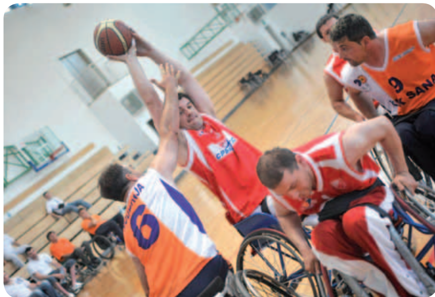
Igralce je z dresi opremila Nova Ljubljanska banka.

Na delovnem sestanku so sprejeli in potrdili okvirno finančno poročilo in predlog o višini kotizacije za prihodnjo sezono. Po pobudah so sprejeli še pravilnik lige ter določili vrstni red, po katerem