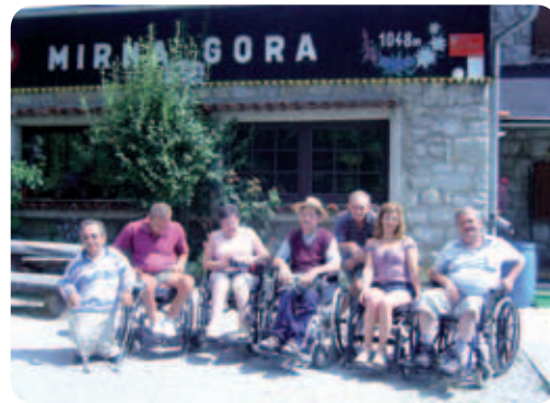
Zadnji dan smo izkoristili za izlet na Mirno goro, ki leži v vzhodnem delu Kočevskega roga.

Po dvajsetih minutah vožnje smo prispeli do tamkajšnjega planinske-