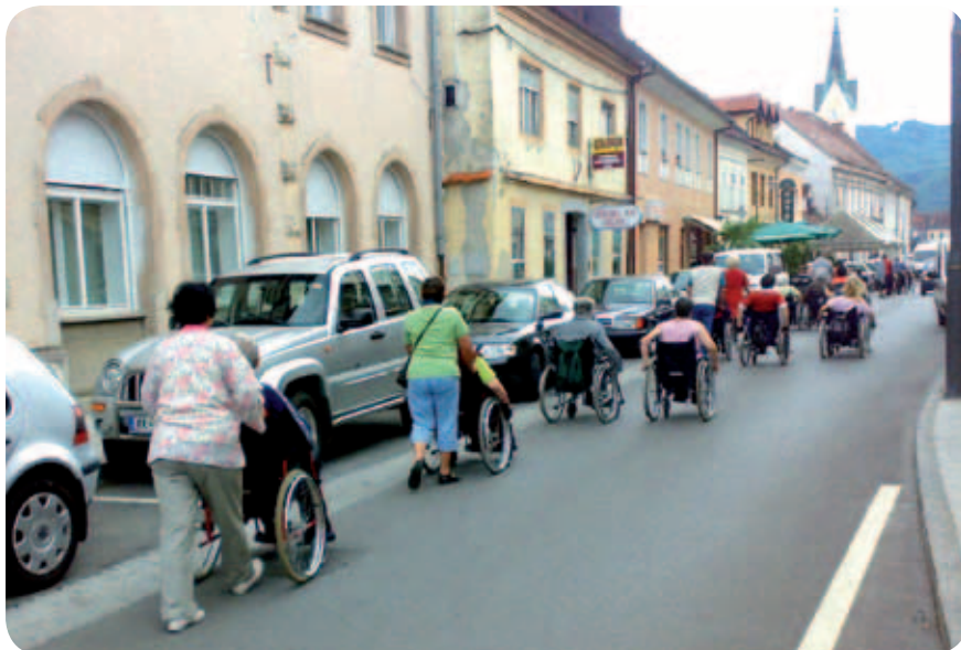
Sprehod po Brežicah in ogled kulturnih znamenitosti

Znano je, da so fašistične sile med drugo svetovno vojno s preselitvijo prebivalcev v Šlezijo in drugod po Nemčiji nameravale razdeliti slovenski teritorij med nemško in italijansko prevlado. Tako bi bili