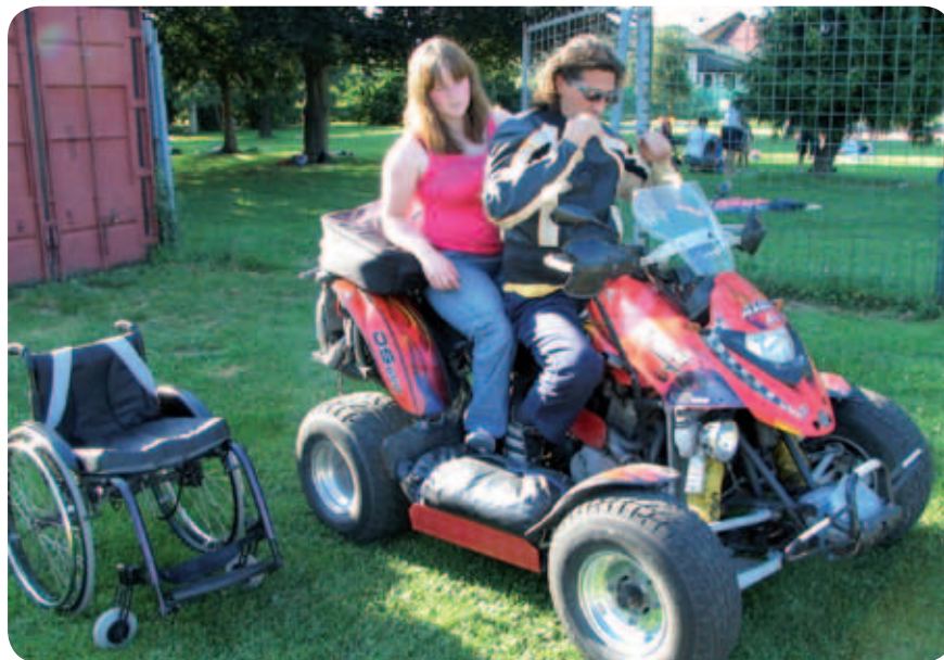
Na poskusno vožnjo.

Prisotni smo se preizkusili v potapljanju, vožnji s podvodnim skuterjem, vožnji s štirikolesniki in kolesi. Nekateri so prvič po poškodbi sedli za volan avtomobila. Tisti, ki jih vse to ni preveč zanimalo, pa so