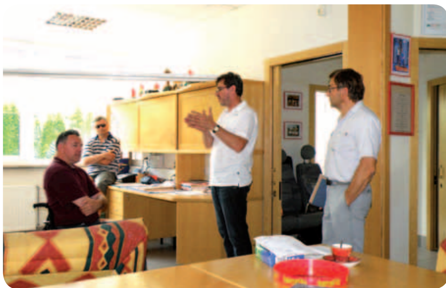
Ob trideseti obletnici ustanovitve Društva paraplegikov Gorenjske smo se odločili, da prenovimo društvene prostore.

Po temeljitem čiščenju so prostori zadihali s posebno svežino in dali uporabnikom še večji zagon za