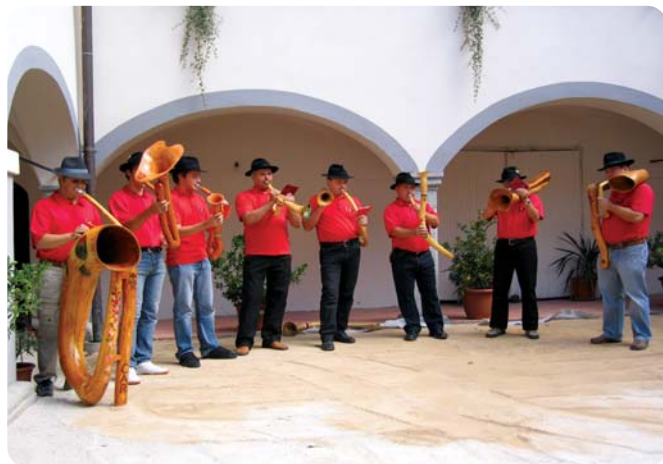
Moravske rogiste je treba videti in doživeti

Društvo paraplegikov ljubljanske pokrajine ima skoraj eno tretjino vseh članov, ki so včlanjeni v pokrajinska društva ZPS. Zato ima tudi veliko članov, ki živijo na robu življenjskega minimuma. Seveda želimo tem članom pomagati, toda skromna denarna pomoč, ki jo lahko po svojih možnostih daje društvo, ni dovolj za rešitev njihovih težav. To je le majhen obliž za rešitev trenutnih stisk, v katerih se vse pre pogosto znajdejo.