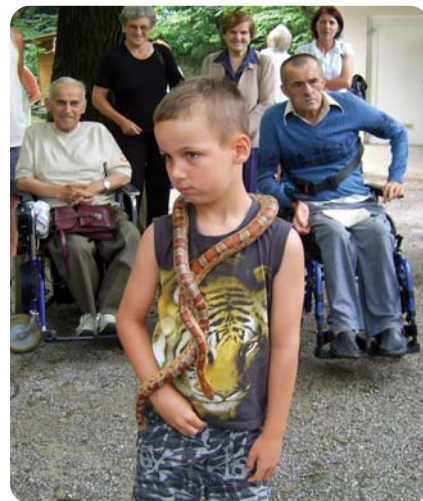
Otroci pred kačami nimajo strahu

Po ogledu smo so napotili v tri kilometre oddaljen Mostec, prijetno zbirališče Ljubljančanov, ki se v po-