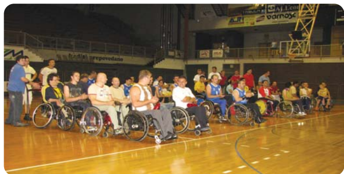
Ekipe na otvoritvi turnirja v športni dvorani Tabor v Mariboru.

Da bi invalidi paraplegiki ohranjali psihofizične sposobnosti, ki so nam ostale po nastanku invalidnosti, je nujno, da se ukvarjamo tudi s športno rekreacijo. Tako je pred leti tudi v Društvu paraplegikov severne Štajerske dozorela ideja o ustanovitvi košarkarske sekcije. Tudi v našem društvu je zaživela košarka na invalidskih vozičkih, ki je med paraplegiki v svetu vse bolj priljubljena. Pred leti so naši člani zavrteli kolesa vozičkov in prvi »koraki« invalidov na vozičkih na košarkarskem parketu so se odvrtili.