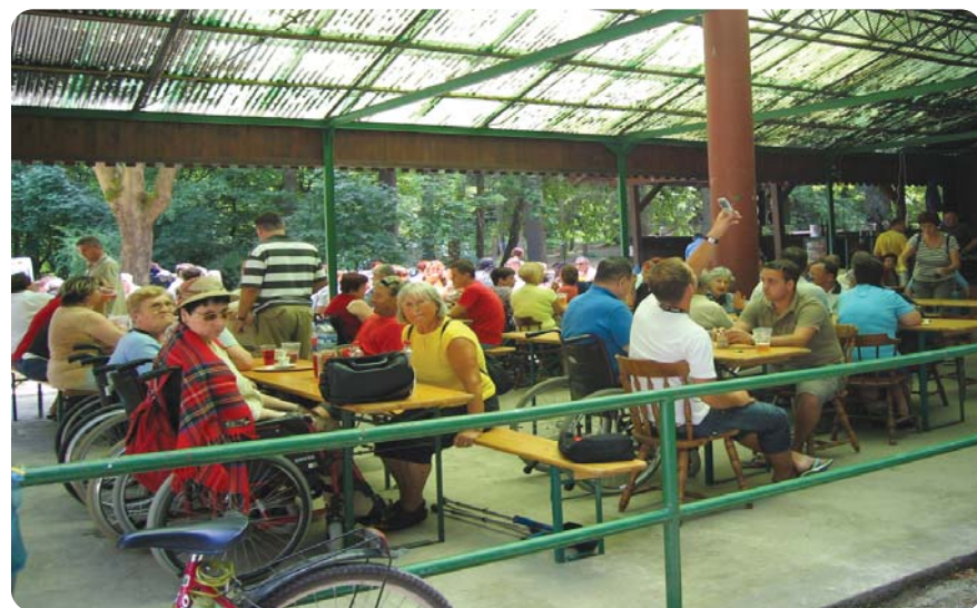
Prijetno druženje v Mostecu pod Rožnikom