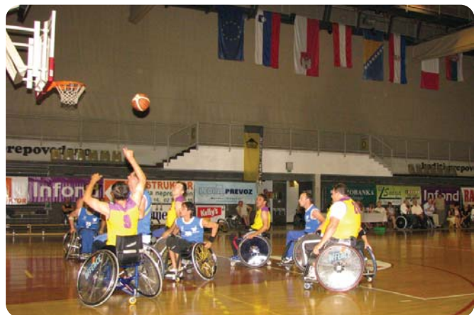
Turnir je uspel v tekmovalnem in organizacijskem smislu.

Deseti meddržavni turnir v košarki na invalidskih vozičkih, ki ga je pripravilo in izvedlo Društvo paraplegikov severne Štajerske, se je odvijal 28. in 29. 6. 2008 v športni dvorani Tabor v Mariboru. Turnir je bil posvečen dnevu državnosti Republike Slovenije in je potekal tudi za pokal v okviru skupnosti ALPE-JADRAN, zato je imenovan PARABASKET ALPE-JADRAN 2008. Na turnirju so ob domači ekipi iz Maribora sodelovale ekipe iz