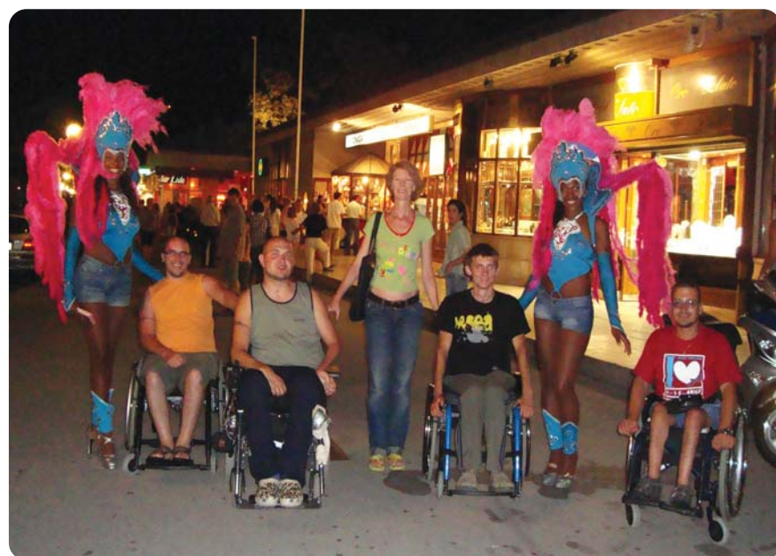
Večer v Portorožu ob lepih dekletih