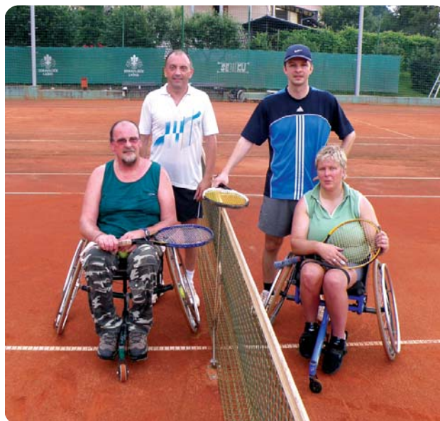
Finalisti turnirja na igrišču v Marija Gradcu pri Laškem.