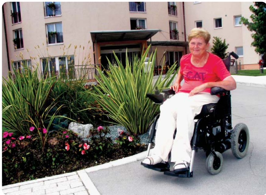
V lepem domskem okolju

obupamo, tudi če je na začetku zadeva videti neznosna?