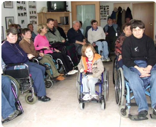
Del udeležencev letošnjega Občnega zbora

Že v prejšnji številki glasila Paraplegik smo poročali o pripravah na občni zbor društva ter volilno skupščino Zveze paraplegikov. Oba organa sta v tem času že zasedala. Na občnem zboru društva so člani dobili veliko informacij o delu v preteklem letu in načrtih za letošnje leto. Tako je bilo