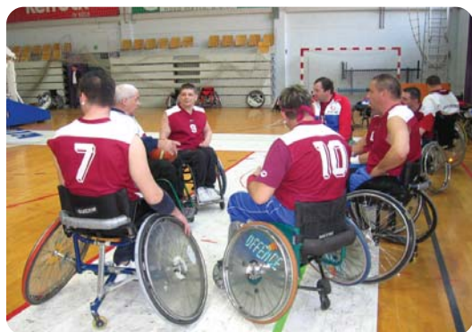
Zadnji dogovori pred nadaljevanjem tekme