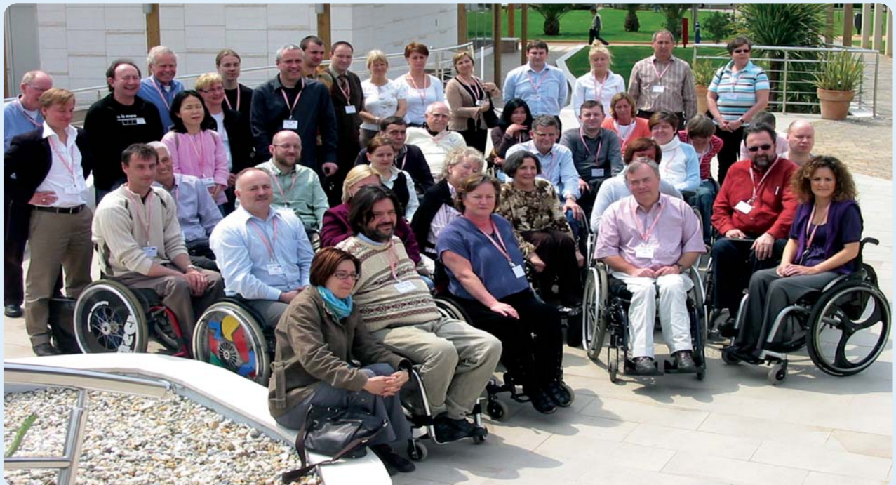
Udeleženci kongresa Evropske zveze paraplegikov ESCIF na Hrvaškem

Letošnji kongres je organizirala hrvaška Zveza paraplegikov HTUP na temo paraplegija in tetraplegija ter spremljajoče staranje.