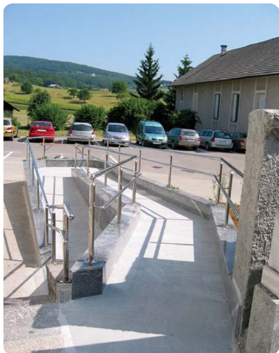
Primerno urejen dostop do pokopališča in cerkve sv. Vida v Šentvidu pri Stični.