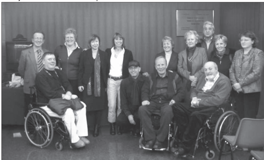
Na predstavitvi filma so bili poleg akterjev in ustvarjalcev filma prisotni vsi pomembni slovenski mediji, pomembni zamejski Slovenci in vodstvo RAI v Trstu.