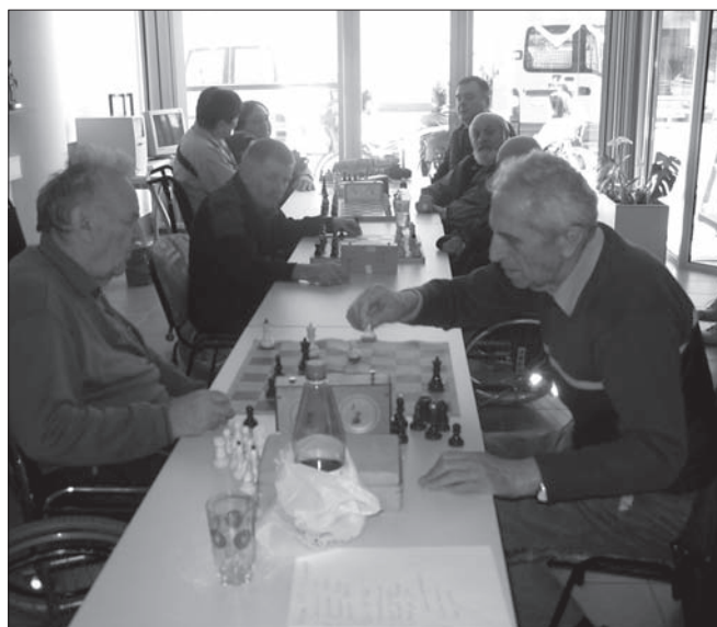
Ob šahovski igri in druženju smo se pogovarjali o velikih in majhnih stvareh.

Srečanje je bilo organizirano prvič, vendar gotovo ne zadnjič. Naše društvo bo srečanje vrnilo v septembru. Tudi drugim priporočamo podobno snidenje.