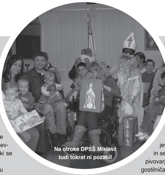
Na otroke DPSŠ Miklavž tudi tokrat ni pozabil

Sveti Miklavž je oblečen po vzgledu liturgičnih oblačil: čez dolgo belo obleko (albo) obleče mašni ali večernični plašč (pluvial). Na glavi nosi mitro; to pokrivalo je za Miklavža pač najznačilnejši del - tako v odevnem kot simbolnem pomenu. V roki drži škofovsko palico, ki je zgoraj zavita, okrašena, v drugi roki pa ima, a ne vedno, knjigo. V njej piše z zlatimi črkami, kaj so počeli pridni otroci, in s črnimi, kaj so uganjali nepridipravi. Po izročilu mora imeti dolgo belo brado.