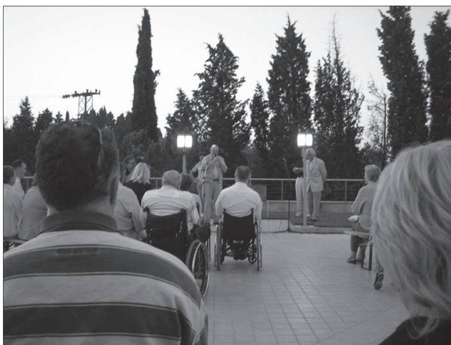
Duhovna hrana je odlična na terasi