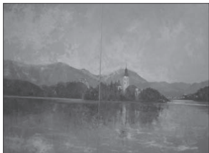
Slika Bled izstopa po velikosti 2X1.5 m in je zato narejena iz dveh delov.

Najprej se je v njemu prebudila pesniška žilica. To je bilo v času bivanja v domu starejših občanov in takrat sta izšli lepi pesniški zbirki Ritem srca in Zlate perutnice. Na njegovo pobudo je nato izšla še zanimiva pesniška zbirka štirih pesnikov Zveze paraplegikov »Most na drugi breg«. Ta zbirka je prevedena tudi v nemški jezik.