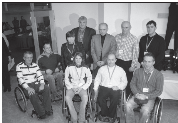
Ni kaj res premikamo meje