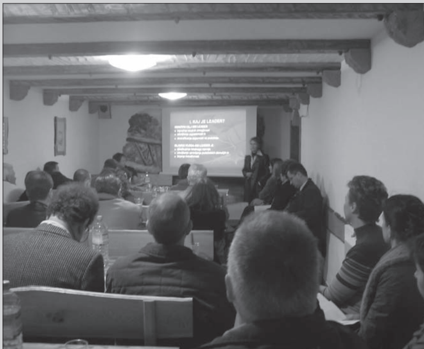
Okrogle mize se je udeležilo veliko število udeležencev predstavnikov različnih društev in združenj, invalidskih organizacij, kmetov, institucij ter drugih akterjev, ki aktivno delujejo na podeželju in turizmu.