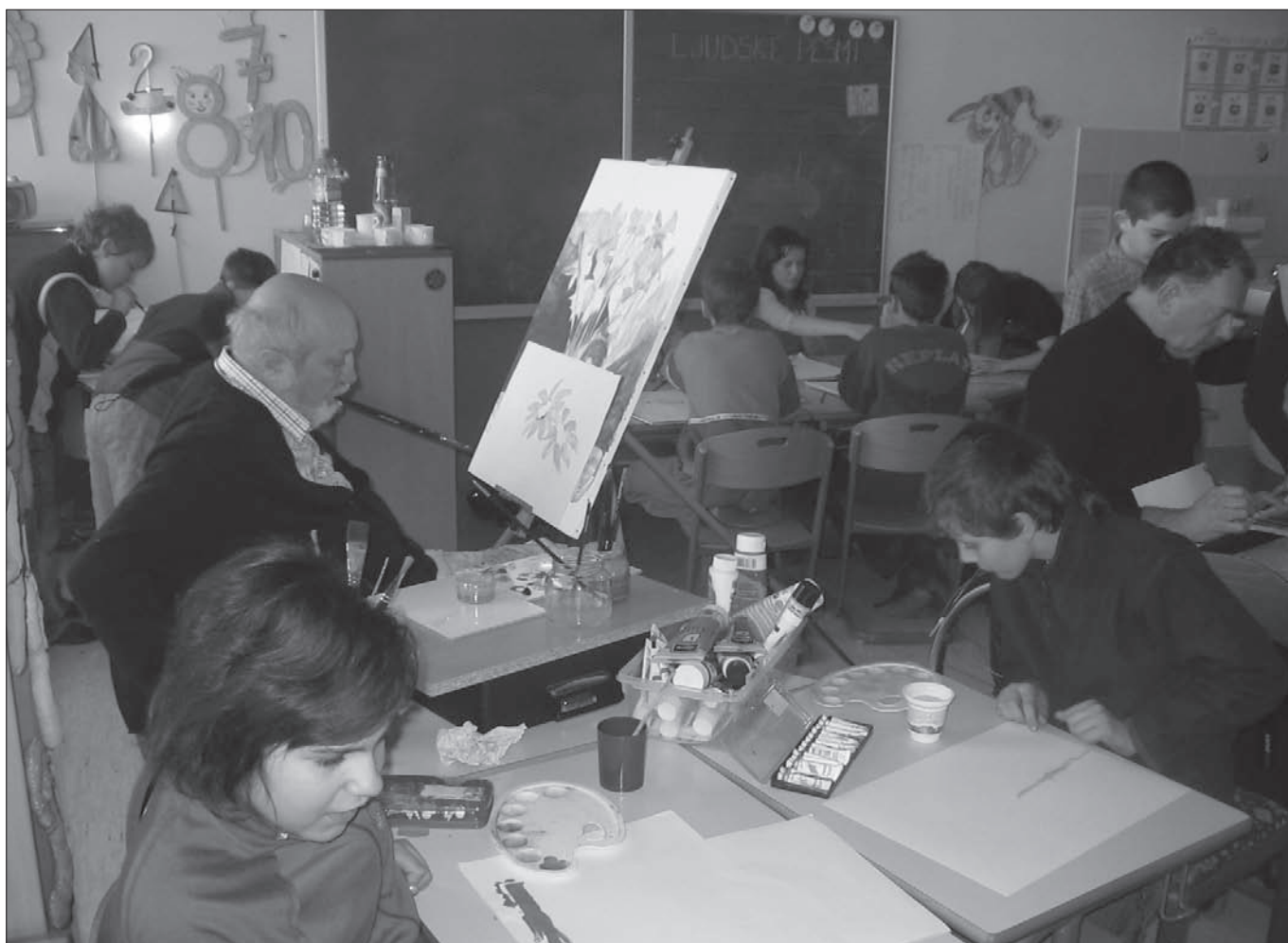
Preko slikanja z usti in s pogovorom o socialnih posebnostih invalidov, smo navezali z osnovnošolci pristen stik, ki v bodoče zagotavlja boljše sprejemanje drugačnosti invalidov.

Skozi pogovor s profesorji v zbornici smo osvetlili možnosti kreativnega izobraževanja, ki ga takšna naša srečanja prinašajo med mlade osnovnošolce. Vsi smo se strinjali, da je