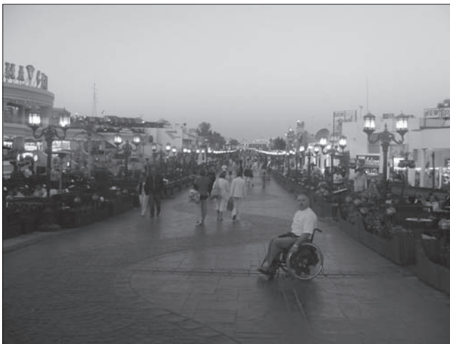
Edina ulica brez ovir

V samem Kairu si je vredno ogledati Citadelo z mošejo Mohameda Alija in