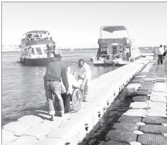
Čez morje do koral