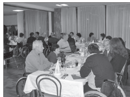
Mize smo pridno oblegali in klepeta ni manjkalo

Motil bi se vsakdo, ki bi trdil, da družabnost in zabava nista težko opravilo. Dokaz temu so bile osamljene mize in sem ter tja skupinice vztrajnih kaveljcev, ki so poskusili dočakati jutranji svit. Kdo ve, če jim je to uspelo?