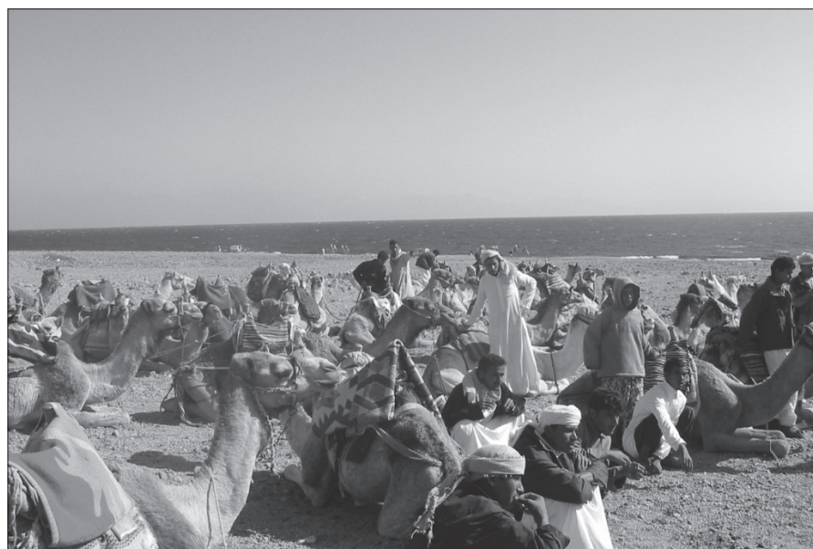
Čakajoč na delo

nem puščavskem terenu je dalo pristen stik tudi s samo naravo. Opazili smo jato štokrelj, ki se je že pripravljala za odhod v naše kraje.