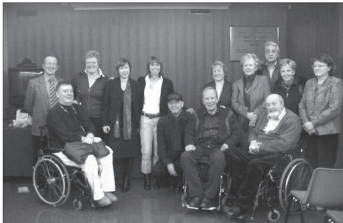
Na predstavitvi filma so bili poleg akterjev in ustvarjalcev filma prisotni vsi pomembni slovenski mediji, pomembni zamejski Slovenci in vodstvo RAI v Trstu.

Na predstavitvi filma so bili prisotni vsi pomembni slovenski mediji, pomembni zamejski Slovenci in vodstvo RAI. Film