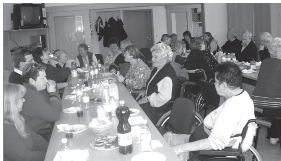
Prijeten klepet, malo zabave in dan je minil