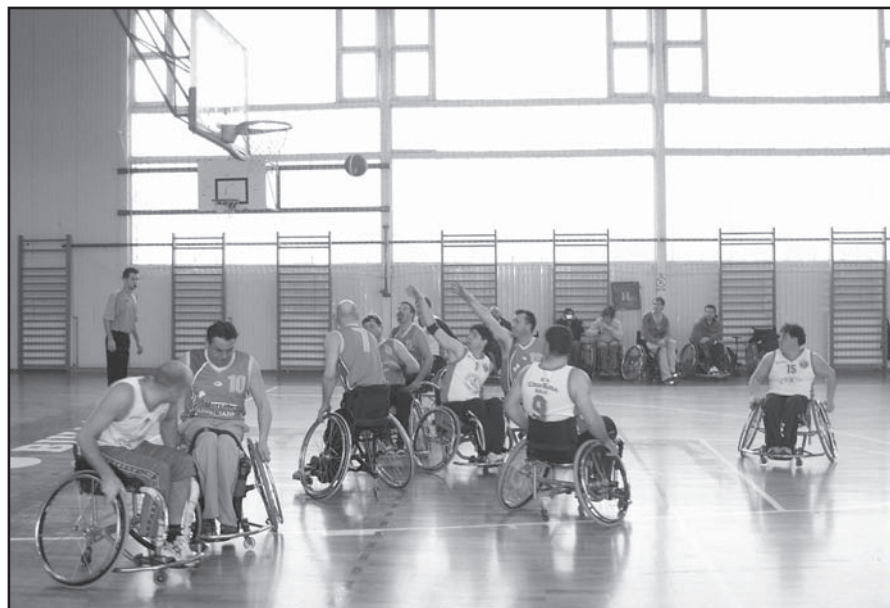
Košarkarji KSI Sana so bili boljši in suvereno dobili obe tekmi.

Naša reprezentanca je na gostovanje v Bihač potovala z društvenim kombijem in enim osebnim vozilom. Bosanski paraplegiki pa so se izkazali tudi kot dobri gostitelji.