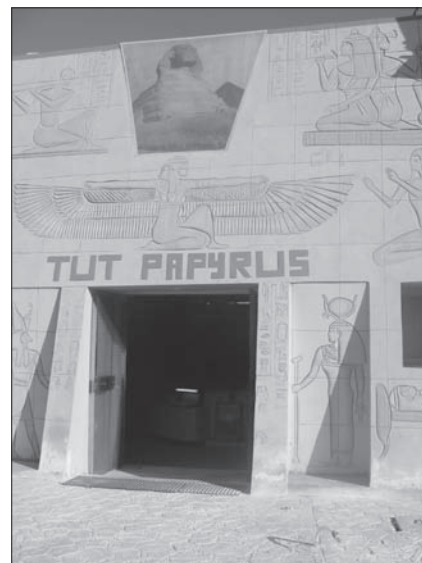
Vhod v svetišče

morju v eni izmed sosednjih držav, kot je stalo moje celotno popotovanje. Morda je ovira za koga, ker moraš na takih potovanjih imeti obvezno spremljevalca, saj so različne ovire in stvari nepredvidljive.