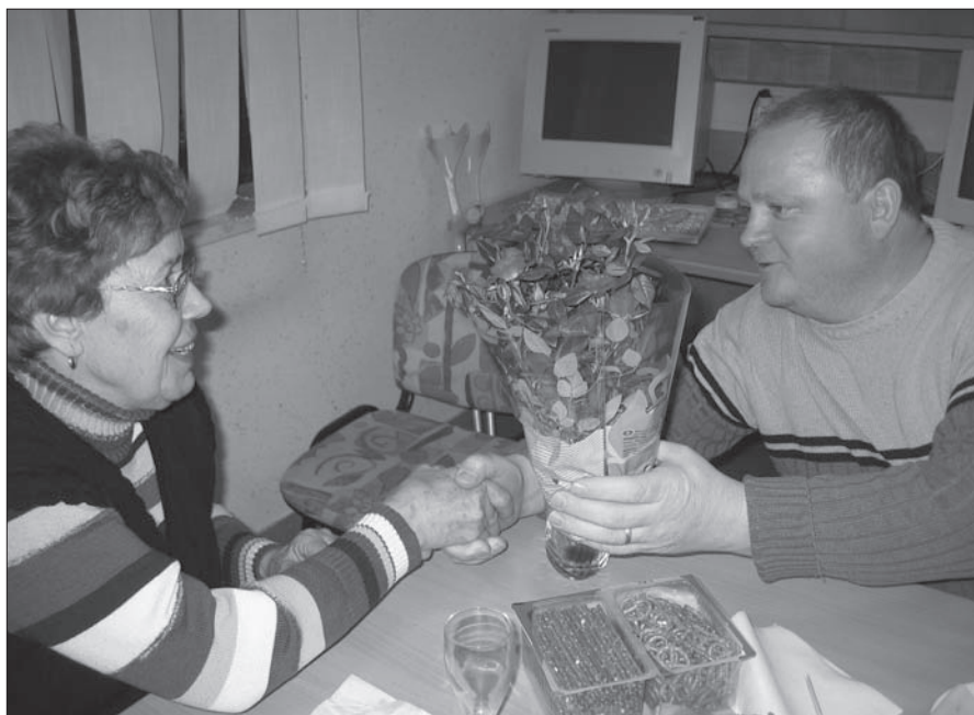
Voščilo in vrtnice so darilo društva, poljubi pa od podpredsednika