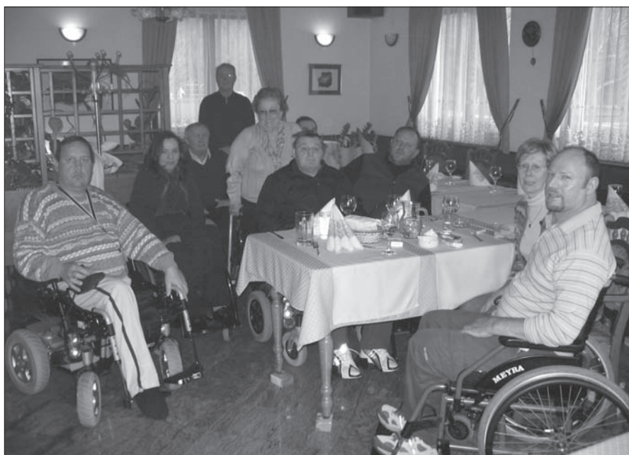
Na srečanju se članice in člani, ki bivajo po domovih prijetno razvedrijo.