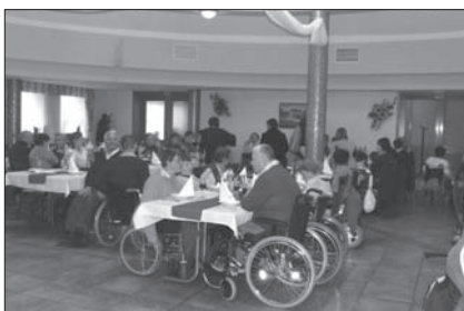
Prednovoletno srečanje, kot običajno dobra udeležba (na sliki le del prisotnih)

v društvu, zato že potekajo priprave na volitve. Članom in članicam smo poslali vprašalnik, s katerim želimo pridobiti predloge za novega predsednika in podpredsednika ter člane organov društva. Člani lahko tudi prijavijo svojo kandidacijo za katerokoli delo ali funkcijo v društvu. V novem mandatu bi želeli vpeljati v delo društva čim več mlajših članov in članic.