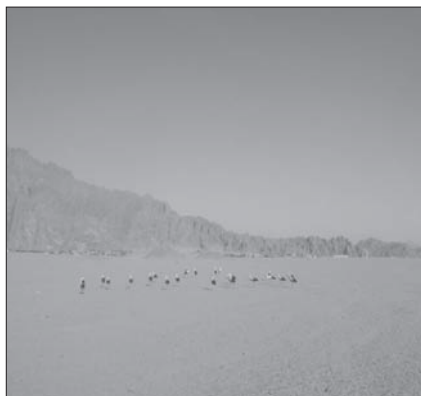
Kje so žabe se sprašujejo štokrlje

Še bolj doživeta je bila vožnja po puščavi