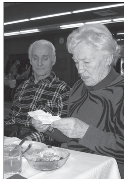
Le kaj se skriva pod to številko ???