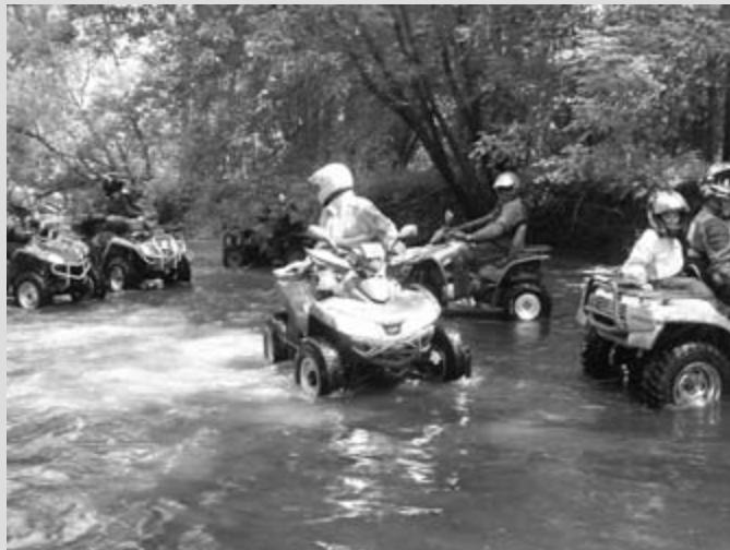
Našim konjičkom ne pride do živega niti voda

Dobro, pa gremo. Ljutomera pa ni in ni. Ko se končno prikaže, mi