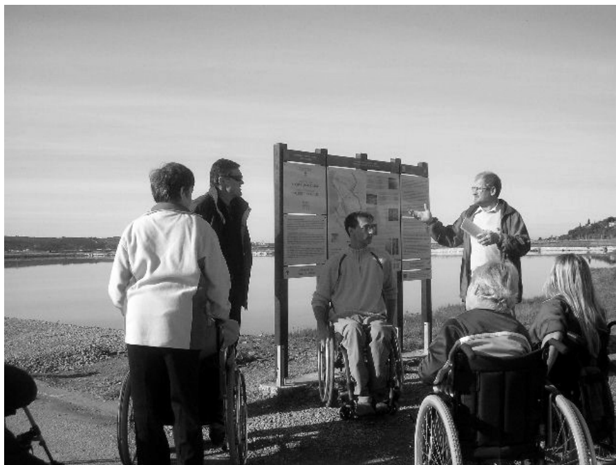
Ogledali smo si sečoveljske soline in prisluhnili razlagi o nastajanju soli

Zaradi slabšega vremena je v sredo žal odpadel izlet v Piran, vendar se udeleženci niso prepustili slabi volji, temveč so si dan popestrili z igrami, razgovori in s krajšim obiskom pokritega bazena v bližnjem hotelu. V četrtek je bil dopoldne izveden skupni izlet v Sečoveljske soline in ogled