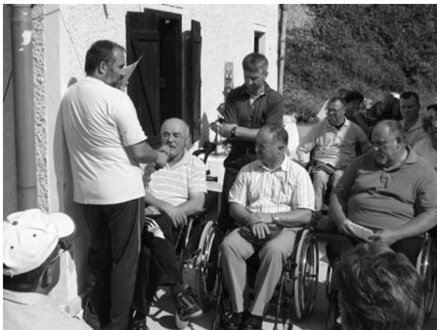
V retoričnih sposobnostih smo se kar dobro odrezali