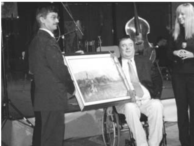
Ministrstvu za delo, družino in socialne zadeve v spomin na pokroviteljstvo velike mednarodne razstave

pri amaterjih kot pri strokovnjakih in tudi likovnih kritikih, ki njihova dela ocenjujejo.