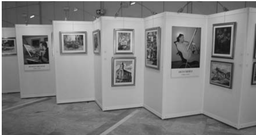
Na razstavi je bilo več kot 160 likovnih del z vsega sveta.

Razstava se je v razširjeni obliki kasneje selila v Cankarjev dom