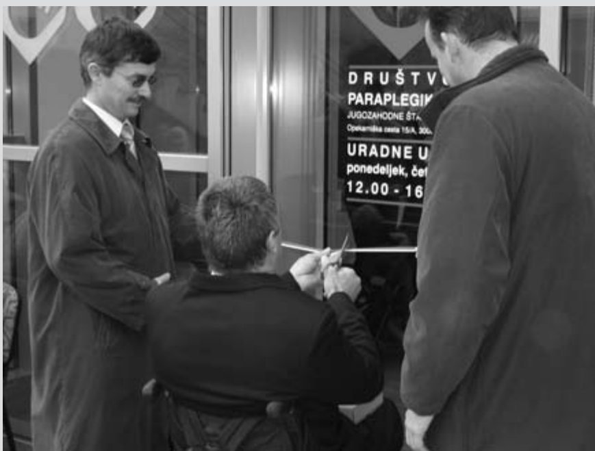
Dosegli smo cilj - trak je padel

Vsi vemo kako pomembno je imeti prostore kjer lahko potekajo aktivnosti, ki nas združujejo. Včasih bolj pomembne, včasih pa zgolj družabnega značaja. Brezkompromisno smo jih veseli. In tako smo veseli, da smo v Celju 3.decembra 2006 bili prisotni na odprtju novih delovno bivalnih prostorov Društva paraplegikov jugozahodne Štajerske.