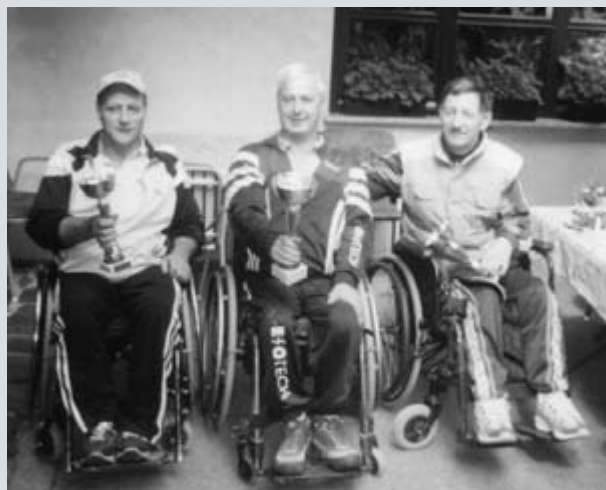
Mi trije smo najboljši par