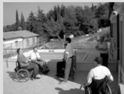
Razložili smo mu pomen plavanja za naše člane in mu razkazali bazen