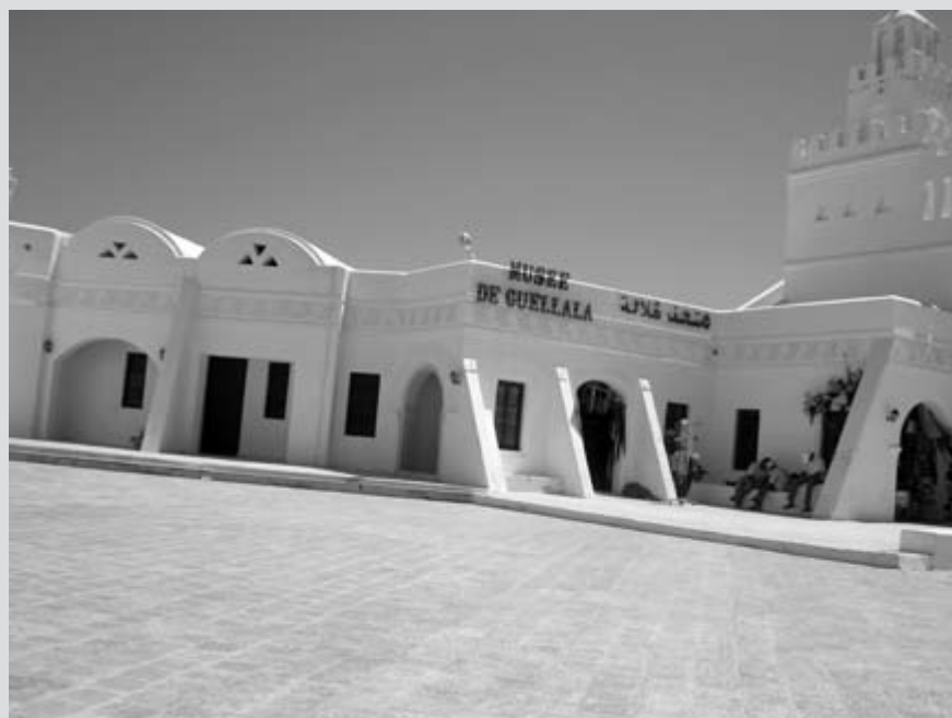
Muzej v Guellali