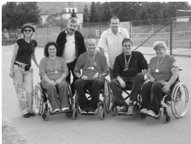
Na spominskem tekmovanju so nastopili tudi atleti iz Hrvaške.