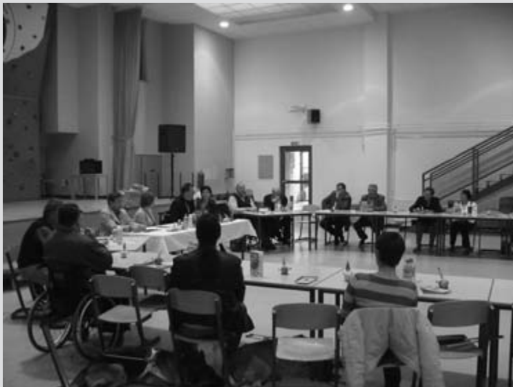
Okrogla miza na temo »Invalidnost in vključevanje invalidov v normalno življenjsko okolje«