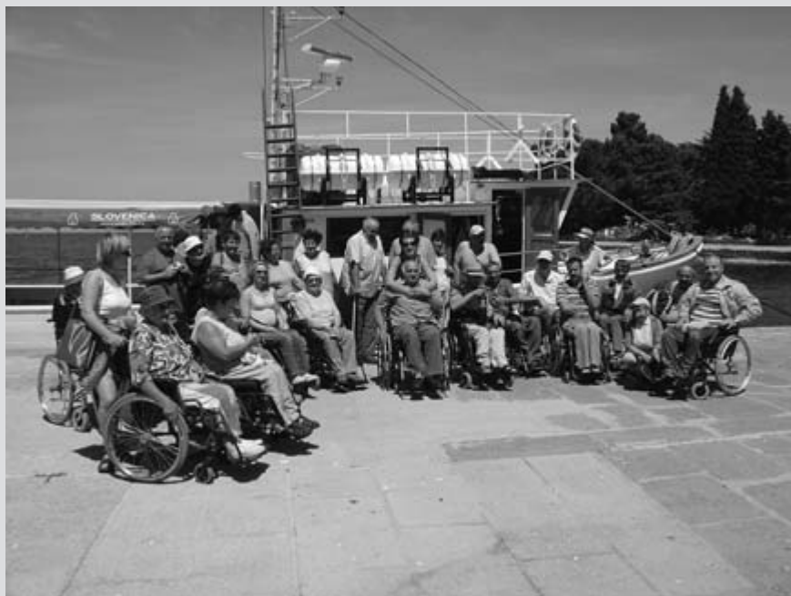
Barčica po morju plava...mi pa pred njo sicer ne plavamo, se pa smejimo v objektiv