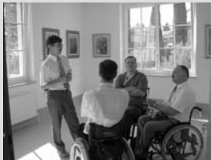
Prisluhnil je tudi našim zamislim

sledično tudi slovenska vlada. Kot ugotavljam, v tem mandatu ni bilo kakšnega resnejšega sodelovanja. Morda tudi zaradi spleta okoliščin, ki je bil na podlagi insinucij in bujne domišljije posameznikov uperjen proti Zvezi paraplegikov.