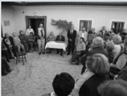
S Kamniškimi koledniki na dvorišču Menačnkove domačije