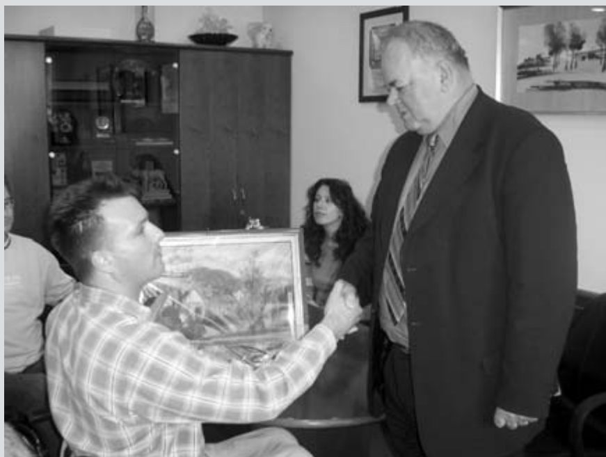
Hvala za dolgoletno, plodno in nadvse prijetno sodelovanje

V Društvo paraplegikov ljubljanske pokrajine so številne aktivnosti potekale tudi poleti in jeseni. No, poleti, ko so dopusti in še huda vročina povrhu, nekoliko manj, zato pa jeseni, ko se začne vadba na športno rekreativnem področju, toliko več. Ker je zaradi bolezni urednika glasila Paraplegik izostala septembrska številka, so dogodki nekoliko zastareli, vendar upamo, da boste prispevke kljub temu prebrali.