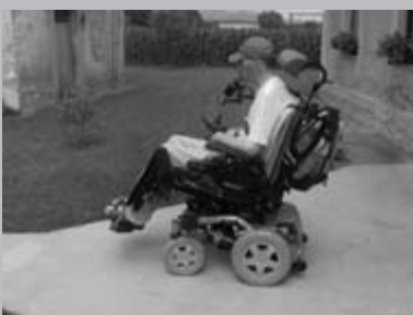
Jaz na svojem novem vozičku