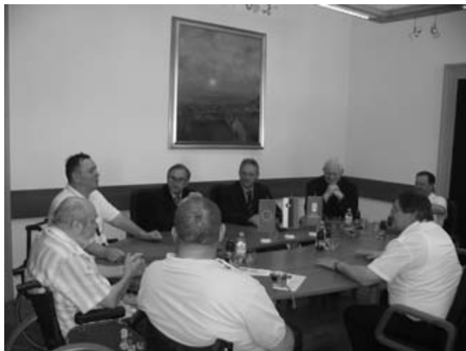
Srečanje je potekalo v sproščenem vzdušju

Društvo paraplegikov Istre in Krasi je v okviru projekta Intereg IIIA Srečanje kulture in turizma, kjer sodeluje kot partner z 17 obmejnimi občinami, v sodelovanju z Gozdnim gospodarstvom Postojna, Občino Postojna in Občino Loška dolina 30. junija 2006 pripravilo srečanje in ogled Notranjske za italijanske in slovenske predstavnike lokalne oblasti.