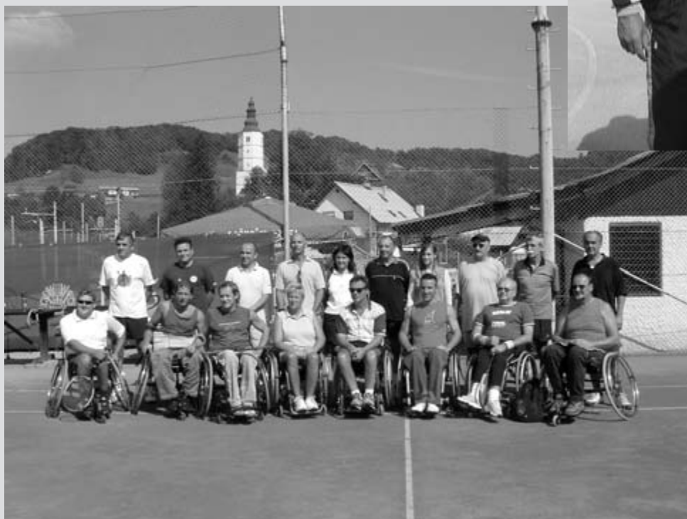
Tudi tenisači smo dobri gasilci- ena »gasilska«

Nobena pozornost, pa naj še bo tako drobna, ni zaman.