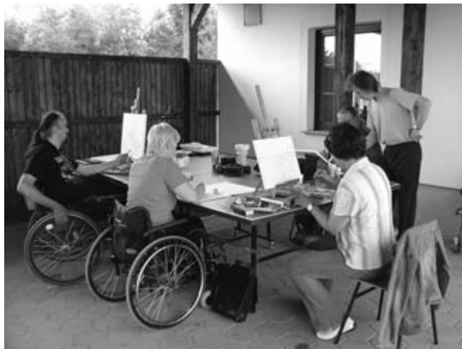
Likovno izobraževanje pod vodstvom mentorja

Od 12. do 18. junija smo v Murski Soboti gostili slikarje Zveze paraplegikov Slovenije.