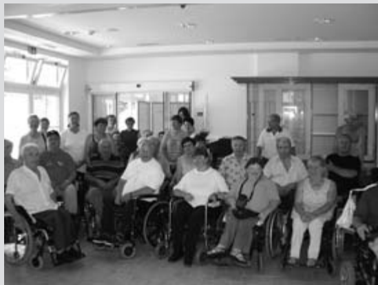
Po obrazih sodeč so bili vsi zadovoljni

V prvi polovici julija je Društvo paraplegikov Dolenjske, Bele krajine in Posavja organiziralo enodnevni izlet na Pacug, da si člani društva in njihovi svojci ogledajo novozgrajeni počitniški dom za paraplegike.