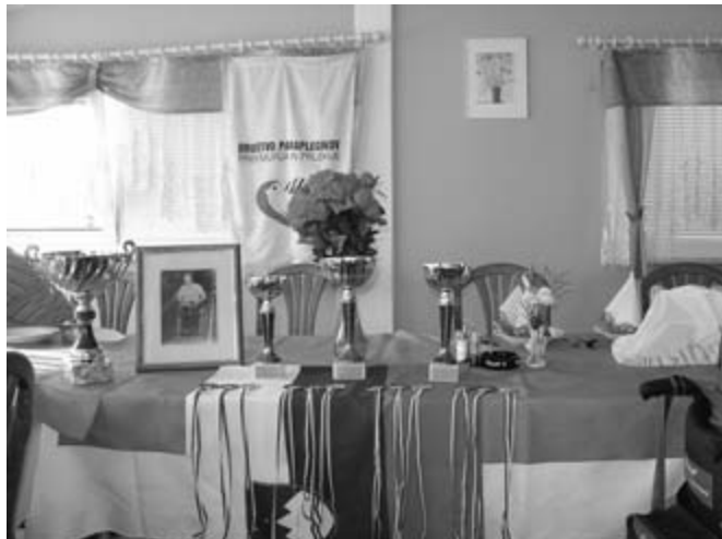
Žlahtno svetlikanje prisluženih pokalov