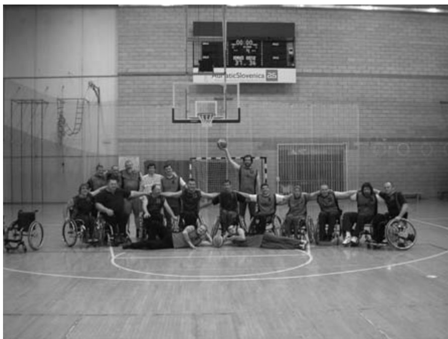
Razmigali smo celo telo, ne samo vsebino glave

V lepem starem Linhartovem mestu Radovljici so izvedli enodnevno slikarsko kolonijo skoraj