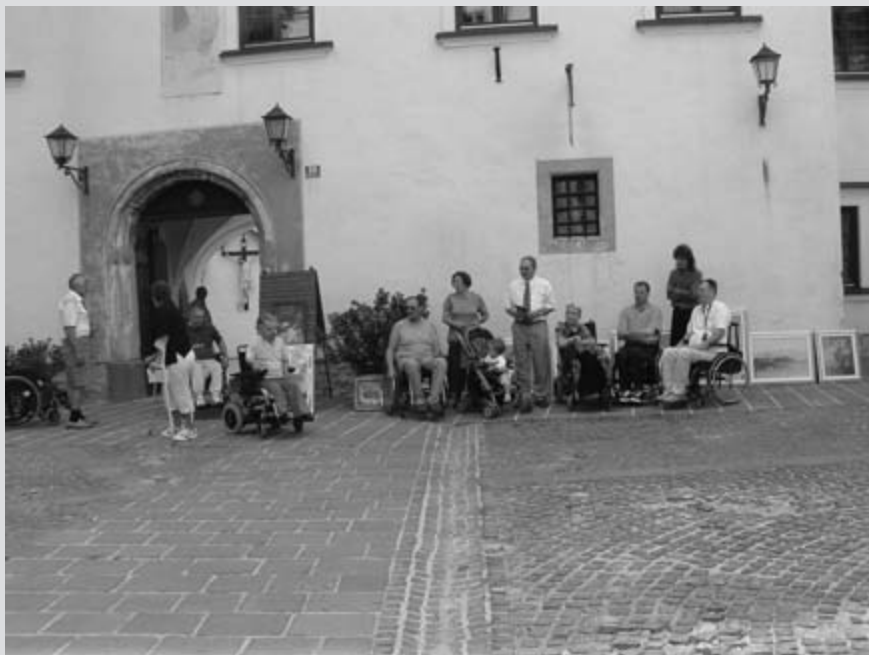
Dvorišče smo zapolnili z našimi stvaritvami in ga tako še polepšali

no za nemoteno delo. Pozdravit nas je prišel župan in si je vzel čas, da je pogledal, kako delamo, in si ogledal že gotove slike, ki smo jih za predstavitev naše likovne sekcije pri-