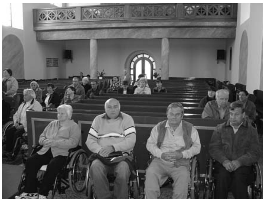
Odšli smo tudi h sveti maši

V mesecu oktobru, ki označuje tudi dan starejših, smo v okviru Društva paraplegikov Prekmurja in Prlekije pripravili popestreno srečanje tega dela članov, ki jih je med vsem članstvom več kot 60 odstotkov, kar je presenetljivo dosti, saj ob manj številčnem društvu to pomeni manj drugih aktivnosti, kjer je udeležena povprečno srednja generacija. Čedalje bolj se kažejo potrebe po programih za starejšo populacijo, tako na področju rekreativnega športa, izobraževanja, predvsem pa srečanj in socialnih programov. V te namene je zaželenih več podobnih srečanj, obiskov in pogovorov, saj se le tako obogati monotoni vsakdanjik starejših članov, posebej če so doma prepuščeni sami sebi.