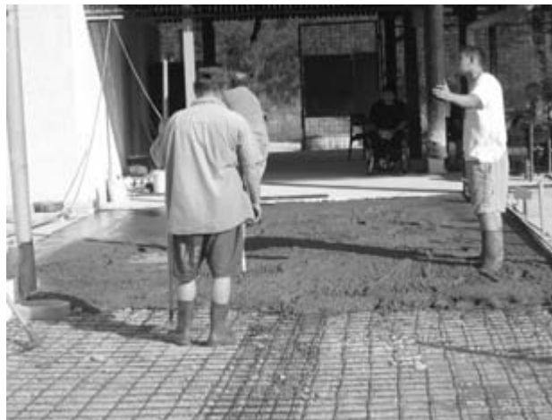
Odprava vsakršnih ovir je pomembna... za začetek pa so najpomembnejše arhitekturne, ki nam onemogočajo druženje