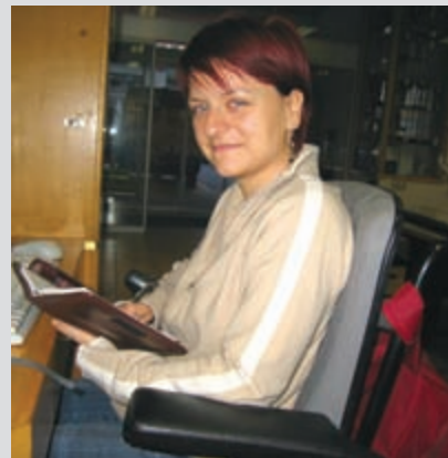
Nova urednica v elementu urednikovanja