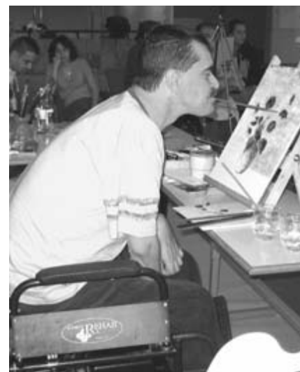
Madžarski slikar na likovni delavnici

»Invalidnost zadeva vse nas, zato jo je treba obravnavati v kontekstu naše pripravljenosti, da oblikujemo svet po meri vseh in vsakogar. Pomembno pa je, ali želimo oblikovati tak svet, ki bo vsakomur omogočil, da uresniči svoje sposobnosti,« je pouda-