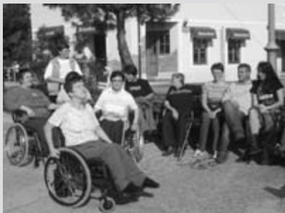
Rdeča nit ki se vleče na srečanjih, je povezana s kulinariko.

Ženske iz Aktiva žena so se za nekaj dni odpravile na Pacug. Skupna nit njihovega druženja je bilo preizkušanje v kuharskih veščinah. Pripravile so različne