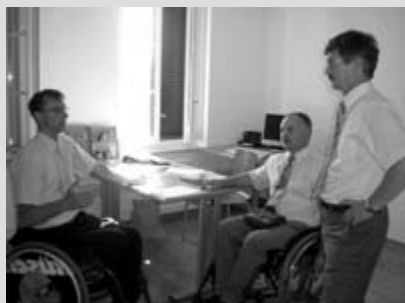
Pacug je pomemben del rehabilitacije

in druge invalide, skratka, da normalno posluje. Skupna ugotovitev je bila, da je za izvajanje posameznih programov v okviru organizacije treba imeti tudi ustrezne prostore. Osebno sem direktorju