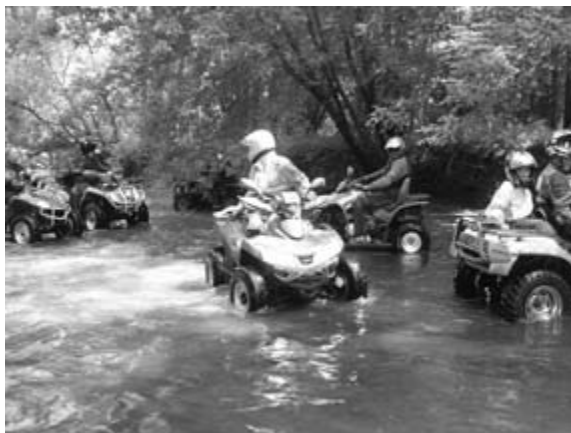
Le kdo nam kaj more?