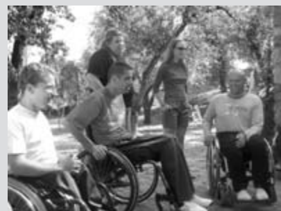
Koristno in prijetno srečanje s prostovoljci evropskih držav

Naše društvo skupaj z Zvezo paraplegikov že kar nekaj let zapored v septembru organizira mednarodni tabor prostovoljcev in naših, predvsem mladih članov. Tabor, ki privlači številno obojestransko udeležbo, pripravimo v domu paraplegikov v Semiču. No, in Bela krajina je še posebej mikavna prav ob koncu septembra, ko narava ponuja bogate sadove. Zidani-ce pod Semiško goro, obdane z vinogradi, kar vabijo na pokušino grozdja in mošta. Bližnji gozdovi že ponujajo kostanj, zraven pa še vrsto gob.