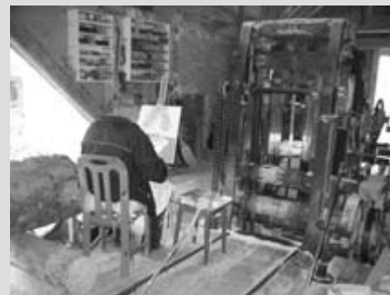
Žaga je nudila zavetje slikarjem