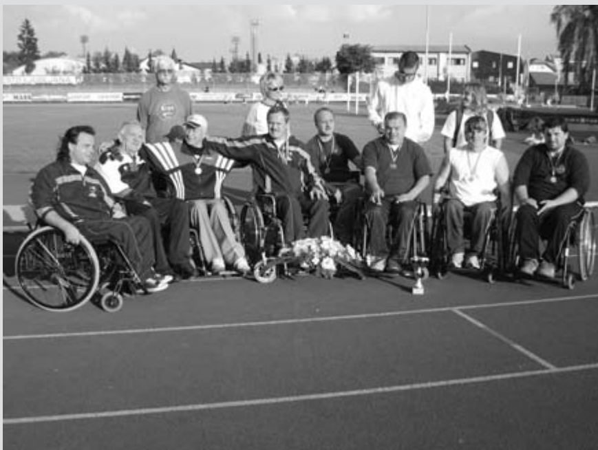
V moštveni konkurenci je prvo mesto osvojila ekipa DP jugozahodne Štajerske.