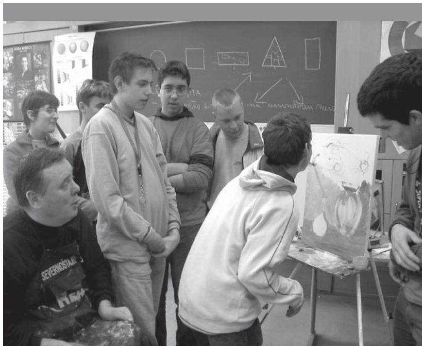
Z osnovnošolci in dijaki smo se v ZUIM-u pogovarjali o invalidnosti in poskusili slikati z usti.