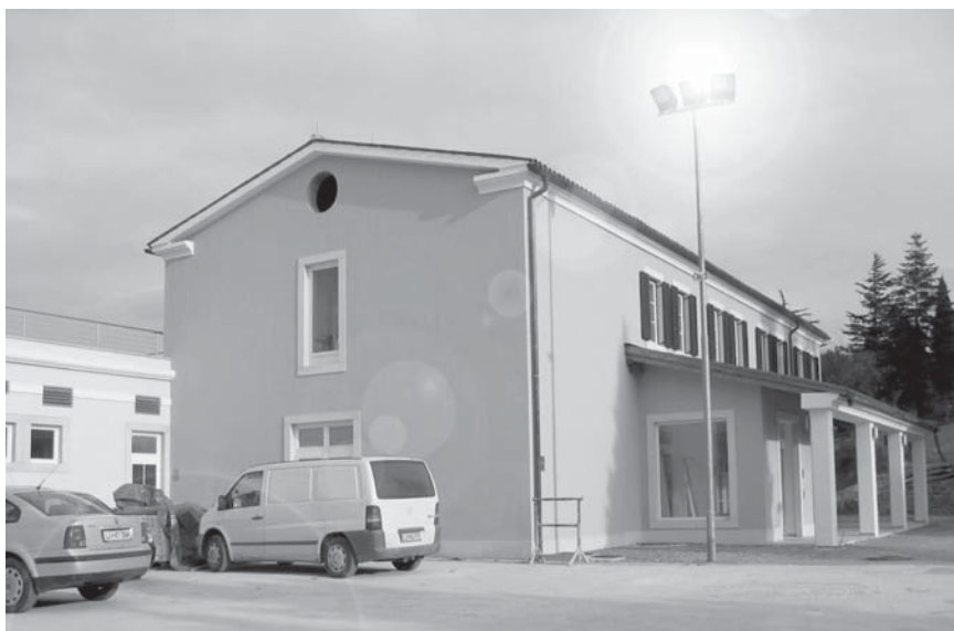
Upamo, da bodo slovenski paraplegiki in tetraplegiki že v naslednji sezoni lahko uporabljali naš dom za obnovo svojega telesnega in psihičnega zdravja.