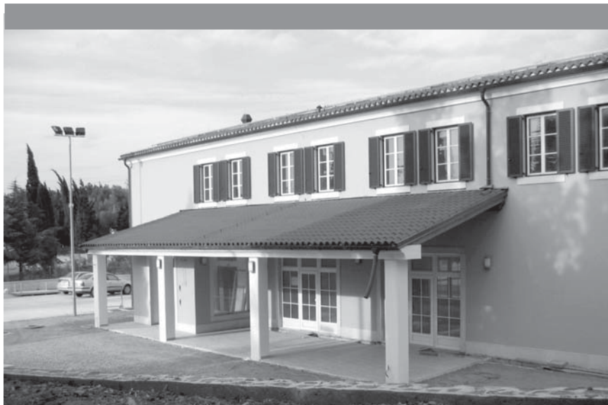
Vhod v dolgoletne sanje

Če se povrnemo v pravljice, lahko ugotovimo, da v pravljičah dobro vedno zmaga nad hudobnim. Prav tako smo prepričani tudi vsi aktivno vpleteni v zgodbi o našem Domu paraplegikov, da bo tudi pri nas zmagala resnica in bomo lahko dolgoletne sanje čim hitreje uresničili v korist vseh slovenskih paraplegikov in tetraplegikov. To pa ne bo konec naše zgodbe, temveč šele njen pravi začetek.