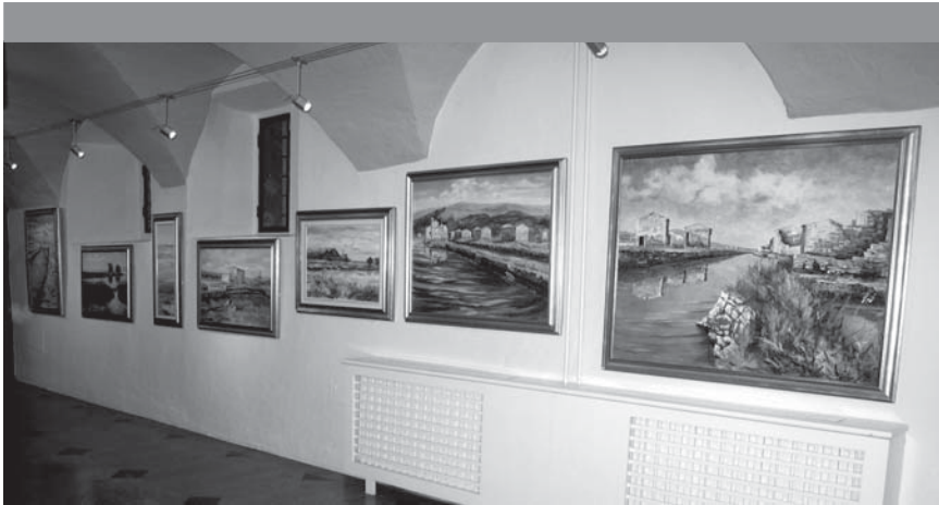
Primorske vedute slikarja Vojka Gašperuta-Gašperja na razstavi v steklenem atriju MOL

slikovita slovenska pokrajina, cikli šopkov in tihožitij. Za umetniško ustvarjanje je bil že večkrat nagrajen in je prejel številne nagrade in priznanja. Med drugimi tudi priznanje Občine Koper s plaketo.