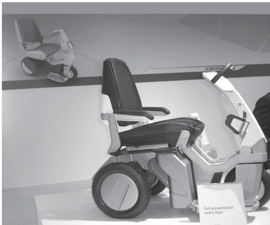
Futuristična oblika invalidskega vozička, ki omogoča vožnjo tudi po stopnicah.

Kot vredno ogleda bi priporočil še internetno stran http://www.art-of-you.de/finehandicaps/ . V naslednjem letu si bo mogoče kupiti