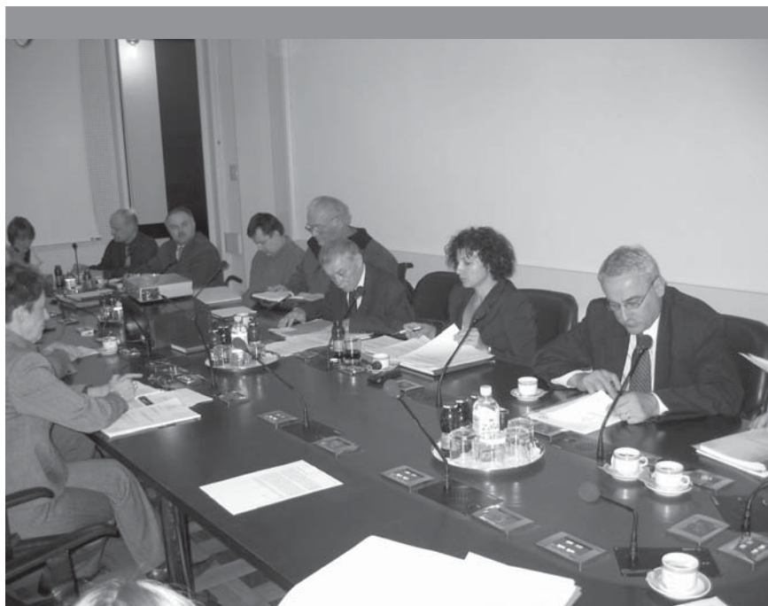
Na prvi seji smo sprejeli Poslovnik o delu in delovni program, imenovan tudi operativni delovni načrt.