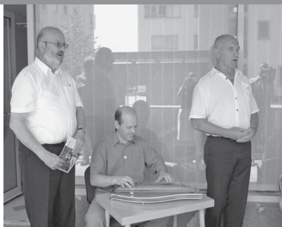
Slovesnemu dogodku so dali pečat Kamniški koledniki.

veliko truda in odrekovanja ter ogromno prispeval pri realizaciji skupnega cilja.