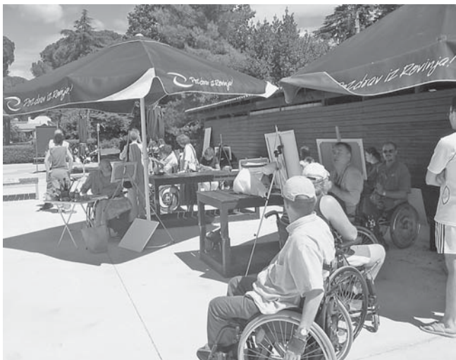
Ob slikanju smo skupaj preživel lep delovni dan.

Dogovorili smo se, da bomo tudi v prihodnje poiskali tiste dejavnosti, ki nas bodo združevale in prinašale v naše življenje tisto veliko in vznemirljivo, kar nas dela dobre prijatelje.