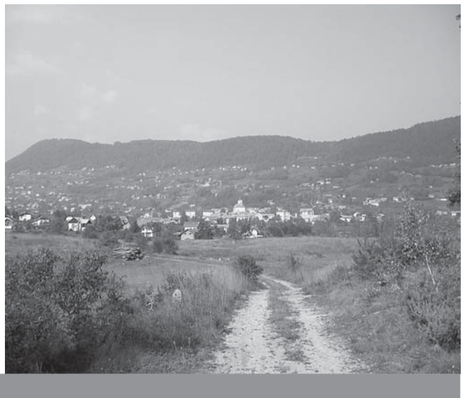
Pogled na Semič

V svojem imenu in imenu vse skupine se Društvu paraplegikov severne Štajerske zahvaljujemo, da ste nam omogočili to prijetno dopustovanje.