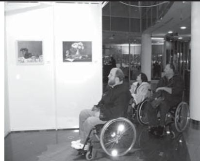
Na ogledu mednarodne razstave slikarjev v Euro Centru.