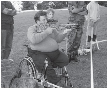
Na jasi pred gozdom so bile postavljene tudi lokostrelske tarče.

Kar naenkrat pa se je iz gozda s parom iskrih konjičev, vpreženih v