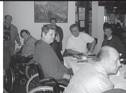
Pobude in vprašanja članov so kar deževala.

Pogovori in izmenjava mnenj so potekali še dolgo po tistem, ko se je sestanek formalno končal. Radi verjamemo, da so to srečanje vsi zelo dobro sprejeli, če že ne za konkretnejše reševanje problemov, pa vsaj za druženje in misel, da Ljubljana ni pozabila nanje. Seveda pa smo v društvu dobili podrobnejšo sliko o stanju naših članov in ... seveda odšli z obilico novih nalog.