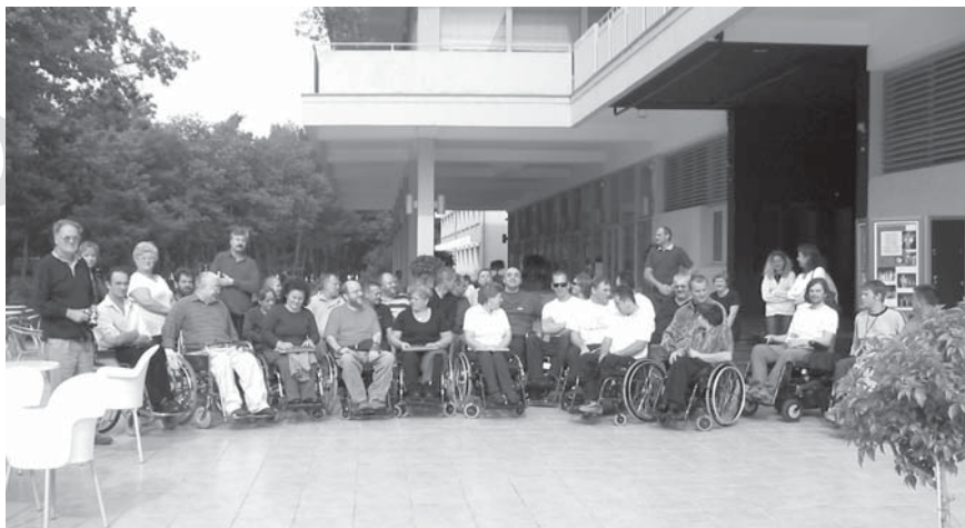
Skupinska slika pred hotelom v Umagu.