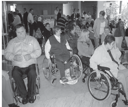
Prihod udeležencev na proslavo ob 25-letnici.

25-letno delovanje društva pa je pripeljalo do tega, da so za tako razvejano dejavnost prostori na sedanji lokaciji premajhni za nemoteno delovanje. Po premisleku in tuhtanju smo sprejeli odločitev, da