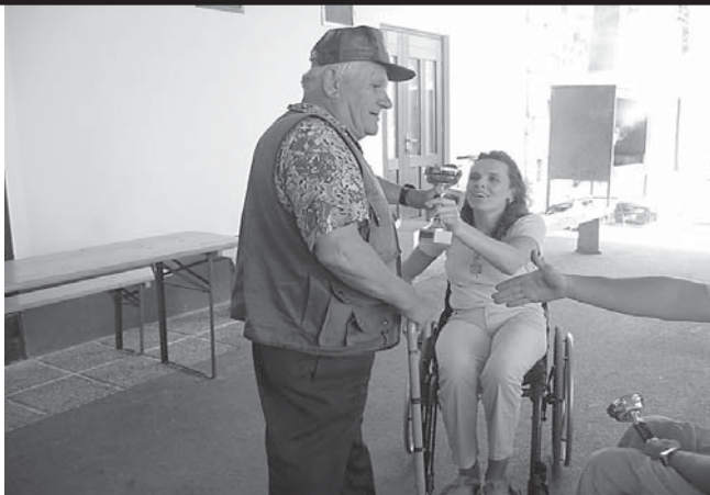
Čestitke za osvojeno prvo mesto