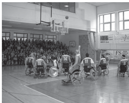
Prijateljska tekma v Osnovni šoli Žužemberk

športne dejavnosti kar preveč, toda na koncu ugotavljamo, da v vseh športnih panogah sodeluje veliko članov. Za mnoge člane je prihod na trening ali tekmo tudi prijetno druženje in ne zgolj tekmovanje.