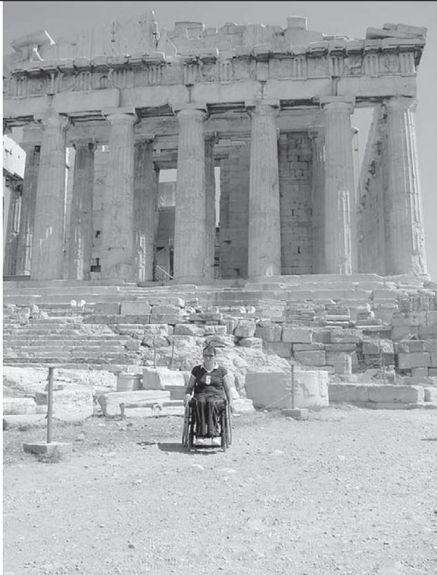
Ponos Aten s pomočjo tehnike dostopen tudi za »vozičkarje«

katerega je potekala vsa prireditve. Drevo je bilo prikazano v štirih letnih časih, ob koncu prireditve pa so prižgali olimpijski ogenj. S prižigom ognja so bile igre odprte in zame kot tudi za druge se je začel delovni del.