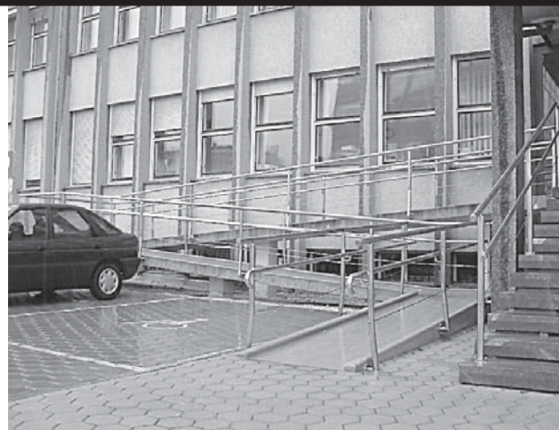
Pogled odpravljenе arhitektonske ovire stavbe kranjskega sodišča, ki je na las podobna stavbi sodišča v Novi Gorici.