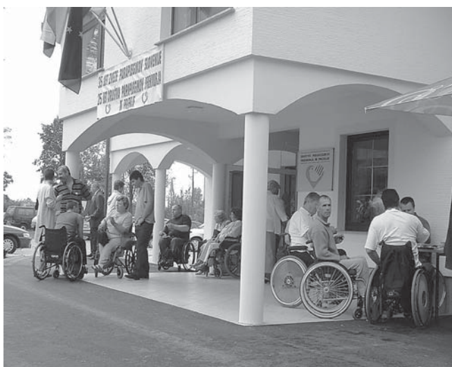
Občutkov in dela v novih prostorih se ne dajo primerjati s starimi.

Odprtje smo pripravili v sredo 15. septembra. Kljub muhastemu vremenu se je zbralo mnogo članov društva in predstavnikov drugih deželnih društev ter zunanjih sodelavcev in gostov, pogrešali smo samo predsednika Zveze, ki se iz