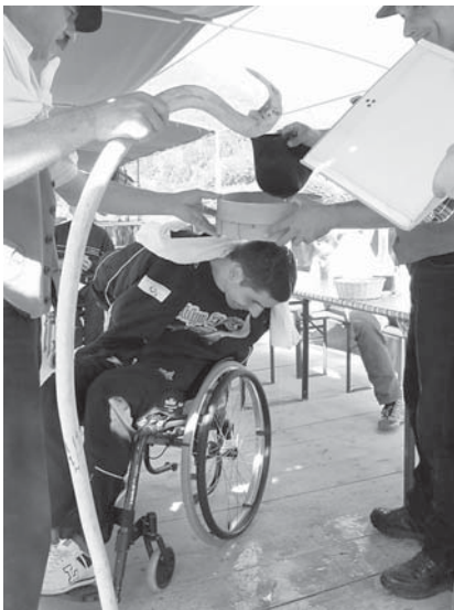
Splavarji so nam pripravili pravi flosarski krst.

Splavarji so nam pripravili pravi flosarski krst, za katerega sem bil izbran prav jaz, in to po izboru kolegov na vozičku, ne splavarjev. Naloge bodočega splavarja so bile, da mora vso vožnjo do samega krsta streči in poslušati druge goste. Vse skupaj ni bilo tako hudo, kot se sliši,