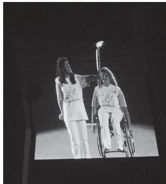
Olimpijski ogenj na otvoritvi XII. Paraolimpijade

v vas. To, da bom pa dobila kakšno kolajno, pa se mi še sanjalo ni. Ko se je po mojem tretjem metu v prvi seriji na ekranu pokazalo moje ime na prvem mestu, kar nekako nisem mogla verjeti. Ko sem pogledala malo bolje, sem videla, da je poleg mojega rezultata pisalo WR. Bila pa sem prepričana, da tega mesta ne bom dolgo zasedala, saj sem vedela, da je tekmovalka iz Južne Afrike boljša od mene. Na koncu je bilo res tako, domov sem odnesla srebrno medaljo. Po tekmi so me poklicali na dopiňsko kontrolo, ki pa je bila že moja druga. Na prvo so me poklicali že pred začetkom iger v olimpijski vasi. Ko so me novinarji po tekmi vprašali, kakšni so moji občutki že ob drugi osvojeni medalji, se pravzaprav še nisem zavedala, kaj vse sem dosegla. Ta občutek sem dobila šele dan po vrnitvi domov, ko so me v moji vasi pričakali vsi od blizu in daleč, in takrat sem bila zelo ponosna sama nase in na vse svoje uspehe. Veliko presenečenje so mi pripravili tudi v šoli, kjer sem zaposlena. Na prireditvi so mi podelili še zlato kolajno za vse moje dosežke na XII. paraolimpijskih igrah in mi dejali: »Zvezde so večne.«