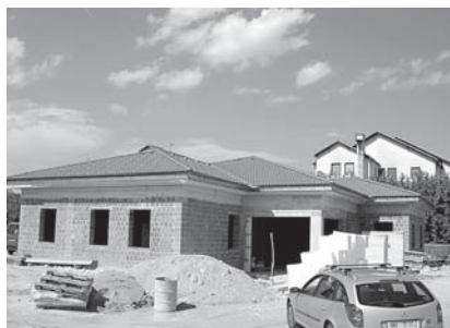
Novi delovno-bivalni postori v gradnji (trenutno že zaprto).

se lotimo gradnje novih delovno-bivalnih prostorov. Pred tem je bilo treba poiskati ustrezno parcelo in pričeti razpravo med čim več člani, da sodelujejo s svojimi bogatimi izkušnjami pri idejni in prostorski zasnovi prihodnjih prostorov.