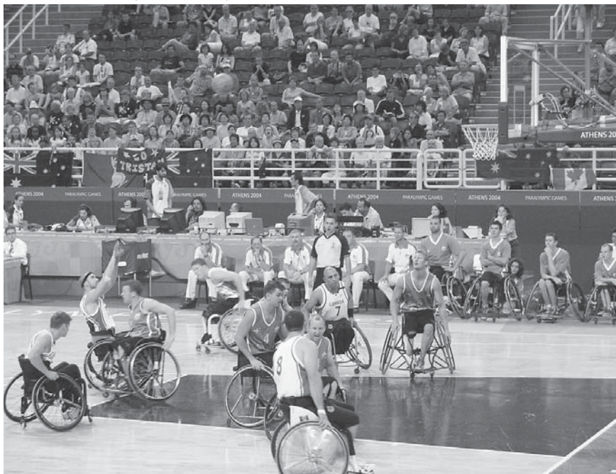
V Atenah si je v povprečju vsako tekmo ogledalo okoli 5000 gledalcev, to pa je že številka, ki nekaj pomeni.

Želel sem si videti več tekem naših tekmovalcev, vendar razen nekaj atletike in malo odbojke na vozičku drugih športov nisem videl v živo. Največ časa sem preživel v dvorani, kjer se je igrala košarka na vozičkih. To je tista ogromna dvorana sredi centra OAKA, kjer so na olimpijskih igrah tekmovali tekmovalci v gimnastiki. Tekmovanja so potekala vse dni od pol devetih zjutraj do polnoči. Tekmovalo je 12 moških in 8 ženskih ekip. Košarka na vozičku je v zadnjih dveh letih od svetovnega prvenstva na Japonskem izredno napredovala. Pridobila je večjo hitrost in predvsem moč. Atraktivnosti ji ne manjka, prav