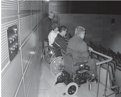
Na pobudo društva bodo odslej naprej tudi ljudje z vozička nemoteno spremljali prireditve v kulturnem hramu v Novem mestu.

njih pa je največ za občane nujnih uradov in ustanov.