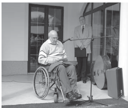
Odprtje Doma je bilo v sredo 15. septembra 2004.

Razmišljanje nas vseh o lastnih delovno-bivalnih prostorih sega že v čas ob ustanovitvi društva, konkretno in resen začetek pa je bil ob 20-letnici delovanja našega društva. Tega leta smo namreč dobili od mestne občine Murska Sobota gradbeno parcelo v velikosti 17 arov, ob tej priložnosti smo dobili tudi sliko občine, ki naj krasi nove prostore. Žal je ta slika čakala polnih pet let, da smo jo lahko obesili na svoje mesto, in to ob letošnjem odprtju.