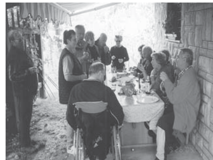
Prvi mož Kliničnega centra (prvi z desne) s sodelavci in prijatelji ocenjuje letnik cvička 2004 pri Okornu.