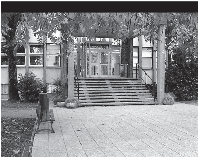
Grajena ovira novogoriškega sodišča nam onemogoča normalen dostop in samostojno opravljanje opravil.