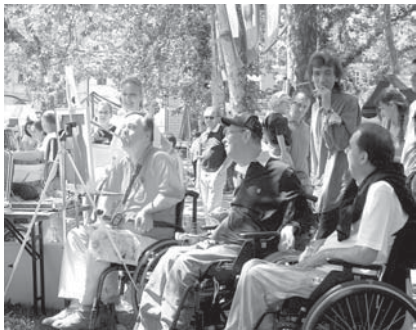
Tako je bila videti delavnica v parku Zvezda v Ljubljani.