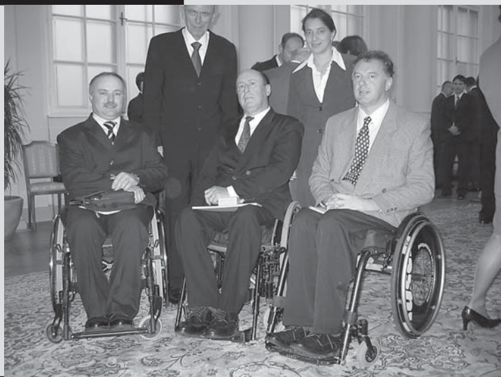
Ob podelitvi reda za zasluge ob 35-letnici organiziranega delovanja predstavniki ZPS s predsednikom Drnovškom.