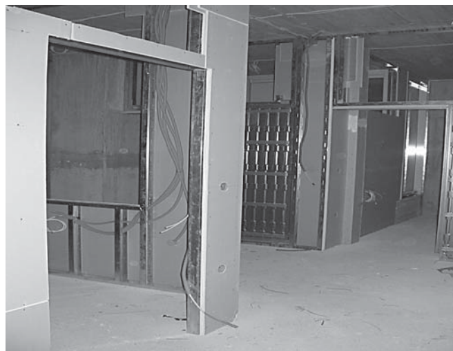
Kako potekajo dela na novi lokaciji delovno-bivalnih prostorov ljubljanskega društva

Z veseljem vam sporočam, da se je slabo leto po nakupu delovno-bivalnih prostorov Društva paraplegikov ljubljanske pokrajine stanje mirovanja izgradnje premaknilo z mrtve točke. Kot veste, je prostore v tretji podaljšani gradbeni fazi za