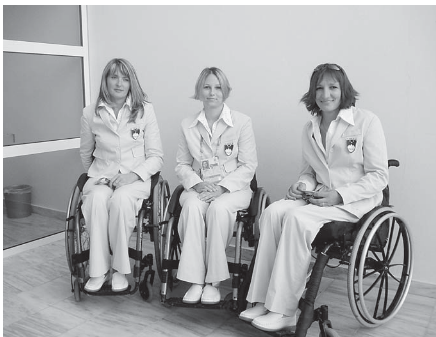
Najuspešnejše športnice letošnje paraolimpijade so bile naše članice.