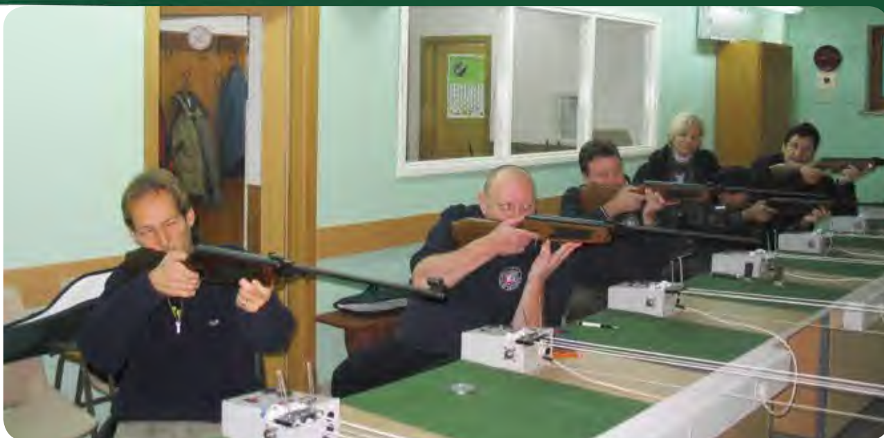
Ekipo naših strelcevna treningu v Ankarahnu.