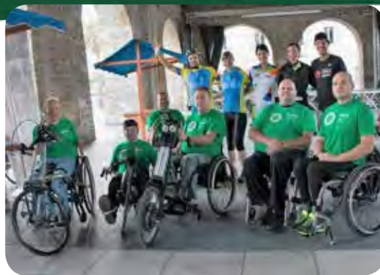
Z električnimi priklopi se je po Kopru prav lepo zapeljati v družbi s prijatelji.