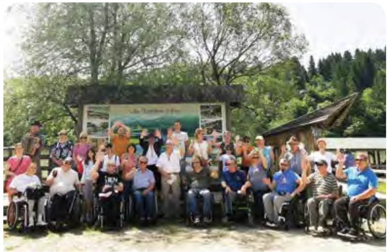
Na splavarjenju v velikem številu.