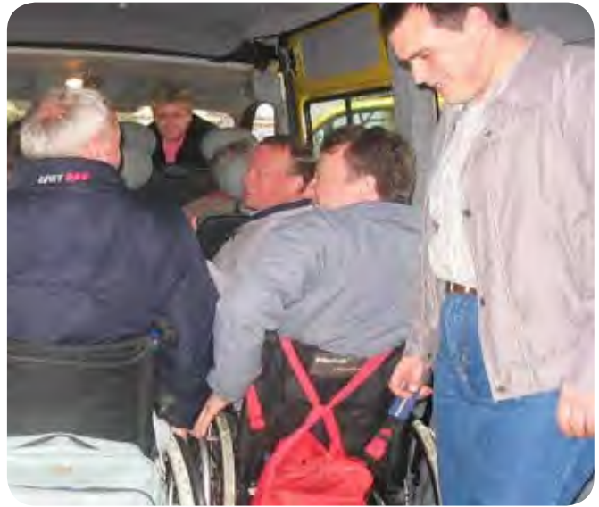
ASISTENTKA PARAPLEGIKA IZ KOPRA

NO ASISTENTKO. GLEDE NA TO DA SEM ŽE IMELA NEKAJ INFORMACIJ O TEM DELU SEM SE PRIJAVILA NA RAZPISANO PROSTO DELOVNO MESTO IN BILA SPREJETA. VESELA IN MALO V DVOMIH ALI BOM ZMOGLA SEM POSTALA OSEBNA ASISTENTKA OSEBI NA INVALIDSKEM VOZIČKU. SPRVA SEM IMELA DVA VAROVANCA IN OBA STA ME LEPO SPREJELA V SVOJO BLIŽINO IN V SVOJ DOM, ZA KAR SEM OBEMA ZELO HVALEŽNA. SEDAJ IMAM LE ENEGA IN MI JE VELIKO LAŽJE OPRAVLJATI MOJE DELO. ŽE PRVI DAN MI JE PREDSTAVIL SVOJE POTREBE PO POMOČI KI JO POTREBUJE IN PRIČAKUJE OD MENE. SEDAJ SEM OSEBNA ASISTENTKA NEKAJ LET IN SVOJE DELO Z VSEM VESELJEM OPRAVLJAM. VSI STRAHOVI IN DVOMI, KI SEM JIH IMELA NA ZAČETKU SO BILI ODVEČ. SPOZNALA SEM, DA SO TO ČISTO PREPROSTI LJUDJE, KI POTREBUJEJO NAŠO POMOČ PRI VSAKODNEVNIH OPRAVLJANJH, KI JIH MI HODEČI NAREDIMO BREZ KAKRŠNEGA KOLI PROBLEMA IN OVIR. ZA NJIH PA JE ŽE OBLAČENJE LAHKO PRAVI PODVIG. UPAM, DA SE BOVA ŠE NAPREJ TAKO LEPO RAZUMELA, DA BO OBEMA LAŽJE PREŽIVETI URE IN DNEVE KO SVA SKUPAJ PRI VSAKODNEVNIH OPRAVLJANJH IN PODVIGIH.