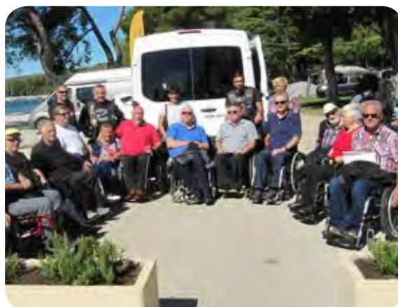
Uradni prevzem kombiniranega vozila.