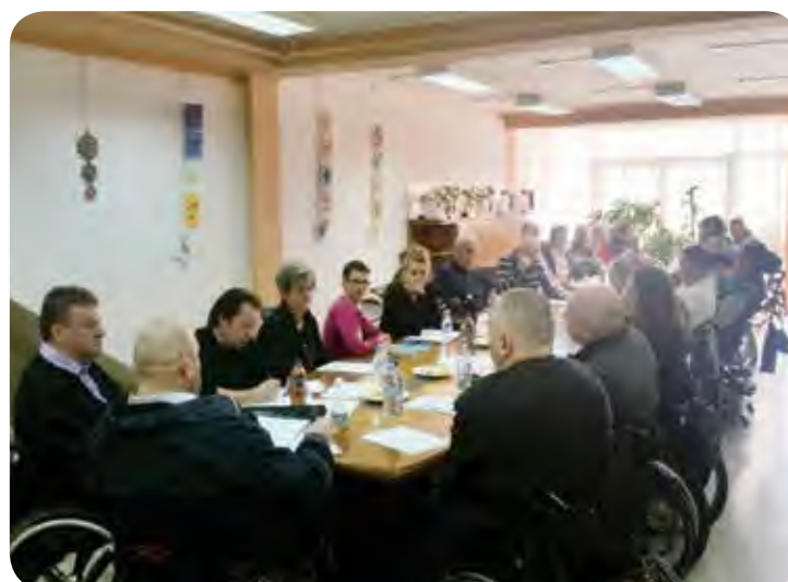
Na skupščini društva skupaj s predstavniki Zveze paraplegikov Slovenije.