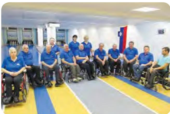
Kegljaška ekipa v majicah društva.