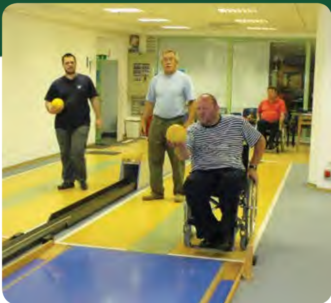
V Bonifiki redno organiziramo kegljaška tekmovanja.